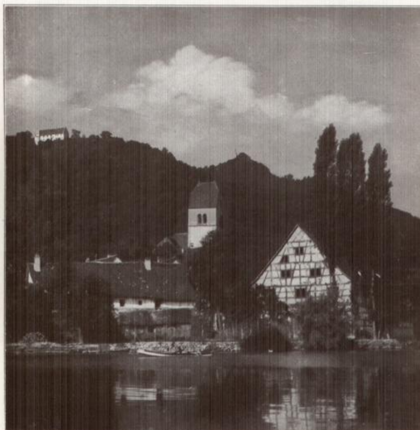
Bodman am Bodensee

liegt abseits der großen Dampferstraße des Schwäbischen Meeres, aber gerade deshalb steht es auf der Wanderliste des wahren Naturfreundes.