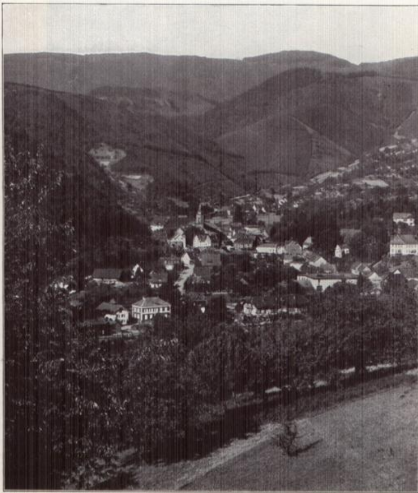
Oppenau im Necktale,

ein aus dem Kranze der Berge bestrichend entgegenlächelndes Städtebild. Oppenau ist ein vielbesuchter Luftkurort mit hübschen Kuranlagen und zugleich der vorteilhafteste Stützpunkt für die Welt des Kniebis mit seinen Aussichtspunkten, Hochmoorseen, Wasserfällen und Waldesjamkeiten.