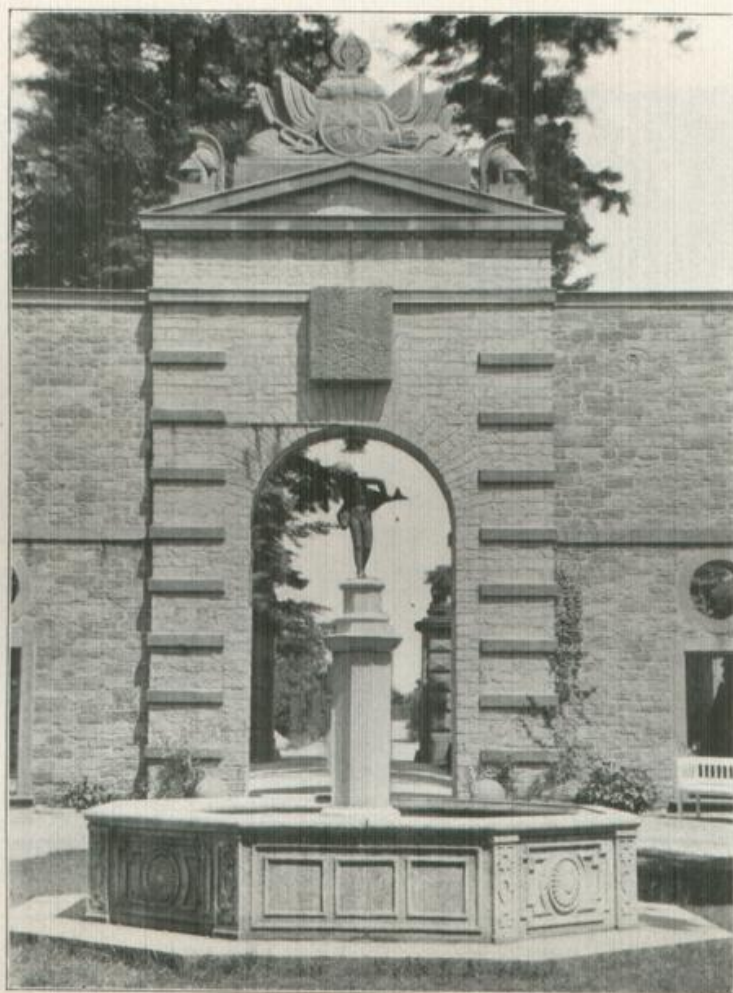
Sanatorium und Kurhaus Bühlerhöhe

im nördlichen Schwarzwalde, zur Vannmeile Baden-Badens gehörend, genießen weit über die Grenze Deutschlands hinaus einen Weltruf als erstklassige Heil- und vornehme Kurgasstätten.