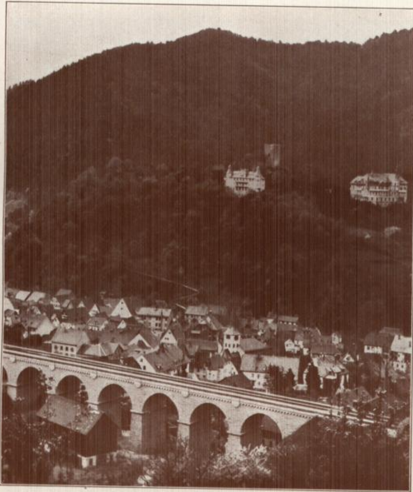
Hornberg an der Schwarzwaldbahn.

Mit seinen prächtigen Bergen und Wäldern ist Hornberg ein typisches Schwarzwaldstädtle, gleich beliebt bei Wandersleuten wie bei Kurgästen und Sommerfrischlern.