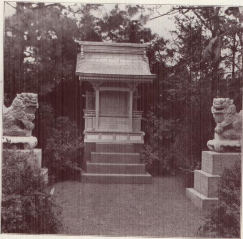
Karlsruhes japanischer Tempel.

Einen der schönsten Stadtgärten Deutschlands darf Karlsruhe, die sehenswerte Hauptstadt des badischen Landes, sein eigen nennen. Schöpferische Gartenkunst im Verein mit einem ausgesprochenen architektonischen Empfinden haben hier ein Garten-Juwel erkunden lassen, das jeder Besucher des Schwarzwaldes auf sein Reiseprogramm setzen sollte.