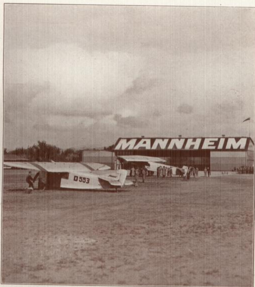
Der Flughafen Mannheim

ist nicht nur der Zentralflughafen für Mannheim, die Handelsmetropole am Rhein und Neckar, für Heidelberg und Ludwigshafen, sondern auch der Hauptfluggelände des badischen Landes.