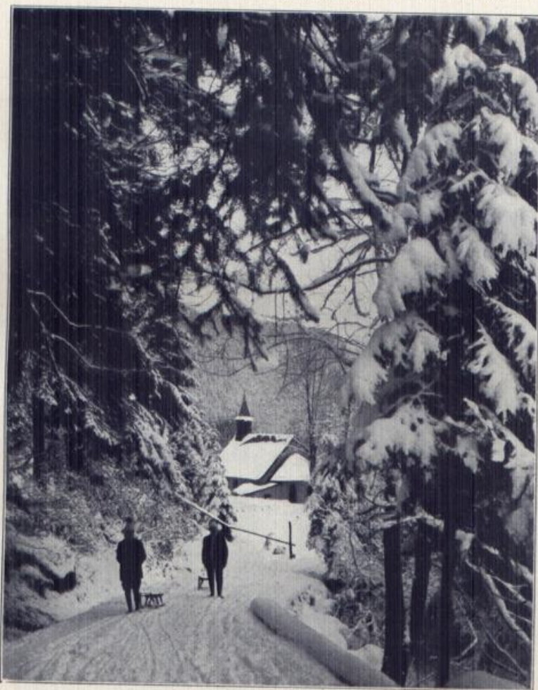
Winter in Triberg.

Triberg, der mit Recht weltberühmte Sommer- und Winterkurort an der Schwarzwaldbahn, ist der einzige Wintersportplatz des Schwarzwaldes, wo alle Sportarten: Ski, Bob, Rodel und Eislauf in gleicher Weise gepflegt werden. Vorzügliche Hotelunterkunft und gemütvolle Geselligkeit rechtfertigen den Weltreuf Tribergs.