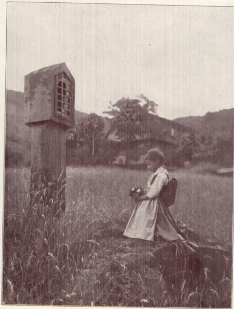
„Grüß Gott im schönen Badnerland!“