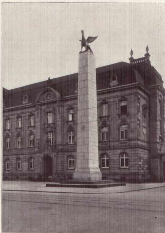
Das Karlsruher Grenadierdenkmal.

Stolz wie das badische Leibgrenadier-Regiment in der deutschen Seeresgeschichte dasteht, erhebt sich heute das Erinnerungsdenkmal für die gefallenen Grenadiere in der badischen Landeshauptstadt. Das Denkmal ist von den Architekten Gruber und Gutmann, der badische Greif von Bildbauer Karl Dietrich. Eigentum des Verkehrsvereins Karlsruhe.