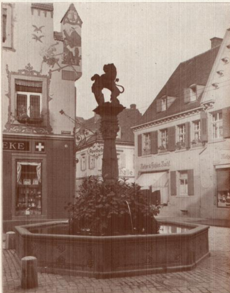
Offenburg, die Verkehrszentrale Mittelbadens.

Als Ausgangspunkt der Schwarzwaldbahn ist Offenburg ein Verkehrsnotenpunkt ersten Ranges. Dies und eine reiche ländliche Umgebung sind die Ursachen regen geschäftlichen Verkehrs.