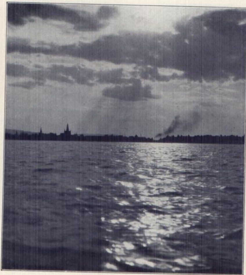
Konstanz am Bodensee.

Invergeßlich bleibt jedem eine Fahrt über den stolzen blauen Bodensee. Wer aber in der Abendstimmung durch das Gold der sinkenden Sonne der wundervollen Silhouette der seeherrschenden alten Stadt entgegenfahren durfte, dem wurde ein Vollgenuß an Lebensfreude zuteil. . . .