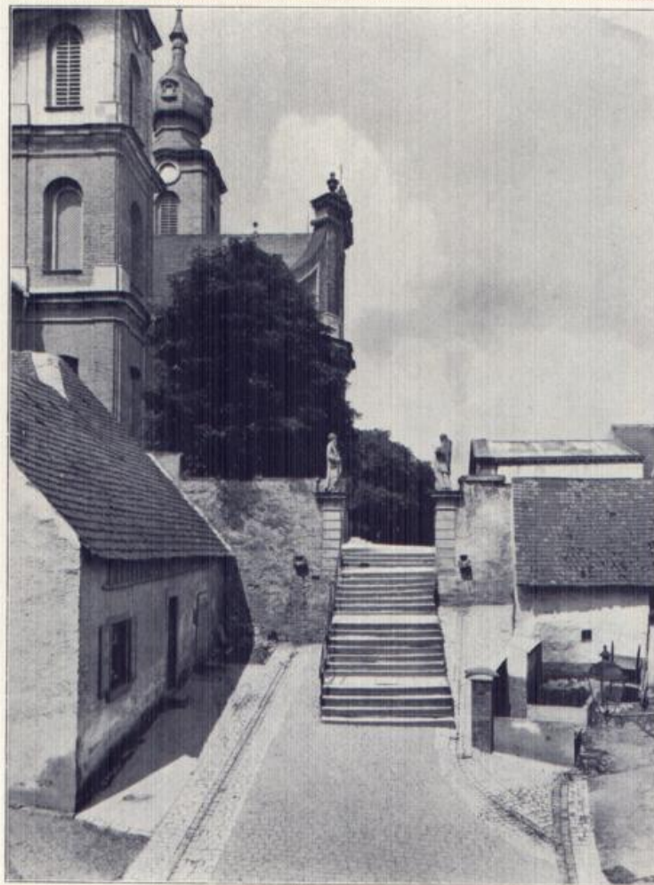
Wertheim am Main.

Die landschaftlichen Reize und künstlerischen Köstlichkeiten des badischen Landes beginnen in seinem nördlichsten Punkte mit Wertheim am Main und enden mit dem südlichsten: Konstanz am Bodensee. Wertheim bietet eine so unererschöpfliche Fülle von überraschenden Werten und Schönheiten, daß es mit Recht mehr und mehr zum Ziel des Reiseverkehrs wird.