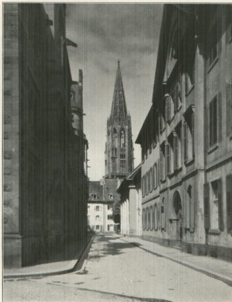
Das Freiburger Münster.

Unerreicht und unübertroffen ist der Freiburger Münsterturn „die erste Blüte und zugleich die reife Frucht der Turmbaukunst der deutschen Gotik“ (Bischof Paul Wilhelm von Keppeler).