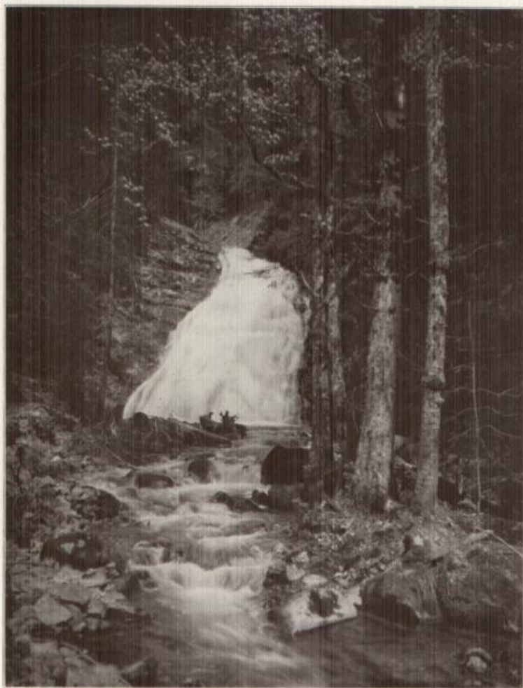
Waldeszauber bei Todtmoos.

Rauschende Wasserfälle in düsterer Waldesschlucht sind charakteristische Merkmale des romantischen Schwarzwaldes. Kein Mittelgebirge Europas hat so viel Waldromantik aufzuweisen wie der Schwarzwald.