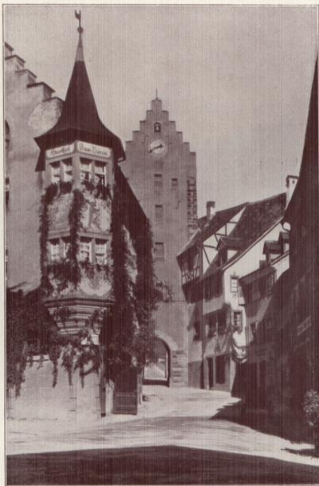
Meersburg am Bodensee.

Wie ein romantisches Märchen mutet das aus den blauen Fluten des Bodensees emporstehende, an hochstrebende Felsen angeschmiegte Städtlein an. Ein Stück echtes Mittelalter ist uns mit feinen traulichen Plätzen, Gassen, Mauern, Toren, Giebeln und Zinnen erhalten geblieben.