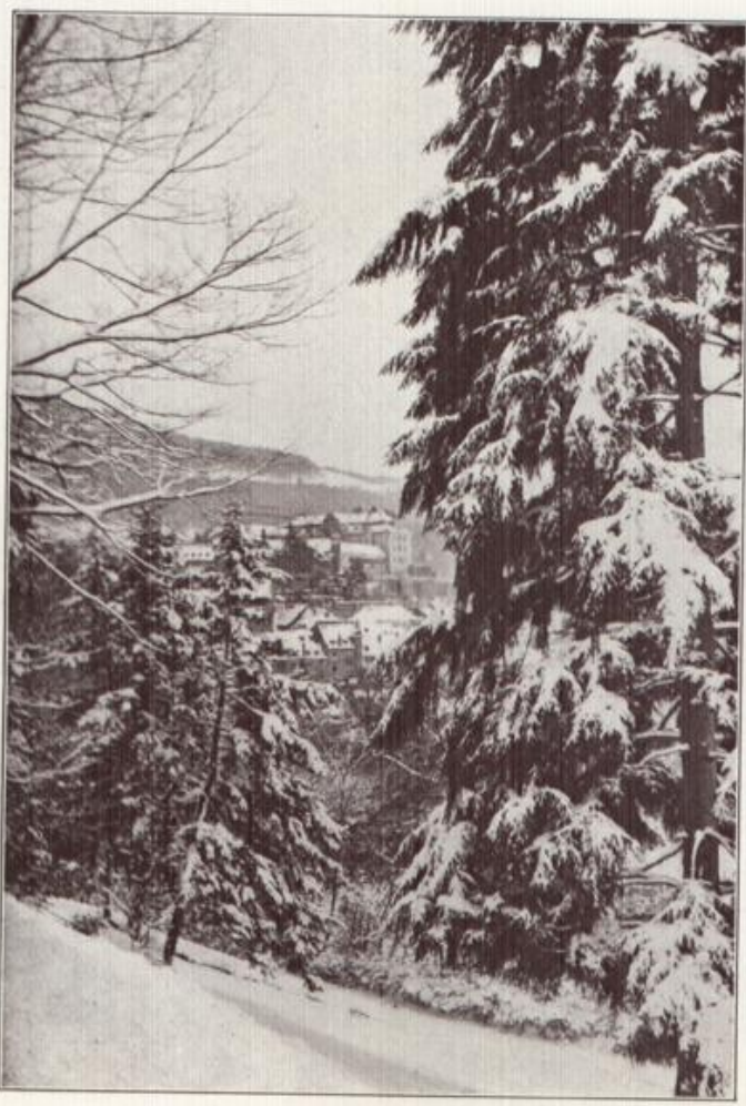
Baden-Baden im Winter.

Nicht nur im Sommer ist Baden-Baden die Königin der Schwarzwald-Bäder, auch im Winter wird der Kurbetrieb durchgeführt zum Segen von Kranken und Erholungsbedürftigen.