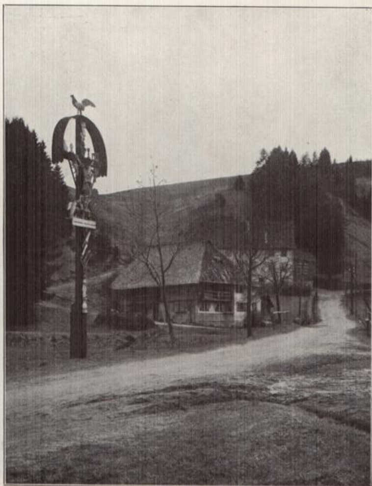
Bei Schönach im Schwarzwald.

Passionskreuze in Tälern und auf Höhen zeugen vom frommen Sinn des Schwarzwälders.