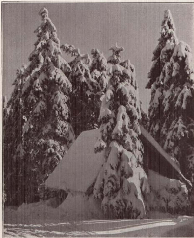
Winteridyll am Mummelsee im nördlichen Schwarzwald.

Badischer Kalender Herausg.: Bad. Verkehrsverband, Karlsruhe / Verlag: Karl Schmitt, Heidelberg / Druck: C. A. Wagner Buchdruckerei A. G., Freiburg i. S.