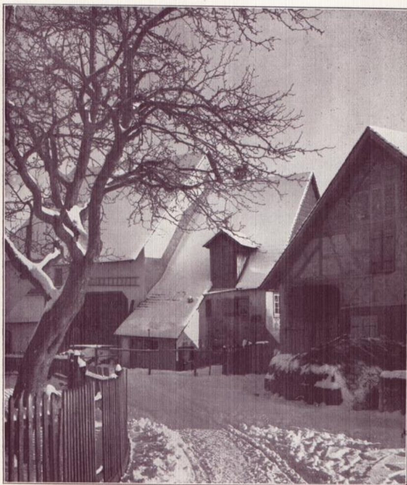
Überlingen-Dorf im Winter