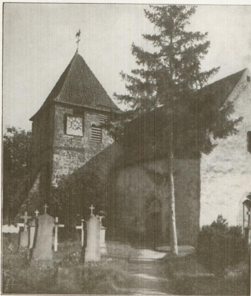
Die Dorfkirche in Eichel bei Wertheim, das älteste Gotteshaus Badens