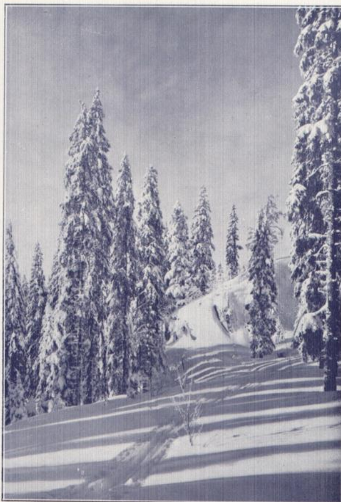
An der Farnwitte im Feldberg-Gebiet