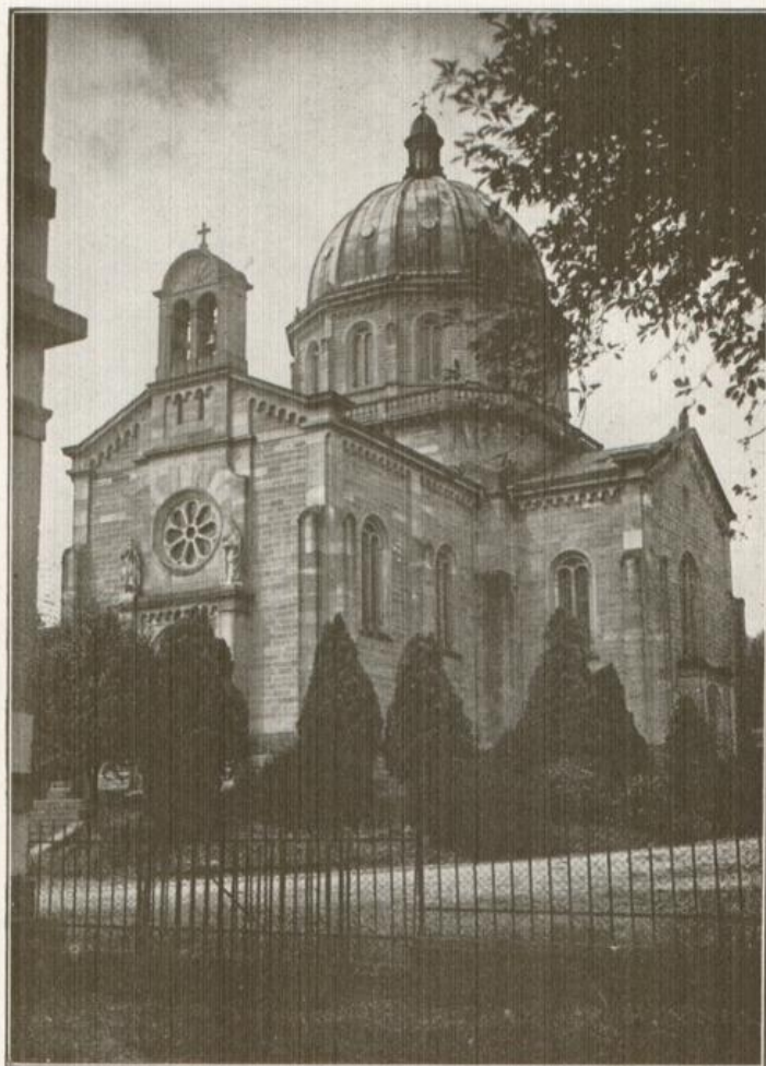
Die Christuskirche in Lahr