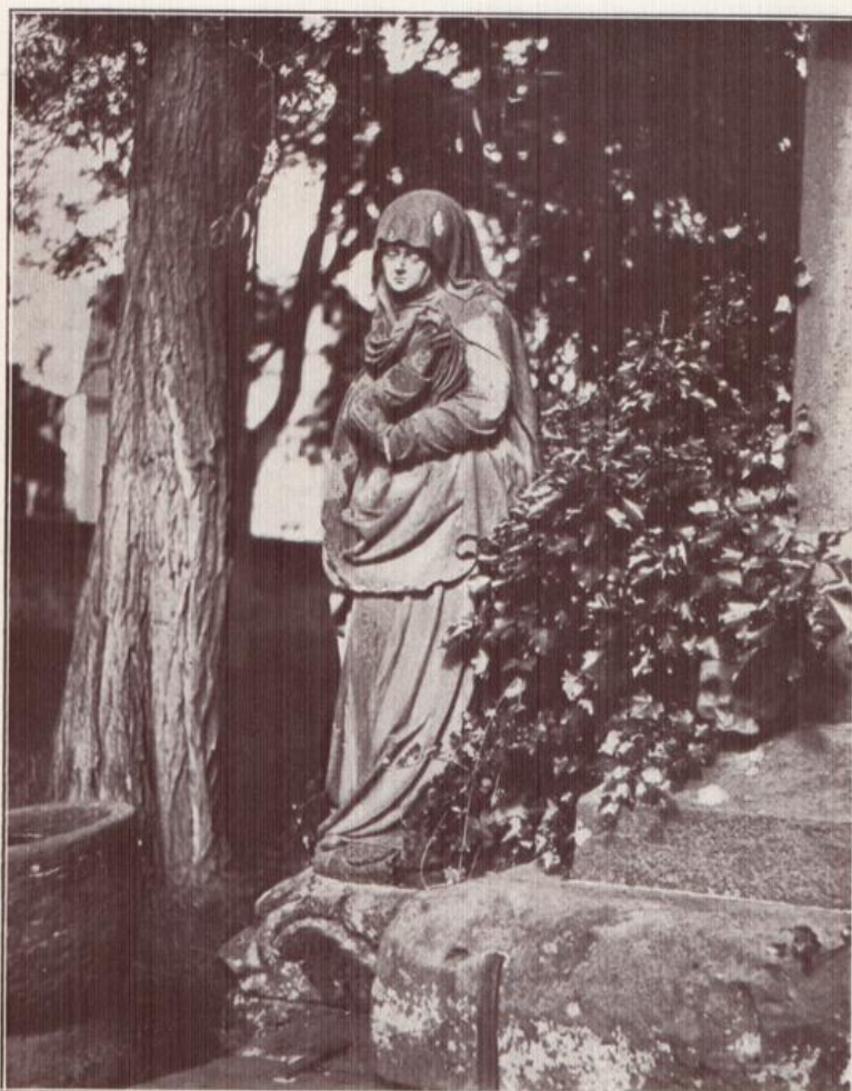
Ein Denkmal christlicher Kunst: Mariafigur zum Kreuz aus einem Stück aus dem Jahre 1569