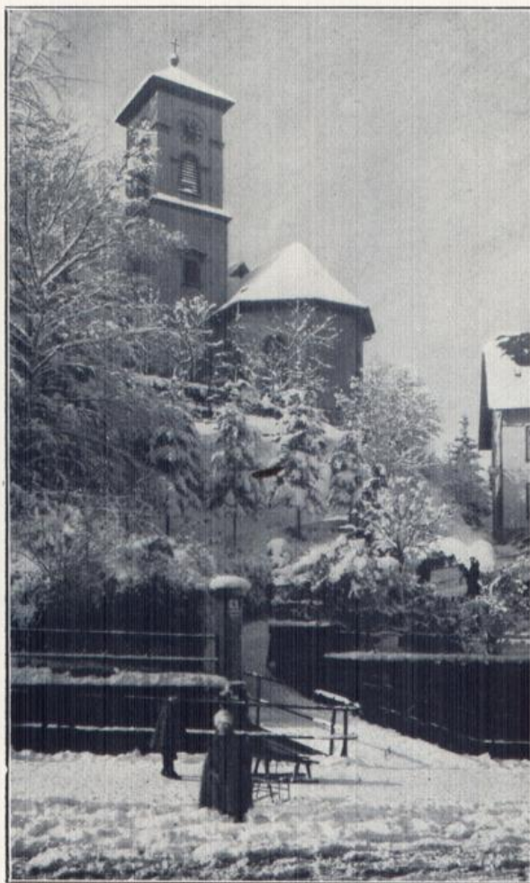
Triberg: die Stadtkirche im Winterschmuck