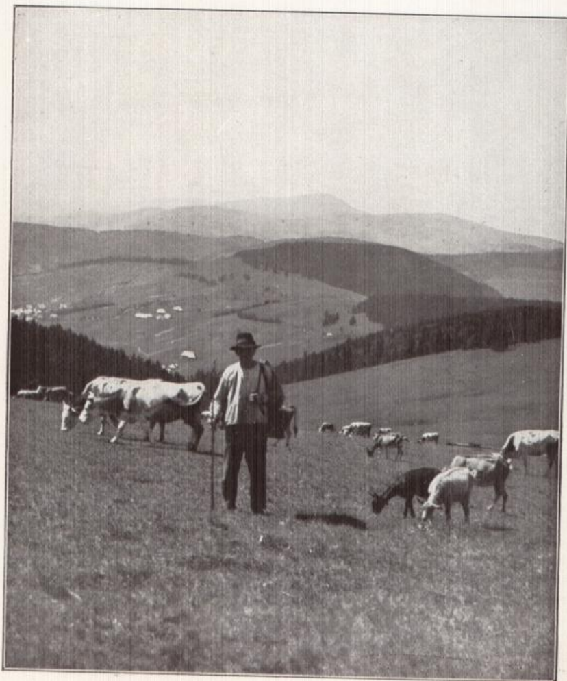
Auf des Feldbergs Höhen, Belchenbild

Aus dem fotogr. Wettbewerb des Bad. Verkehrsverbandes.