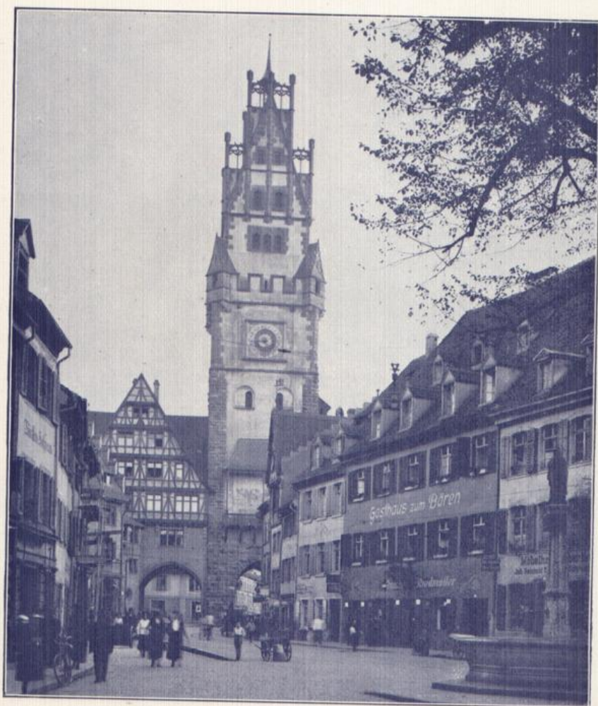
Das Schwabentor zu Freiburg i. B.