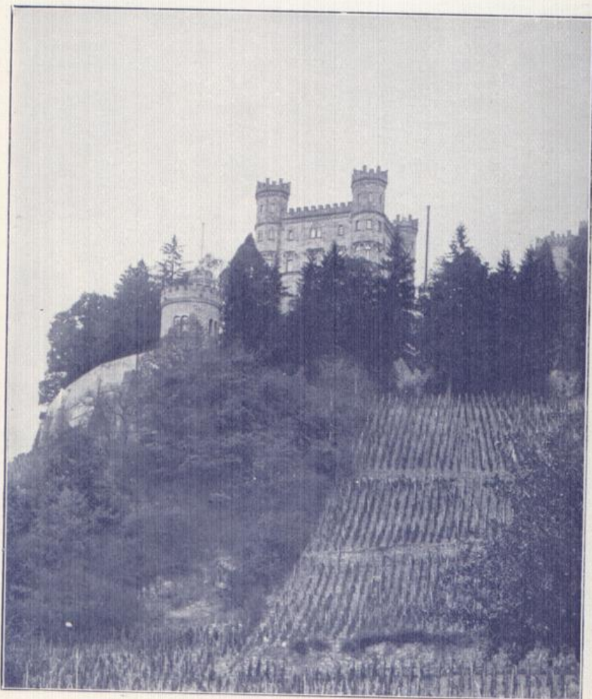
Schloß Ortenberg, das Wahrzeichen der weinreichen Ortenau