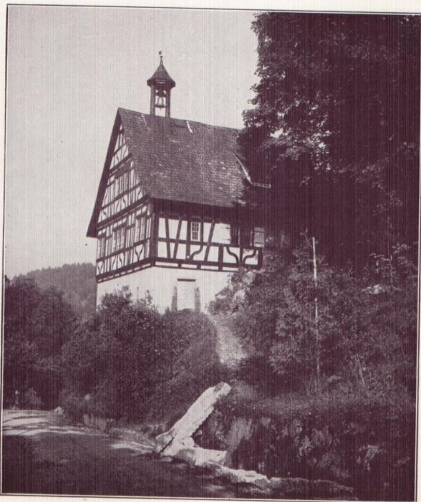
Das Heimatmuseum zu Triberg, Prachtstück eines alten Fachwerbbaues