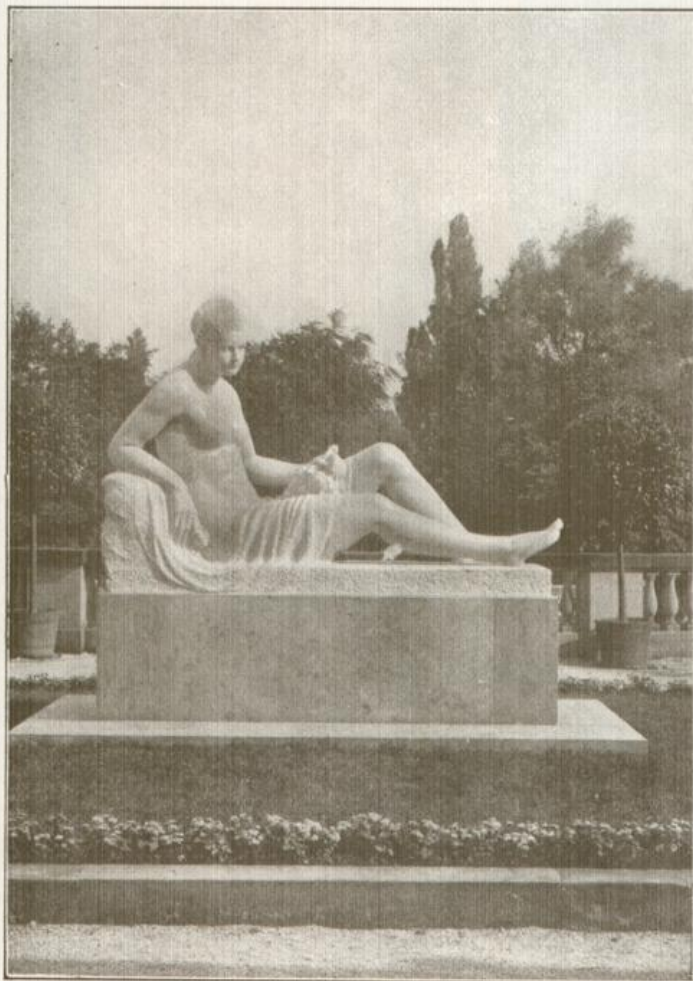
Die „Flora“ im prächtigen Karlsruher Stadtgarten

Badischer Kalender Herausg.: Bad. Verkehrsverband, Karlsruhe / Verlag: Karl Schmitt, Heidelberg / Druck: C. A. Wagner Buchdruckerei A.G., Freiburg i. B.