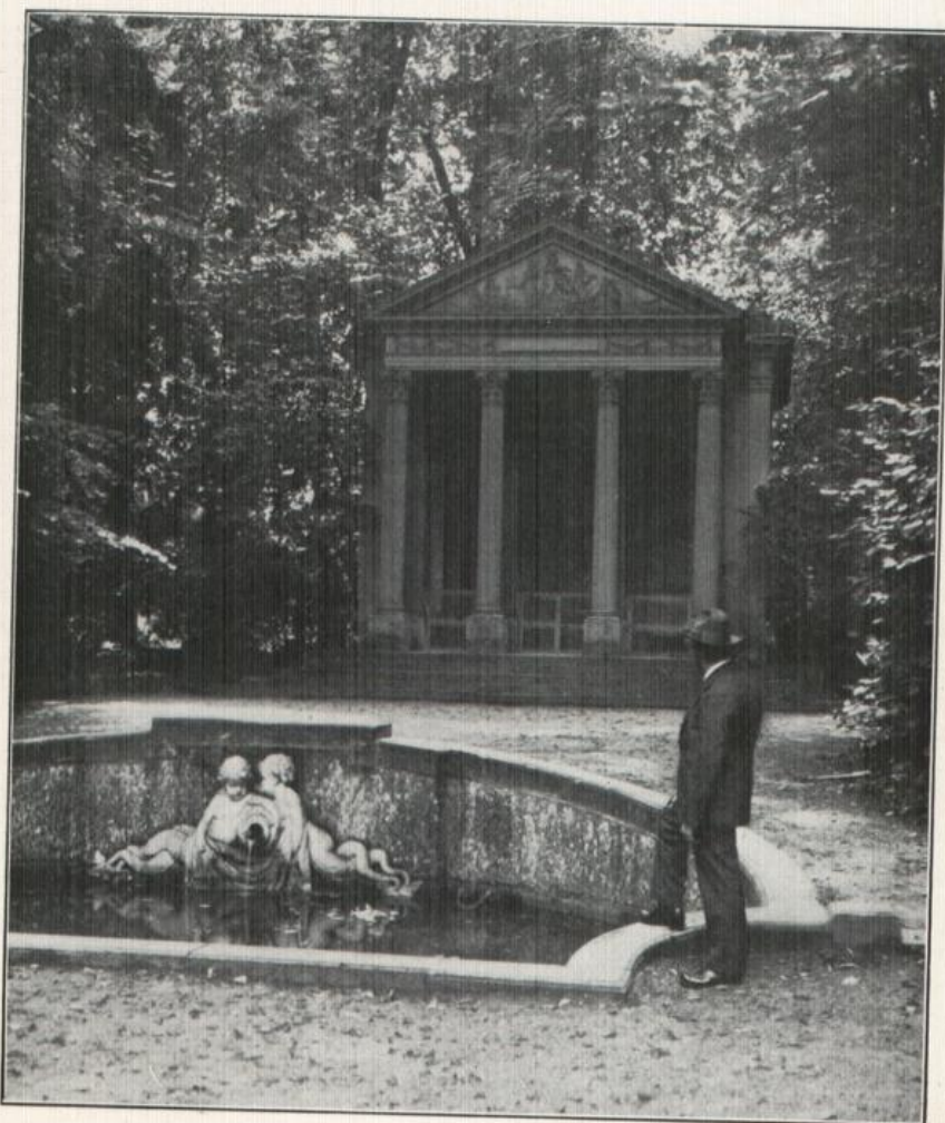
Tempel der Minerva im Schwefinger Schloßpark