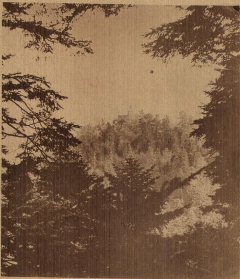
Schloß Eberstein im Murgtal.