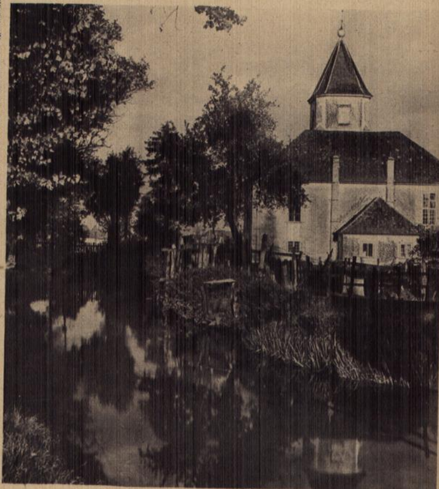
Kirchlein an der Alb, bei Karlsruhe-Küppurr.