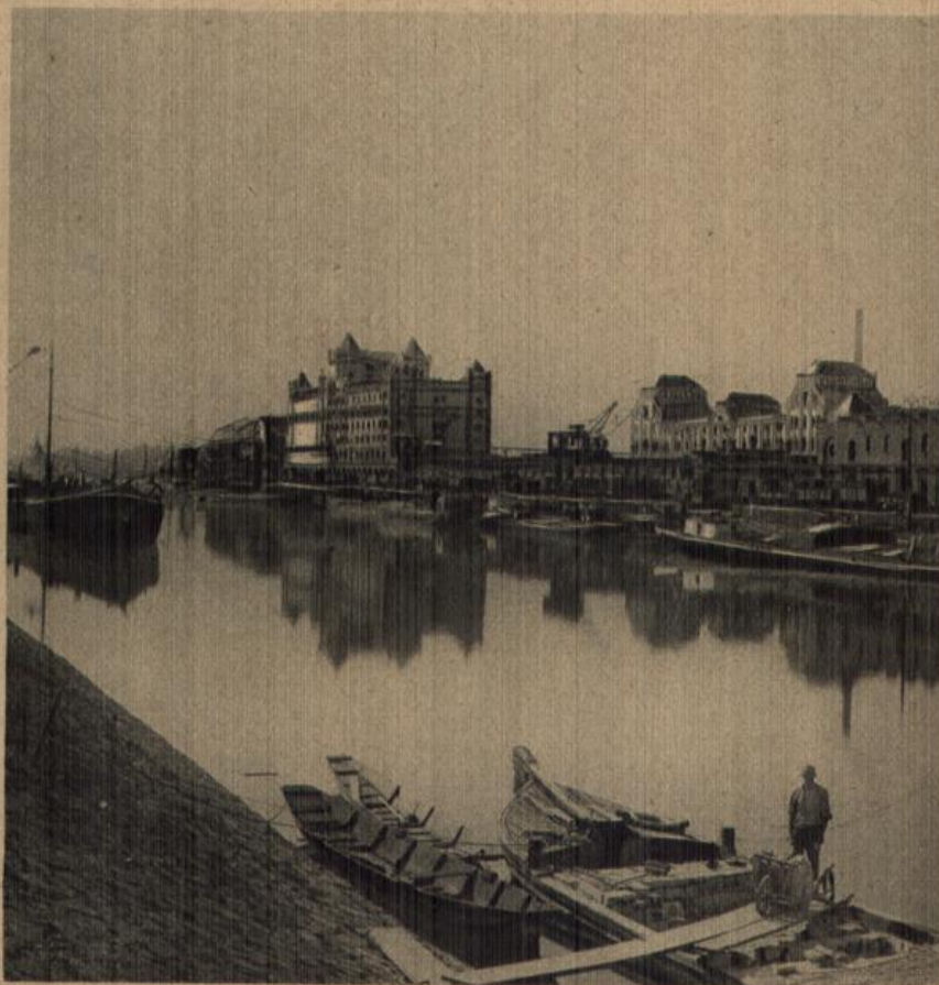
Karlsruhe: Am Rheinhafen.