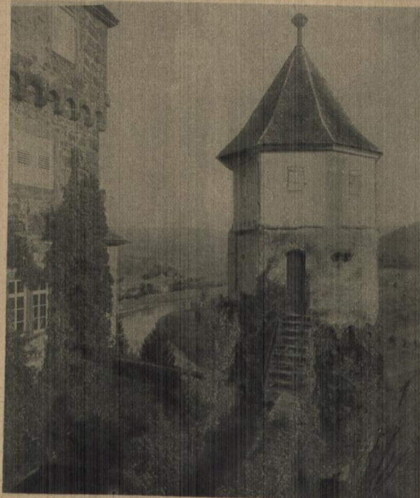
Schloß Zwingenberg am Neckar: Uhrturm.