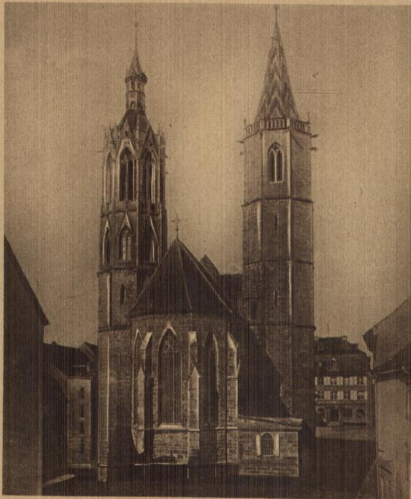
Villingen: Das Münster in der Schwarzwaldstadt.