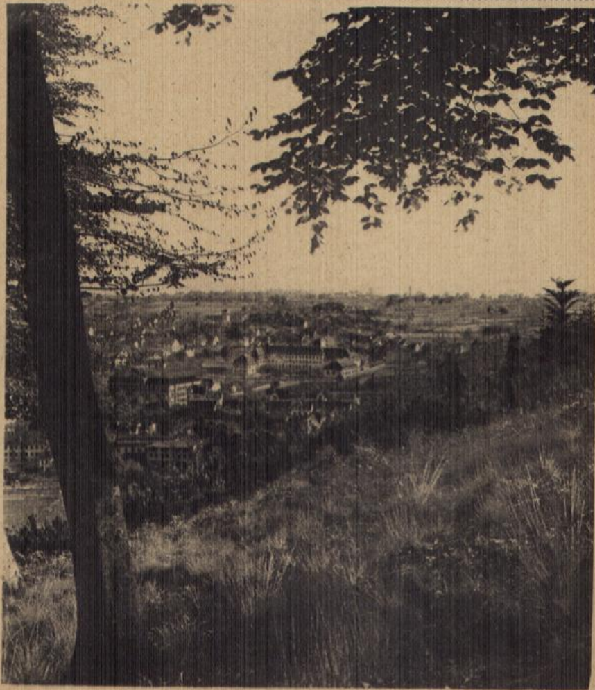
Lahr in Baden.