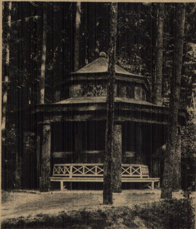
Freiburg i. Br.: Schuthütte an der Schloßbergstraße beim Hirzberg. (Erbauer Architekt Rudolf Schmid.)