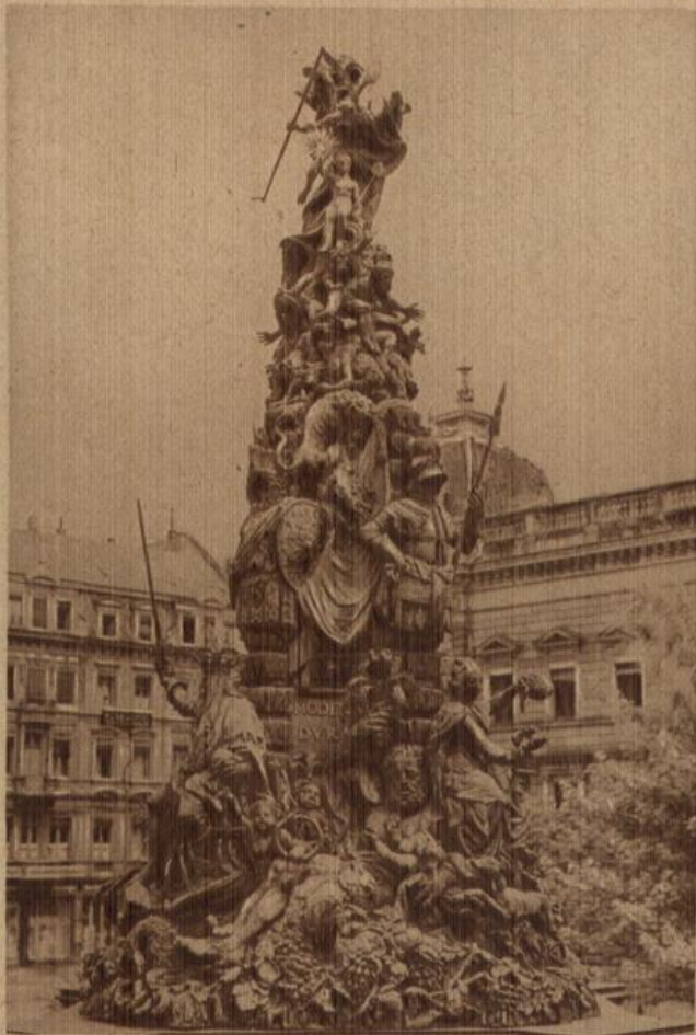
Mannheim: Brunnendenkmal auf dem Paradeplatz, große Bronze-Gruppe von Gabr. Gruppello.