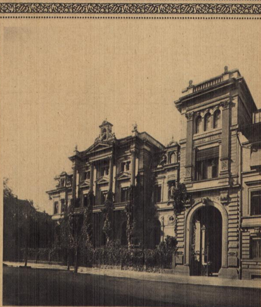
Karlsruhe: Das Handelskammergebäude, ehem. Palais des Prinzen Max.