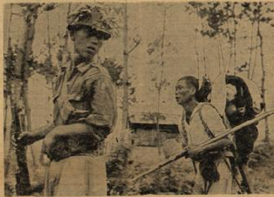
Nach schrecklicher Flucht endlich die südkoreanischen Linien erreicht Dieser südkoreanische Bauer flüchtete mit seiner wenigen Habe auf dem Rücken tagelang vor den anrückenden nordkoreanischen Kommunisten. Sein Gesicht drückt deutlich seine Erlebnisse aus