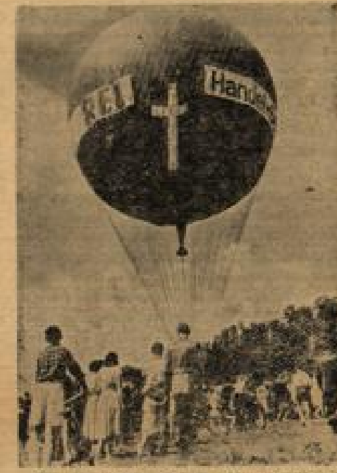
Schweizer-Hilfe für den Saar-Flugsport Dieser Ballon wurde den Saarland-Fliegern von Schweizer Sportlern zur Verfügung gestellt