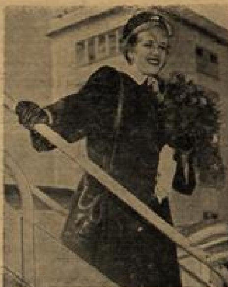
Hildegard Knief wieder in Deutschland Sie trat aus den USA ein und wird in dem Film „Die Sünderin“ eine Rolle übernehmen