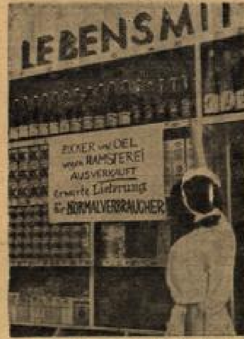
Eine Mitteilung gegen die Hamsterei Von obigem Anschlag verspricht sich ein Lebensmittelhändler viel für „Normalverbraucher“