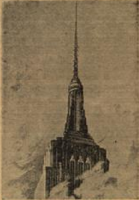
Das höchste Gebäude wird noch höher Das Empire State Building in New York erhält eine Fernsehstation und ist dann 447 Meter hoch