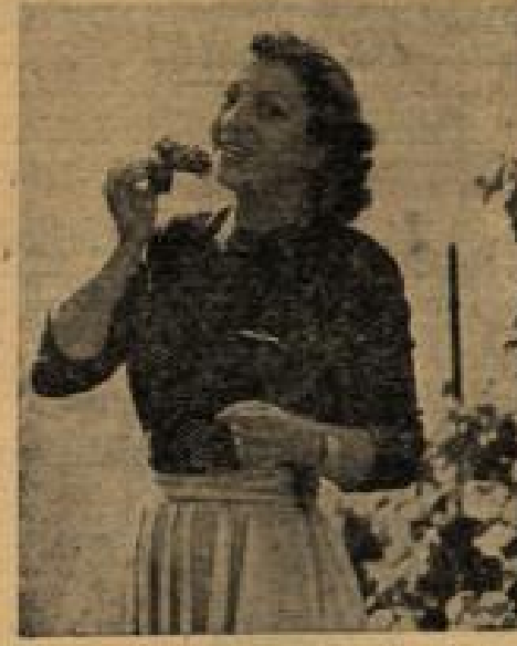
Frühreife Reben in Südwestdeutschland Weinbergreben an Bauernhäusern sind in diesem Jahr teilweise so bald reif wie