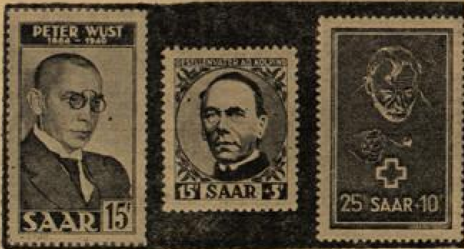
Neue Saarland-Sondermarken in französischer Währung Links: Gedenkausgabe zum zehnjährigen Todestag des Philosophen Wust. Mitte: Kolping-Sondermarke. Rechts: Zuschlag-Marke für karitative Zwecke