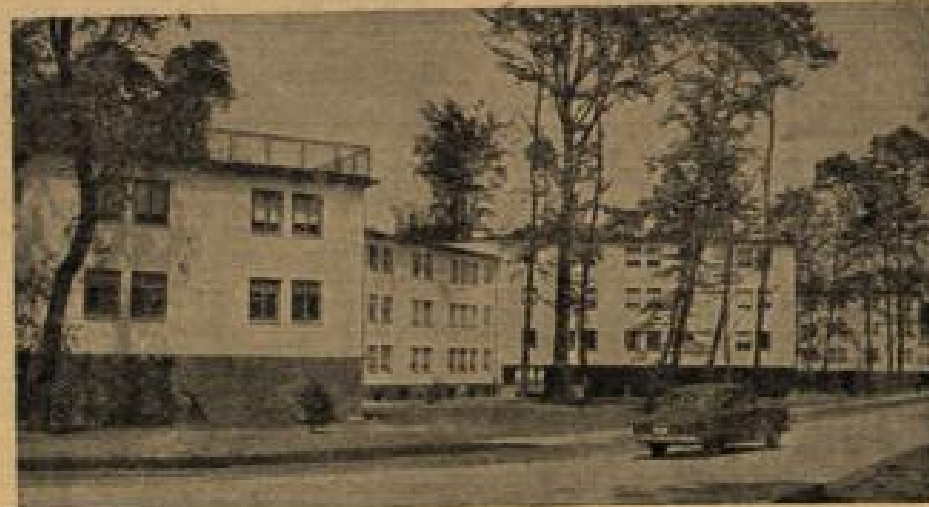
Eine Großsiedlung für amerikanisches Fluggesellschaftspersonal in Frankfurt Am Rhein-Main-Flughafen wurde mit US-Geld eine Siedlung mit 448 Wohnungen für amerikanisches Fluggesellschaftspersonal gebaut. Die Hälfte davon konnte bereits bezogen werden