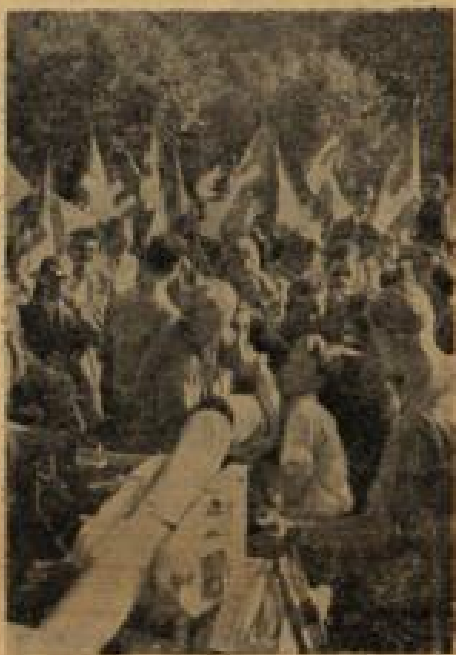
Für sie gab es keine Grenzschranken Studenten aus acht Ländern besetzten dieser Tage die deutsch-französischen Grenzschranken