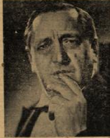
Hans Moser wurde 70 Jahre alt Mit unwiderstehlicher Komik eroberte sich Moser die Herzen des Publikums