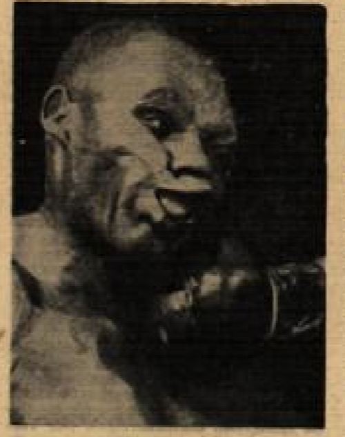
Diese dramatische Boxaufnahme hielt den Augenblick fest, in dem Rocky Marciano den bisherigen Weltmeister im Schwergewicht, Walcott, durch einen 'Sonntagstreff' ans Kinn auf die Bretter schickte...