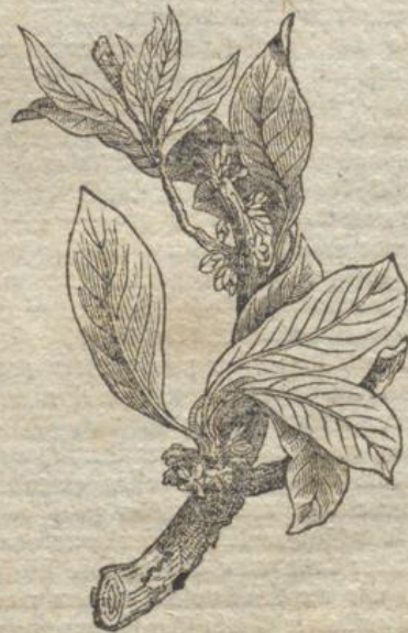
Ein Zweig des Gutta Percha baumes.

Als das beste Auflösungsmittel des Kaoutschuk schlägt Wischaw den Kaoutschuktheer, das Kaoutschicin, und für die Gutta Percha, den Gutta Perchatheer, das Gutta Perchin vor, und behauptet, daß die beste Masse, um Gegenstände aus Gutta Percha zu formen, eine plastische Masse aus Gutta Percha, Gutta Perchin und Kampenschwarz sei.