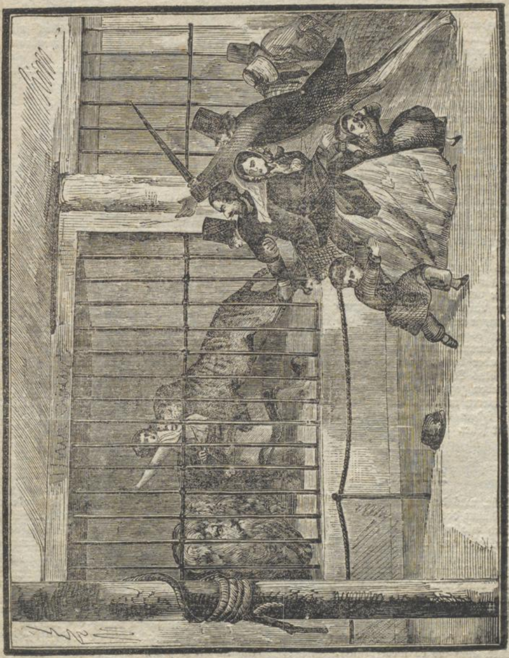
Tod der Löwenkönigin.

Me- Chat- Tage unges , ge- nd sie deren te. einem en der nur Besell- nach ng, in ebten, stliche inuten cke bes r, der eitliche Der n Bo- aus, packen orang, n den