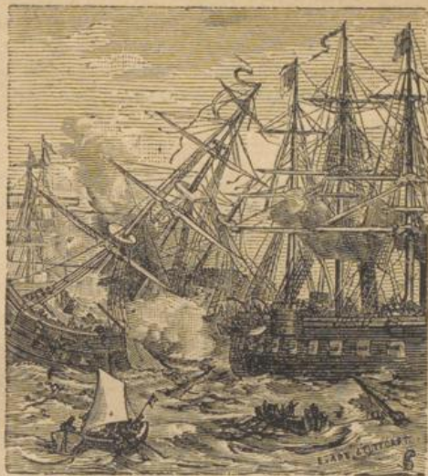
Untergang des Panzerschiffes „Großer Kurfürst.“

Zwecke des Museums nothdürftig zwar, aber den ersten Anforderungen entsprechend in Stand gesetzt, Freunde