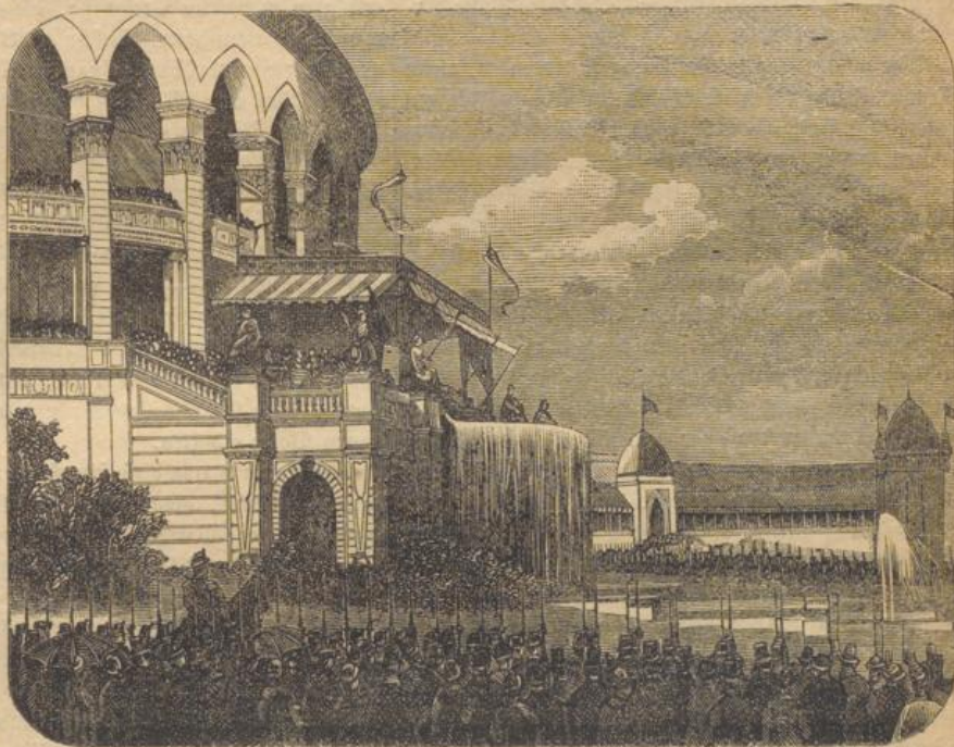
Präsident Mac Mahon erklärt die Ausstellung für eröffnet.

Welche Richtung Pecci einschlagen werde, kann es Semand mit Gewißheit sagen? Alle Anzeichen sprechen dafür, daß er die Rechte der Kirche streng wahren, aber dennoch es sich zur Hauptaufgabe machen wird, sie wieder mit den weltlichen Mächten zu versöhnen. Namentlich kann man eine Wendung zum Bessern bezüglich der Verhältnisse mit Deutschland, die weder dem einen noch dem andern der Streitenden, am wenigsten aber dem Volk zu Gute kamen, fast mit