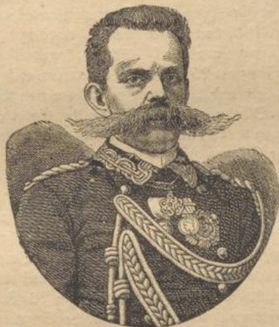
König Humbert von Italien.

Die Befreiung des Landesgebietes, die er mit bewunderter Geschicklichkeit ausführte und welche die