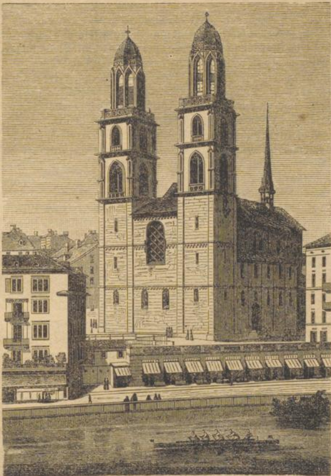
Das Großmünſter in Zürich.

auf. Hernach ließ er alſobald auf einer Anhöhe am rechten Ufer der Limmat da, wo einſt die römische Statio Turicensis ſtand und ſich ſchon eine Kirche be-