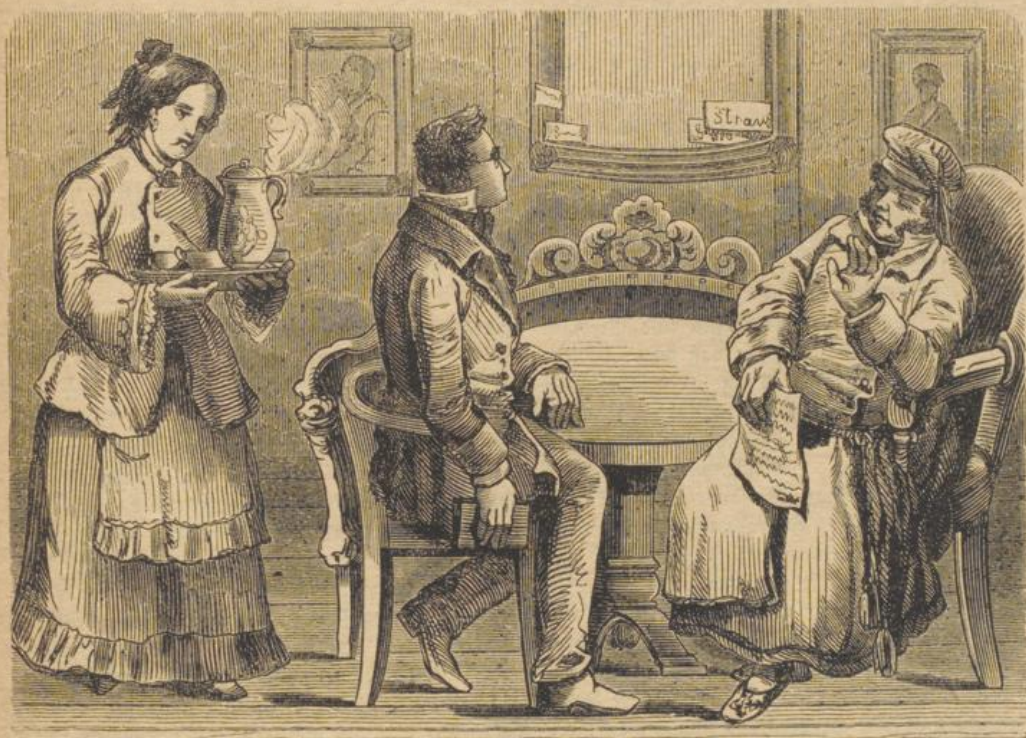
Zum guten Glück kam die Frau des „Wanderer“ herein.

weiß, ob nicht bald ein ernsthafter Streit ausgebrochen wäre! Zum guten Glück kam die Frau des „Wanderer“ herein, das Kaffeebrett in der Hand und ihr bloßes Erscheinen genügte schon, die Streitenden zu beruhigen. Der „Wanderer“ spricht nicht gern von sich selbst und den Seinen, wenn er aber sagt, daß sein Weib Kopf und Herz auf dem rechten Fleck habe, so ist das wahr und was wahr ist, darf auch gesagt werden. Die Freunde stritten sich weiter, wie man dem Unfug der Lebensmittel-Verfälschung steuern könne,