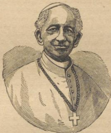
Papst Leo XIII.

kündigt worden; man setzte diese Versammlung aller Bischöfe, unstreitig das größte Ereigniß im Lebensgange Pius IX., auf den 8. Dezember 1869 fest. Heftige Kämpfe begannen im Schooße der Kirche wegen der geforderten Infallibilitätsklärung. Als sich das Konzil wirklich versammelte, nahmen die Verhandlungen einen stürmischen Verlauf, aber trotz des Widerstandes einiger hervorragenden Kirchenfürsten wie Strohmaier, Gesele, Ketteler, Dupanloup siegen zuletzt die Anhänger der Infallibilität. Pius IX. erlebte die Genugthuung, auch die letztgenannten Gegner des neuen Dogmas sich ihm schließlich unterwerfen zu sehen.