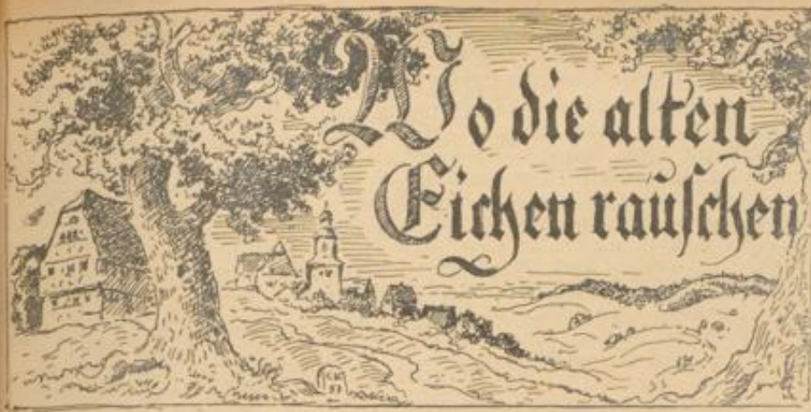
Eine Dorfgeschichte von Ernst Decker — Zeichnungen von Conrad Kayser, Sasbachwalden