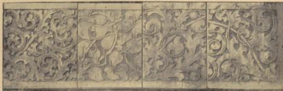
Ornamentleiste vom ehemaligen Sakristeiportal, jetzt Bad. Landesmuseum Karlsruhe