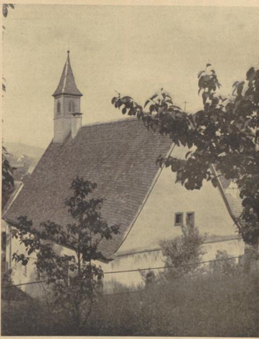
Die Burgkapelle zu Obergrombach, über deren bedeutsame mittelalterliche Wandmalereien in dieser Ausgabe ausführlich berichtet wird

Der Apostel hat das gewußt. Er hat die Sorgen und Nöte seiner Gemeinden mitgetragen (2. Kor. 11, 28). Aber er hat nicht zur