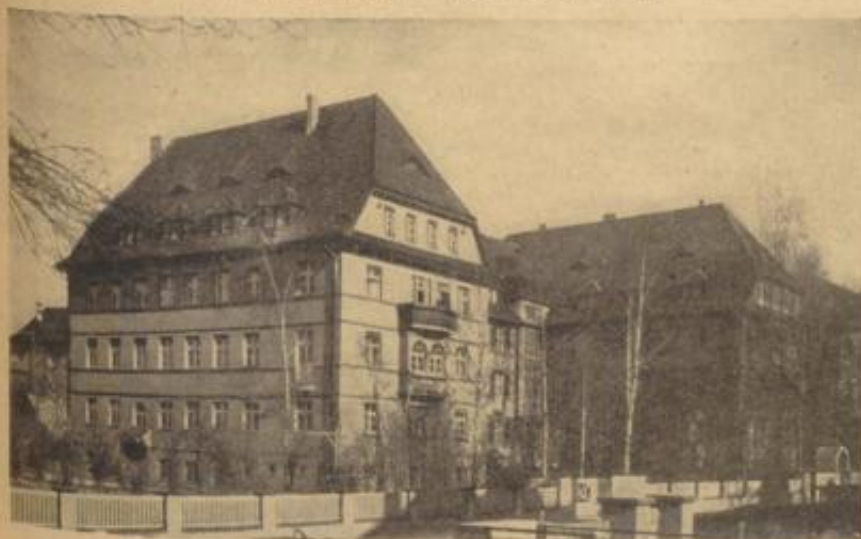
Das Burdhardt-Haus in Berlin-Dahlem