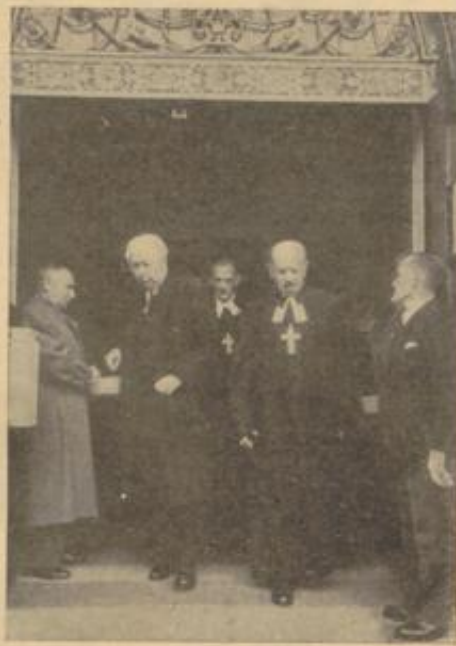
Bundespräsident Dr. Heuß und Bischof D. Dibelius verlassen die Kirche nach dem Eröffnungsgottesdienst