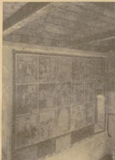
Der gemalte Bildteppich an der nördlichen Seitenwand

heutigen Zweckbestimmung des Gotteshauses als Totenkapelle des Mosbacher Friedhofs voll entsprechen. In seiner Passion hat der Herr alle Qual und Pein erlitten, auf daß wir leben. Auferstehung und Himmelfahrt sind der Triumph über den Tod. — Die Bekenner des Glaubens gaben ihr irdisches Leben freudig hin, in dem Bewußtsein der göttlichen Gnade, im Calendarium der alten Kirche galt daher auch ihr Todestag als ihr eigentlicher