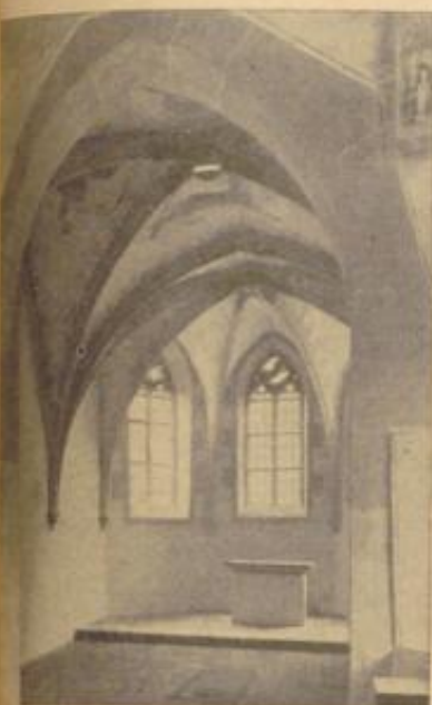
Chorgewölbe mit Evangelistenymbolen

Die kleine Friedhofskapelle zu Mosbach ist in lands- und kulturgeschichtlicher Hinsicht von besonderer Bedeutung. Sie gehörte ursprünglich zu einer sogenannten Gutleuthausanlage, die im Mittelalter zur Aufnahme von Ausgehenden diente. Diese Anlagen, die in der Regel aus einem Stiechenhaus, einer kleinen