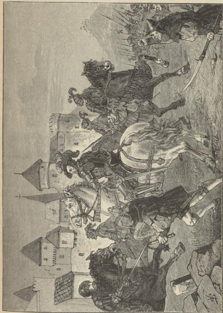
Herzog Ulrich vor Schornbach.

Die Bauern standen ohne Bewegung, ohne Laut. Erst im Fortgang des Verlesens erhob sich ein Gemurmeln, das immer weiter fortwogte. Es ließen sich scharfe Reden hören wider die Rätthe und Höflinge, man ver-