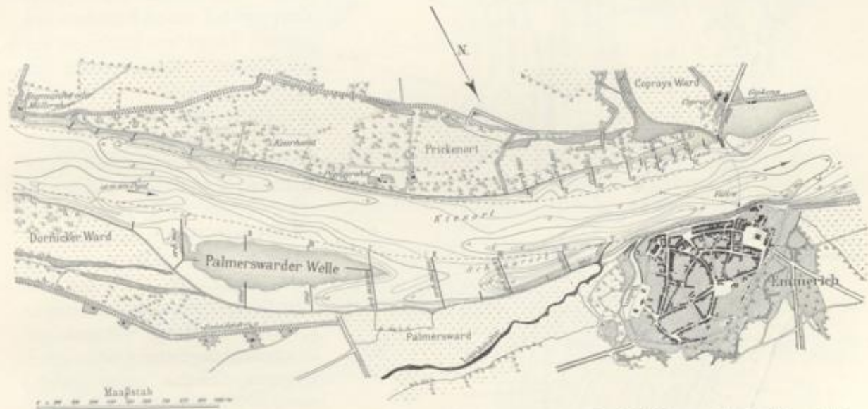
Abb. 118. Stand der Regulierungsarbeiten an der Palmerswarder Welle oberhalb Emmerich im Jahre 1874, mit Tiefenlinien von 1860.