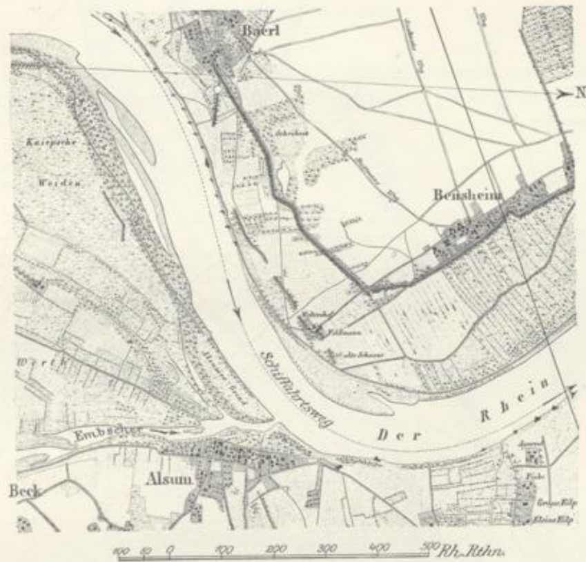
Abb. 91. Der Rheinstrom bei Alsum im Jahre 1836.