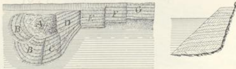
Abb. 58. Construction der Bleeswerke am Rhein von 1744 bis 1794 (nach Eversmann).

A Erster Ausschuss; B Aufgezogene Ausschusslage; C Erste Spreitlage des bekiesten Ausschusses; D Zweite Spreitlage des Ausschusses; E Erste Decklage; F Zweite Decklage; G Dritte Decklage.