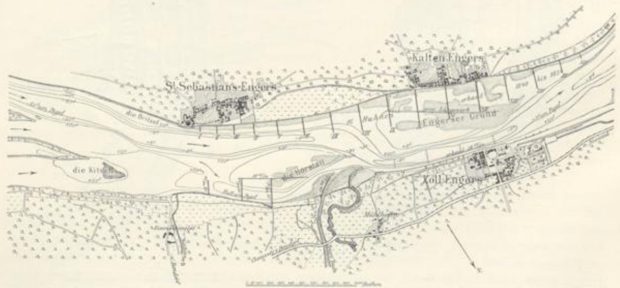
Abb. 28. Die Stromstrecke bei Engers im Jahre 1855.