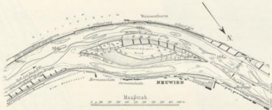
Abb. 27. Das Weisenthurmer Werth im Jahre 1900, mit Tiefenlinien von 1895.