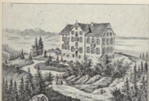
Bregenz. Hotel und Pension Pfänder.

2.— b. 6.— 1.— b. 12.— unbegriffen unbegriffen 1.— 1.20 v. 2.50 an à la carte v. 6.— an 7 Tagen ) gste Preise.