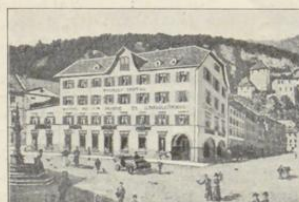
Feldkirch. Hotel Post und Englischer Hof.

Geöffnet: das ganze Jahr. Zimmer mit 1 Bett 1.80 b. 5.— " " 2 " " 3.60 b. 10.— Heizung " 2 " " — 50 Frühstück kompl. 1.20 Table d'hôte ohne Wein . . . . 2.40 b. 4.— Pension mit Zim. 5.— b. 8.— (bei mindestens 8 Tagen Aufenthalt). Dienerschaft: Franken 5.—