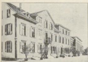
Arbon. Hotel und Pension Baer.

Geöffnet: das ganze Jahr. Zimmer mit 1 Bett 1.25 " " 2 " 2.50 Bedienung, Licht inbegriffen Heizung . . . 1.25 Frühstück kompl. 1.25 Speisen . . . . à la carte