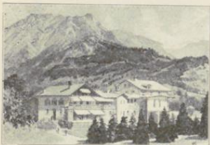
Oberstdorf. Hotel und Pension Rubihaus.