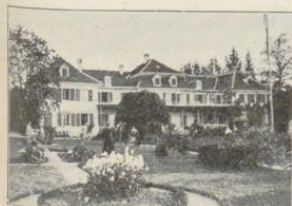
Ermatingen. Hotel u. Pension Schloss Wolfberg.

Geöffnet: das ganze Jahr. Zimmer mit 1 Bett von 3.— an " " 2 " von 6.— an Bedienung, Licht inbegriffen Privatsalon . . v. 10.— an Frühstück kompl. 1.50 Lunch ohne Wein 3.50 Diner ohne Wein 4.50 Pension mit Zim. von 9.— an (bei mind. 5 Tagen Aufenth.). Kinder dem Alter entspr. Ermässigung. Dienschaft: Franken 5.— per Tag, ohne Zimmer.