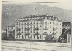
Bregenz. Hotel de l'Europe.

Gegenüber dem Bahnhof und in nächster Nähe des Landungsplatzes. 90 Betten. Bäder im Hause. Lesezimmer. Bibliothek. Speisesaal. Ger. Restaur. Lokaltäten. Grossschattiger Restaurationsgarten. Telephon. Elektr. Beleucht. Portier am Bahnh. u. d. Dampfschiffen.