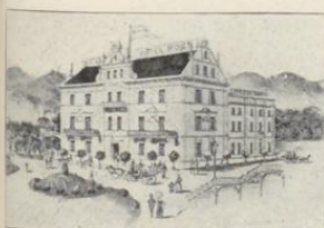
Bregenz. Hotel Post.

2.— b. 4.— 4.— b. 8.— unbegriffen 1.60 b. 1.— 1.20 3.— immer: rung. nen 4.— 1 Wein.