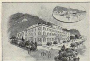
Bregenz. Hotel Montfort.

Gegenüber dem Hauptbahnhof und Seeanlag. Prachtvolle Aussicht auf See und Gebirge. 60 Betten. Lese-, Rauch- u. Damensalon. Elektrisch. Licht in allen Räumen. Zentralheiz. Bäder. Telephon. Garten. Fisch- und Jagdgelegenheit. Omnibus am Schiff.