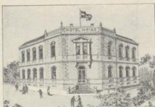
Dornbirn. Hotel Weiss.