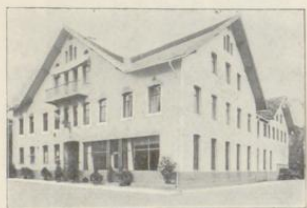
Oberstdorf. Hotel zum Löwen.

Mit Dependance. Im Centrum des Ortes gelegen. 70 Betten. Lesezimm. Rauchzimmer. Grosses Restaurant à la carte. Gast- garten. 26 Balkon- zimmer. Elektrisch. Licht. Telephon. Zwei Badezimmer. Portier am Bahn.