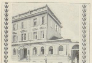
Bregenz. Gasthof Austria.

In nächster Nähe von Bahnhof und Hafen. Gegenüber dem neuen Landes- museum. Wiener- Café und Restau- rant. Billardsaal. Original Pilsner v. Fass. Schattiger Garten. Elektrische Beleuchtung. Engl. Closet. — Bäder.