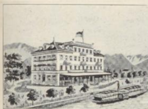
Bregenz. Hotel Oesterreichischer Hof.

1.50 b. 3.— 3.— b. 6.— unbegriffen 1.— immer: kommen.