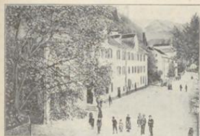
Feldkirch. Gasthof zum weissen Rüsse

In freier Lage. Vis-à-vis d. Stadt- park und in näch- ster Nähe vom Pen- sionate.