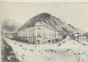
Chur. Hotel Steinbock.

Geöffnet: das ganze Jahr. Zimmer mit 1 Bett 2.— b. 3.— " " 2 " 4.— b. 6.— Heizung . . . 1.— Frühstück kompl. 1.— Table d'hôte mit Wein . . . 3.— Table d'hôte ohne Wein . . . 2.50 Pension mit Zim. 6.— b. 8.— (bei mindestens 5 Tagen Aufenthalt). Dienschaft: Ermässigte Preise.