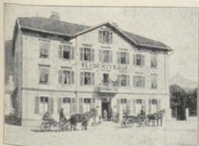
Bludenz. Hotel Bludener-Hof.

2.50 b. 5.— 1.— b. 10.— unbegriffen 1.20 4.— 2.50 on 8.— an Aufenth.). t: inbegr. Jahren ng.