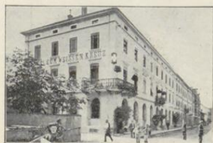
Bregenz. Hotel z. weissen Kreuz.

Altrenommiertes, komfortables Haus, ruhig und vornehm gelegen, in Mitte der Stadt und drei Minuten v. Hauptbahnhof. Telephon. Portier am Bahnh. und Schiff.