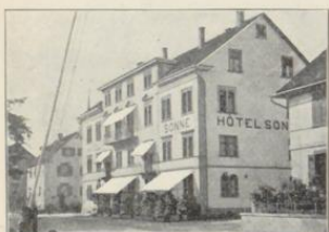
Friedrichshafen. Hotel Sonne.

In unmittelbarer Nähe des Hafens u. des Bahnhofes. Spezial-Haus für Geschäftsreisende. Das ganze Haus im Winter erwärmt. Portier am Hafen und Bahnhof. Besitzer: Hermann Hauber .