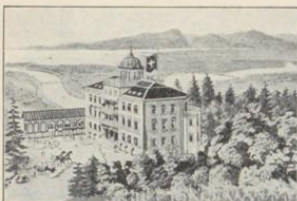
Walzenhausen. Hotel-Pension Rheinburg.

Schöne Lage, mit prachtv. Panorama über Bodensee, das Rheintal und die Alpen. Drahtseilbahn ab Station Rheineck. 60 Bett. Lese- und Billardz. Cafe-Restaurant. Terrasse, Veranda. Bäder mit Douche. Telephon. Garten u. Wald b. Hotel. Portier am Bahn. Besitzer: Gebrüder Stadler.