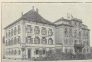
Friedrichshafen. Hotel zum Lamm.

(Preise in Mark) Geöffnet: Mai b. Uebr. das ganze Jahr. Sept. Zeit: Zimmer mit 1 Bett 1 60 —4 10 140, 2 50 „ „ 2 „ 3 25 —8 3—7 Bedienung, Licht inbegriffen Frühstück kompl. 1.— 1.— Table d'hôte ohne Wein . . . 2, 50 2, 50 Pension mit Zim. 5—15 5—12 (bei mindestens 5 Tagen Aufenthalt). Dienerschaft: Mark 4.— alles inbegriffen.