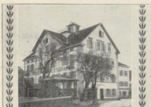
Langenargen. Hotel Schiff.

Prachtvolle Lage dir. am See. Grosse Terrasse u. Garten mit herrlich. Blick auf See u. Gebirge. Gelegenheit zum Fischen u. Gondelfahrten. — Schöne Spaziergänge. Portier an sämtlichen Schiffen. Telephon. 20 Betten. Besitzer: Oskar Schneider .