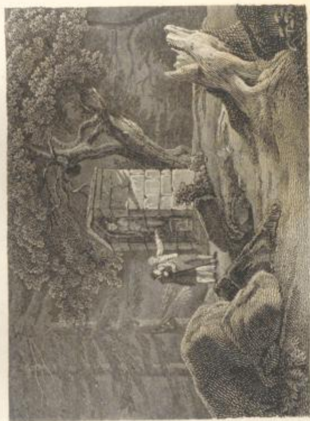
DER ALTAR DES MERCURIUS.