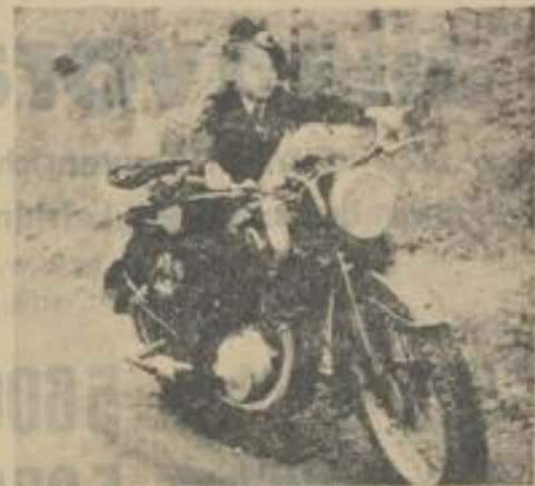
Liebe Freunde in meinem Alter!

Seit Jahren fährt mein Vater diese alte DKW 350 ccm, Baujahr 39. Er läßt sich nicht davon abbringen, obwohl ich ihm die Vorzüge der Teleskopfederung und der Fußschaltung bei den neuen Rädern geschildert habe. Er hat eben wenig technisches Verständnis. Er gibt selber zu, daß ich seine Maschine viel schneidiger fahre als er. (Wie ihr hier seht!) Aber daß unsereiner keinen Führerschein bekommt, nur weil man erst 9 Jahre alt ist, das ist doch eine Schande!