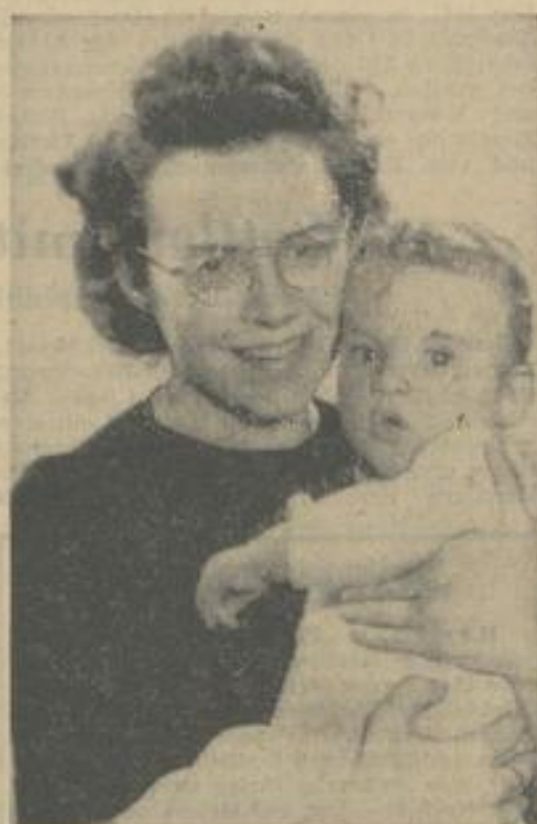
Paß auf, mein Herzblättchen, und halt schön still, man will uns für unser „Herzblatt“ fotografieren.