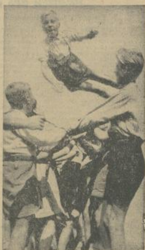
Das macht Spaß!

Ihr schließt den Gürtel mit Häkchen und Ösen oder näht nur Ösen an und zieht eine farbige Schnur hindurch, mit der Ihr den Gürtel schließt. Natürlich könnt Ihr das ganze Material, das Ihr braucht, auch kaufen.