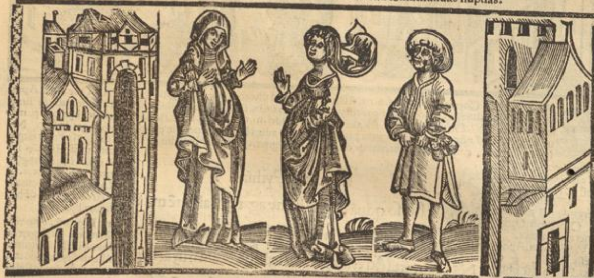
Pythias. Chremes. Sophrona.

Videat. Tha. quāobrē tandē. an q̄a pudet. Chę. id ip̄m py. Id ipsum. virgo vero vitiata. Th. Ip̄ seq̄r. tu istic mane vt chremē itroducas pythia.