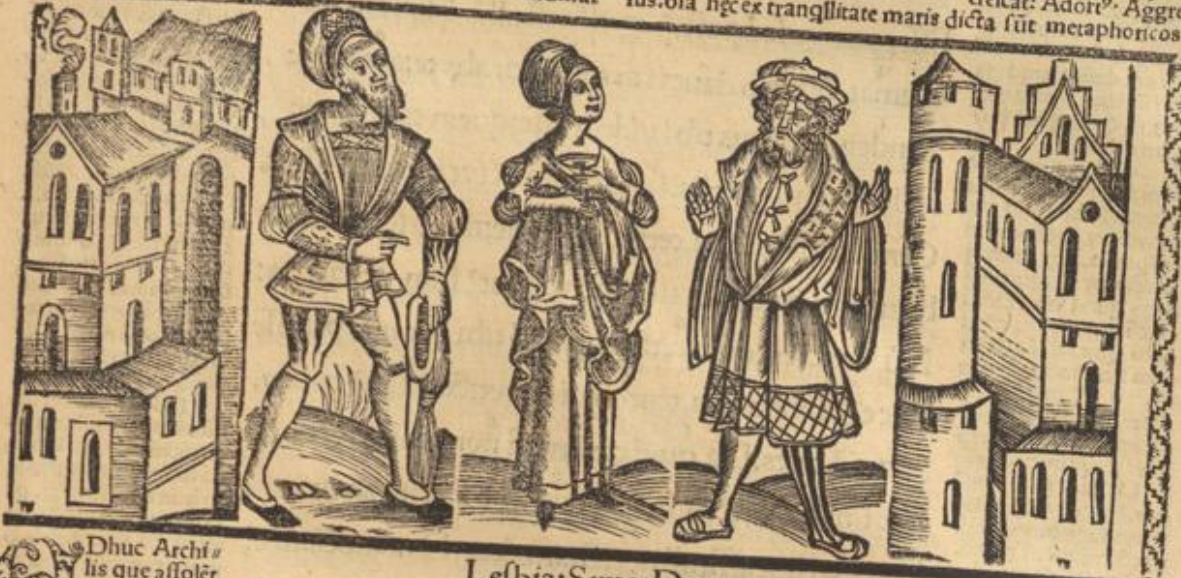
Lesbia: Simo: Dauus.

fus. oia hęc ex tranquillitate maris dicta sūt metaphoricof