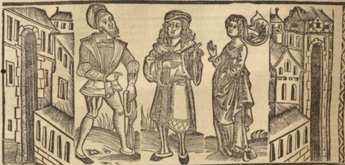
Chremes: Misis: Dauus

Recte vt subseruias di- xit: nō em̄ tantum lo- quit Mis̄is quantum Dauus. f Oratio ni mee vt cūq; opus sit verbis tuis. Verbis scq; orōi mee. Plura em̄ loquitur Dauus: inde orationi dixit: illa sub sequitur ideo verbis. g Vide. Cauta est: intellige specta. h Aut tu plus vi- des: si sapias intelligis. i Ne quid vestru res moret cōmodū reomi- ter retardē: reinea: rea mora p̄sce minutissi- mo. qui nauim retine- nam gr̄ce ἐξυγῆς vo- catur