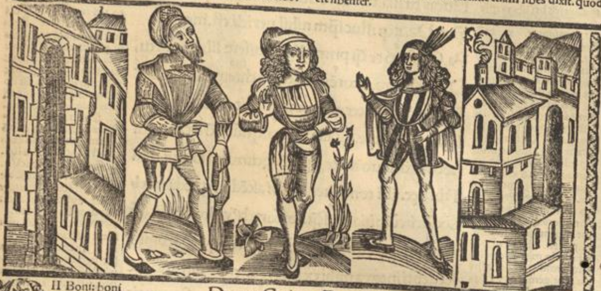
Dauus; Carinus; Pamphilus.

r Fugin hinc. Cōminā t Ego vero ac lubens. Nemo liben ter fugit: nisi coactus necessitate: hic etiam libēs dixit. quod est libenter.