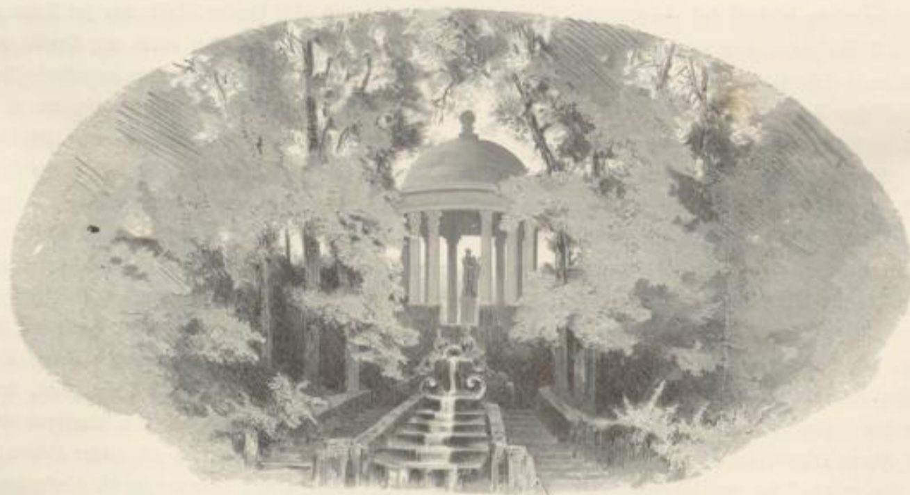
Apollo-tempel im Schloßgarten Berlin.

Uner schöplich an solchen Bildern ist unser Weg durch Park und Garten. Tempel und „Ruinen“ begegnen uns, künstliche Brücken und Seen — Alles, Alles ist da und nur Eines fehlt: die Menschen, die dereinst an solchem Prunk ihre Freude