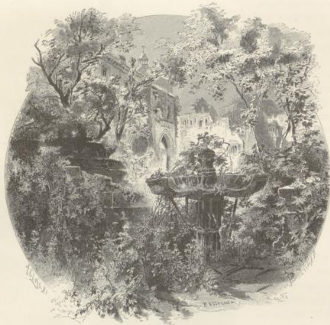
Salsburger Schloß. Ansicht vom Schloßhof.

Und fürwahr auch hier haben kaiserliche Hände gewaltet — und der Adler des Reichs stand über dem Portale, aber freilich keine Kaiser von jenem vollen, weichlich-wilden Klang, wie Nero und Galba, wie Heliogabalus und Caracalla, sondern eisenharte Gestalten, mit knorrig-herben Namen. Kaiser Ruprecht war der Erbauer des Flügels, der uns zuerst entgegentreit, wenn wir über Brücken und Thor hinweg den Schloßhof betreten.