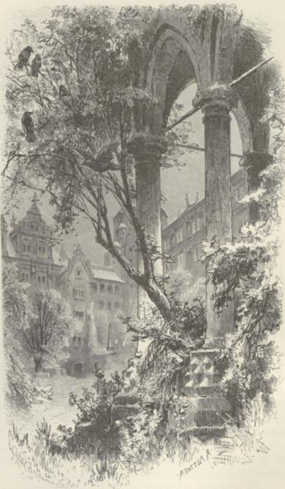
Heidelberger Schloß. Blick in den Schloßhof.

Steigen wir nun mit Ruhe an's Schloß empor, denn das ist doch immer der erste Gang für den Fremdling. Unzähligemal haben Wort und Stift sich versucht, um diese Perle deutscher Schönheit nachzubilden, und wieviel Gedanken voll Poesie wurden vor diesem Anblick wach, die nie einen Ausdruck fanden, die durch die Seele gingen, wie ein Stern, der vom Himmel in's Tiefe sinkt! So mögen Tausende hier gestanden sein, und immer noch, immer neu regt dieser Zauber an. Es ist ein wunderbares Geschick: die eigene Kraft dieser Mauern ist längst gebrochen, aber die Kraft, die sie auf die Gemüther üben, wuchs immer mehr, die konnte kein Zerstörer verwüsten. — Wie bekannt, ist das Schloß zu Heidelberg kein Werk, das aus einer Hand und aus einer Zeit hervorging, sondern es ist ein ganzes Geviert von Palästen, in das die Gedanken dreier Jahrhunderte und das Machtgefühl langer Generationen eingeschlossen sind; es war für sich eine kleine Stadt von Schlössern und Thürmen, von Sälen und Gärten; es war ein Gegenbild der alten römischen Kaiserpaläste, nur in deutschem Geiste, in deutscher Landschaft.