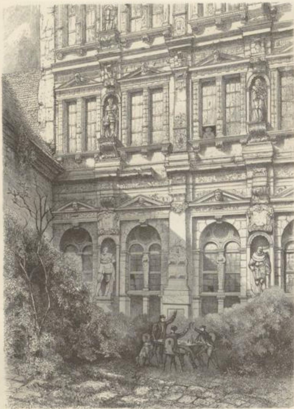
Von Heidelberger Schloß. (Felsbildstein.)

selber fragen will, was uns denn eigentlich an dieselbe fesselt. Heidelberg selber hat nichts, was man im täglichen Sinne „Lebenswürdigkeiten“ nennt, die Zahl seiner Bewohner ist mäßig, und das Leben einfach ohne zerstreute Vergnügung. Aber mehr als tausend Paläste mit all' ihren Schätzen zieht die verwaiste Schloß mit seinen Trümmern uns an, man kommt nicht fort aus diesem Labyrinth, wo alle Pfade mit wilden Weisagen und alle Mauern mit großen Erinnerungen erfüllt sind. Und die duftenden Wälder ringsum mit ihren verworrenen Pfaden, auf welche die Sonne grünes Gefunkel streut, wer kann sich ihrem Duft, ihrer Frische, dem lodenden Geheimniß entziehen, das zwischen von allen Bäumen herunterklingt? Da liegt in kühlem Schatten ein kleiner Teich, wo die rauschenden Bäche ruhen, bevor sie thalabwärts strömen; Wolfsbrunnen nennt man die Stätte, denn hier ward die Wahrfagerin Jetta, die auf dem nahen Büchel wohnte, von einem Wolfe zerrissen; dort liegt das Teufelstoch und drüben der Königsstuhl, und wo der Wald sich aufthut, sehen wir hier herab auf die langgestreckten wunderbaren Ruinen!