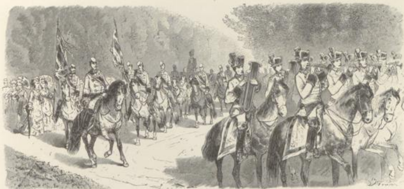
Ansicht eines Söldnercorps.