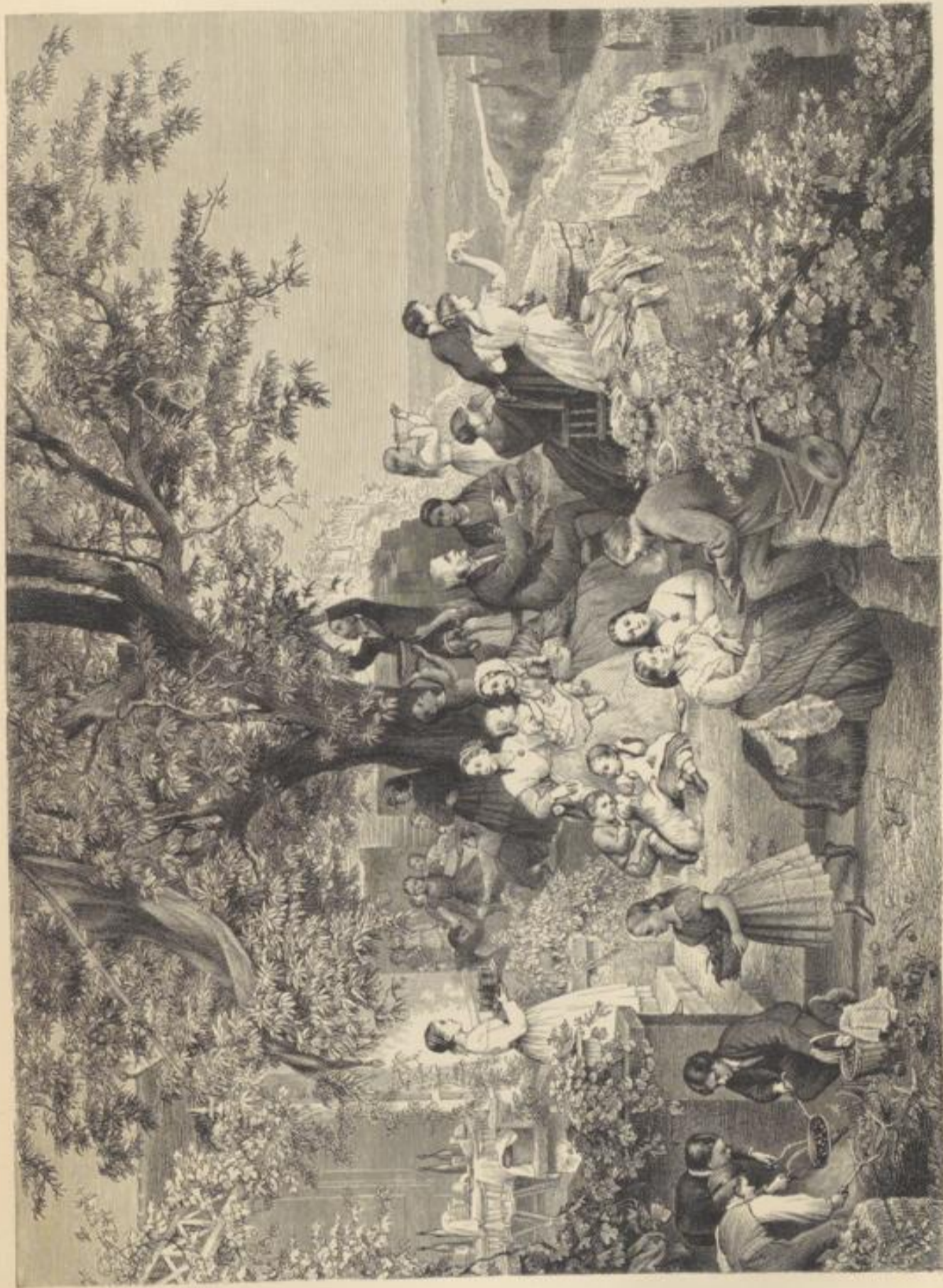
Gerbstoffeier am Neckar. Von Ch. Schütz.