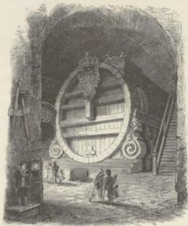
Heidelberger Schloß. Das große Schloß.

Nichtswisserei, und das erregt complicirte Gefühle. Ach, es war mir so complicirt zu Muthe, als ich die ersten Examenbesuchen machte! Hier und dort zog ich die Klingel, hier und dort ging die schöne Tochter des Hauses über den Gang und stillestehend warf sie einen mittheidigen Blick auf das geschmückte Opfertier — sie kannte diese Gestalten! — — Das sind Studententage in Heidelberg.