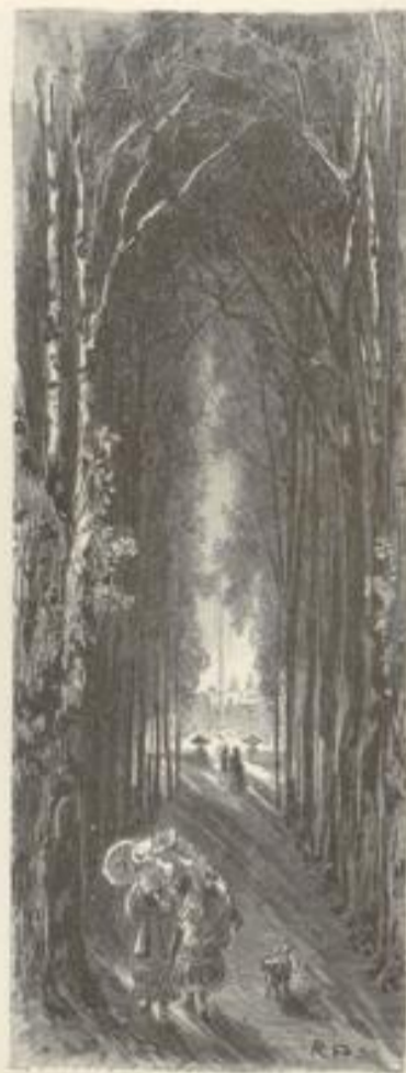
Allee im Schloßgarten Berlin.

Wir treten ein und schreiten langsam weiter auf den beliebten Wegen — da sind in großem Rund gewaltige flache Blumenbeete; Tausende von duftigen Knospen zusammengedrängt auf einer Scholle, und dennoch wirkt das Ganze nur wie ein kleiner bunter Strauß auf einer riesigen Tafel. Ueber die Fluth der Bassins steigen Delphine und Drachen empor, bald aus feuchtem Gestein, bald aus dunkelfarbigem Erz, und auf dem Rücken derselben strecken sich übermüthige Amoretten. Dann verzweigt sich der Pfad nach beiden Seiten in's Grüne, rechts und links thun dichte Laubgänge sich auf; an hatten, die Zeit, die diesen Prunk begreift. All' diese Denkmale von Stein, diese Blumen, dieser Rasen — sie sehen aus, als ständen sie auf einem großen, riesig ausgemessenen Grabe und darunter schlief ein hingegangenes Jahrhundert!