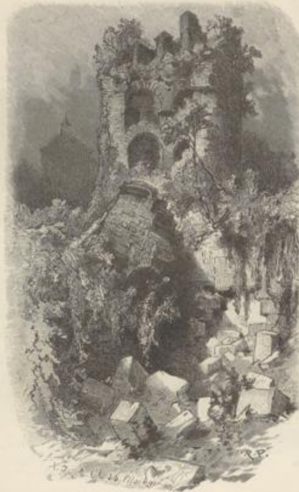
Heidelberger Schloß. Der zerstörte Thurm.

Aber das schlimmste von allem Leid, das über die Stadt erging, kam aus den Händen jenes Wütherichs, der sich den allerschlimmsten König nannte und der den Rhein nicht bloß erobert und verwüstet, sondern der ihn geschändet hat!