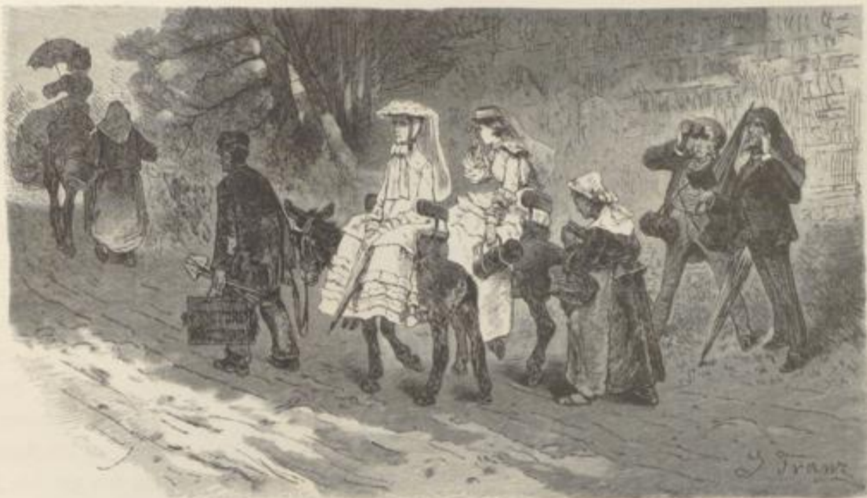
Pilger auf den Schloßberg.