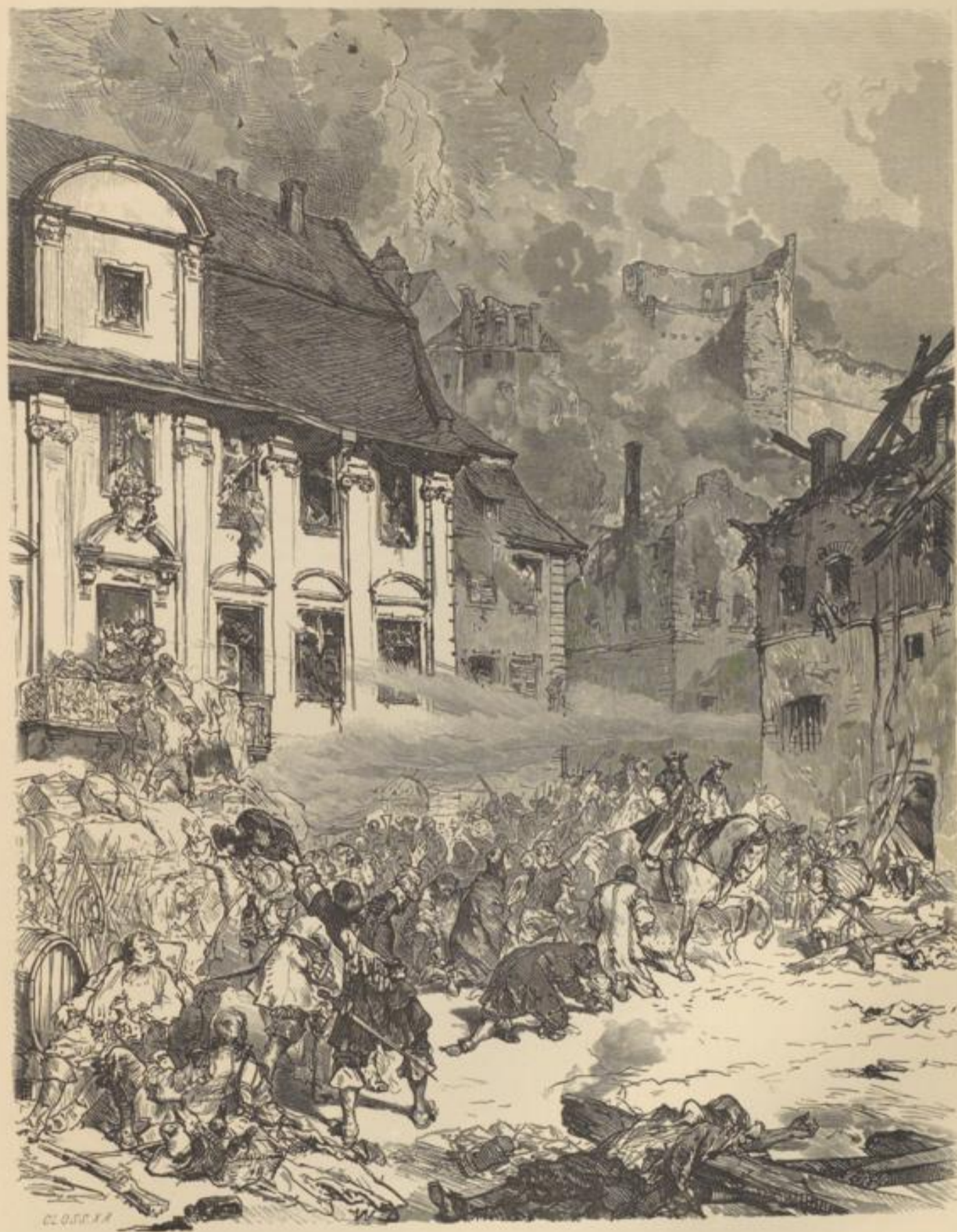
Verstörung von Heidelberg. Von W. Diez.