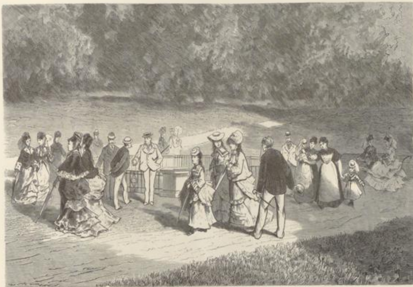
Am der Erlinquelle in Sehm.

welchem aus sich im Umkreis von einhundertfünfzig Stunden ein herrliches Panorama bietet. Sein Metallgehalt hat allerdings in früheren Zeiten, wie die i. g. „Goldgrube“ bei Homburg noch zeigt, die Spekulation zum Bergwerksbetrieb verleitet, doch war derselbe nicht ergiebig genug. Nur Braunkohle und Thon sind häufiger und erst in der Lahn-Gegend danken die Eisen- und Brauneisenlager der dort sehr eifrigen Ausbeutung. Desto reicher ist der Gebirgszug an Mineral-Quellen. Seinen Namen erhielt er von den Römern, die ihn mons taunus nannten; auf die übrigen Ableitungen sich einzulassen dürfte hier überflüssig sein.