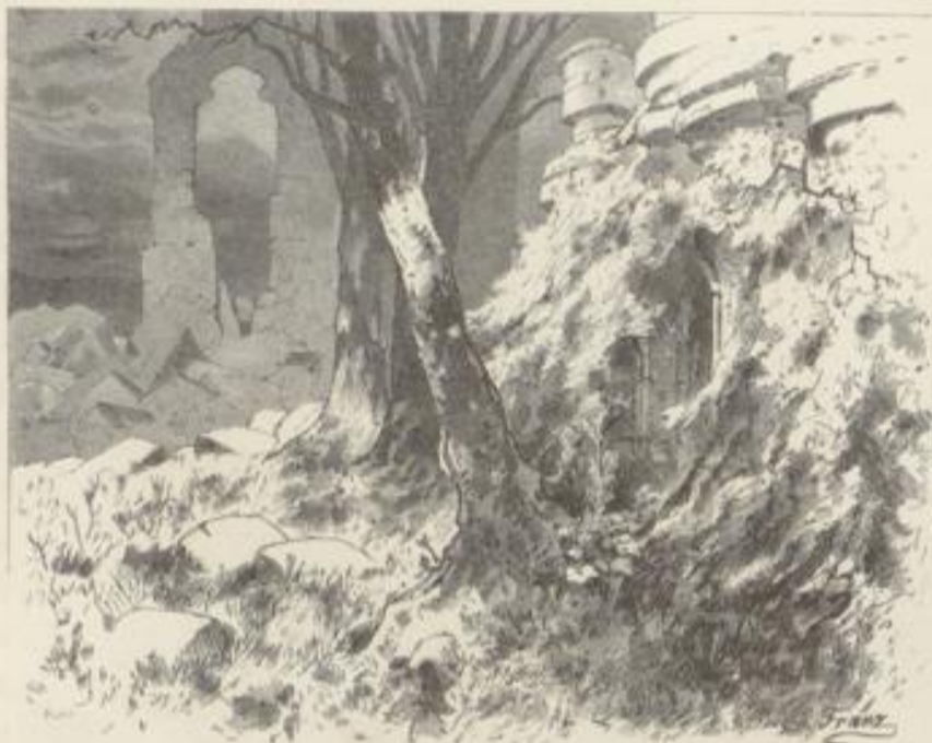
Kulden von Eppstein.

Rur-Mainz überging. Das Volk knüpft an die Eppsteiner manch' blutige Erinnerung. In dem Thorgewölbe der Burg hing einst als Wauwau in schweren Ketten ein kolossales Gerippe, das eines Riesen, so glaubte man damals; im Wiesbadner Museum hängt es jetzt als das eines vorfluthlichen Thieres. Von einem andern Riesen erzählt die Sage angeichts des Staufens, des großen und kleinen Mannstein, zweier Felsen, aus denen die Phantasie, in entsprechender Entfernung betrachtet, zwei Menschengestalten heraus construiren kann. Der eine von ihnen ist ein Ritter von Falkenstein, der mit dem Riesen um seine ihm von diesem geraubte Braut kämpfte.