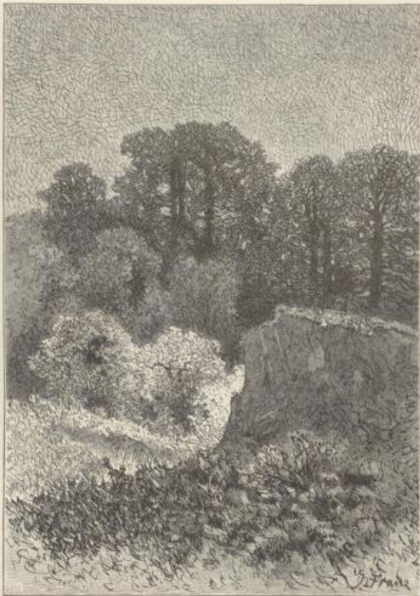
Rehstall bei Cronberg.

einige Grabsteine. Weiter bergan liegt die Burg Falkenstein auf bewaldetem Felsgestein. Irmengard, eine Tochter jenes mit dem Domherrn F. zu Mainz 1683 untergegangenen Geschlechts, wandelt der Volksjage nach noch heute zwischen den düstren Mauern. Sie hat das für die heutige so verstandesnüchterne Zeit undankbare Bedürfnis, zu suchen, wo sie unglücklich Liebende beschützen könne, was auf ihre eignen Lebensschicksale ein melancholisches Licht wirft. Auch Heinrich von Ofterdingen, der Minnesänger, greift hier oben noch nächtlich in seine Harfe, am Ufer des Niederbachs zum Rhein hinab wandelnd, während droben innerhalb des riesigen düstren Felsfelsels, des Altkönig, ein graues Bergmännchen sitzt, das die Schätze bewacht und den immer wachsenden Bart um eine Haspel windet.