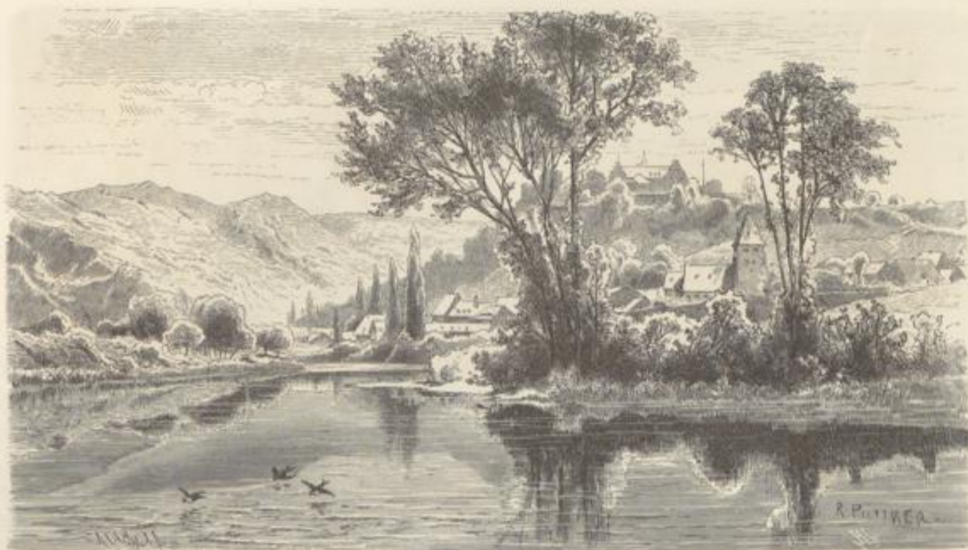
Schloß und Dorf Ebernburg.

Burgwirthshaus neben seinen Bildern und Statuen im Speisesaal noch allerlei Ausgrabungen meist späteren Datums, in seiner Mauer u. A. einen Stein mit der Inschrift: