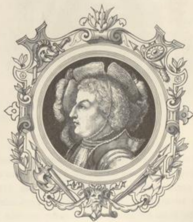
Franz von Sickingen.

Am Fuße der Ebernburg liegt das Dörfchen Ebernburg, welches in einem über dem Thore eingemauerten steinernen Eber eine Erklärung für den Namen von Dorf und Burg zu geben scheint. Der Sage nach wurden einst beide „von einem übermächtigen Heere belagert, und der Hunger hätte sie zur Uebergabe gezwungen, wenn dem Burgherrn nicht zur rechten Zeit eine Kriegslist eingefallen wäre. Ein mächtiger Eber, der Hungernden letzte Hoff-