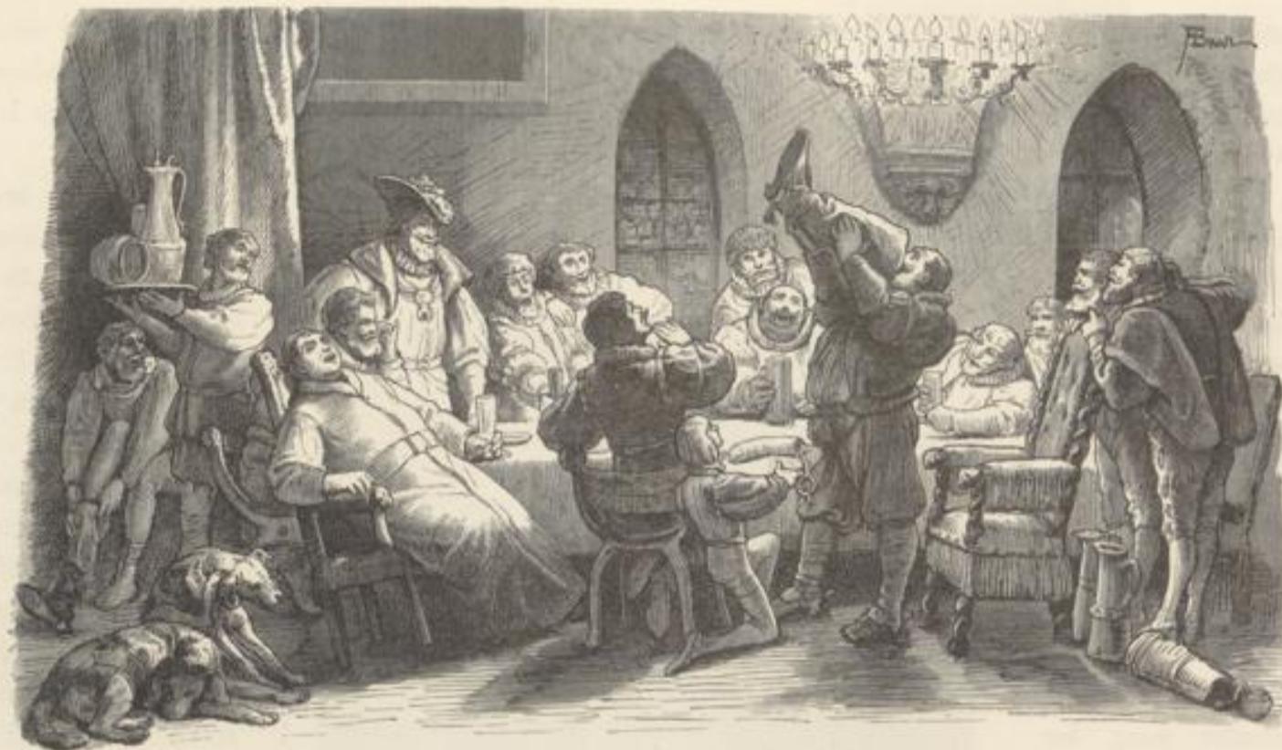
Ges. von Walden.

auf welchem die Rheingrafen nach ihrer Austreibung aus dem Rheingau hausten, eine Ruine, noch majestätisch als Trümmer, auf steil ansteigendem Porphyrfelsen mit bewundernswerther Kühnheit angelegt wie ein steinerner Adlerhorst. Die stolze Feste ward, so heißt es, schon im achten Jahrhundert erbaut, doch spricht die Geschichte erst zu Anfang des zweiten Jahrtausend von den Rheingrafen, und wenige Jahrhunderte später von ihrer Macht, ihrem Besitz. Johann I. von Mainz, verbündet mit den Grafen Thaan und Sponheim eroberten die Burg um 1328 und selbstverständlich fiel später auch sie den französischen Nordbrennern zum Opfer. Der spanische Herzog von Osuna oder seine Gattin erwarb die Burg und den dazu gehörigen Grundbesitz als Eigenthum. An den Rheingrafenstein knüpft sich eine von Pfarrius dichterisch behandelte Sage, nach welcher Ritter Voos von Walden in Folge einer Wette mit dem Rheingrafen einen Kurierstiefel voll Wein auf einen Zug geleert und dadurch das Dorf Hüffelshelm gewonnen habe. Daher die durstige Tradition vom „guten Stiefel“, den Einer vertragen kann.