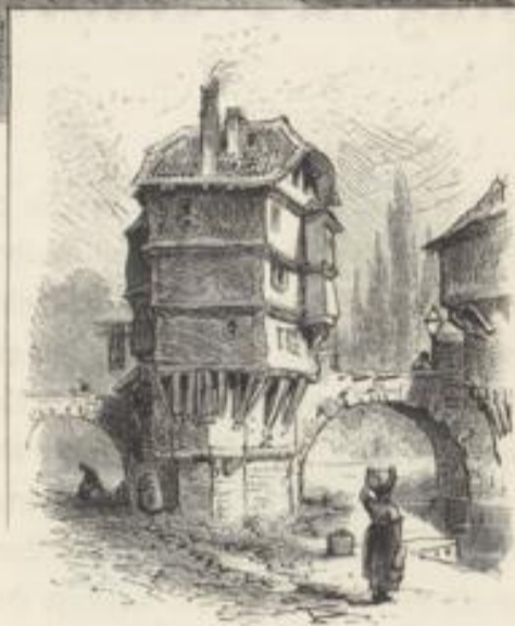
An der alten Hasenbrücke.

Auch hier hat der römische Feldherr in dem alten Cruencacum oder dem fränkischen Crucinaha seine Spuren hinterlassen. Auch dieser Ort besaß einst seine Pfalz, die von den Normannen zerstört worden. Nach mehrfachen Wechsel kam Kreuznach unter den Gaugrafen von Sponheim, dann an Kurpfalz, 1815 endlich an Preußen. Ueber die Rahe ge-