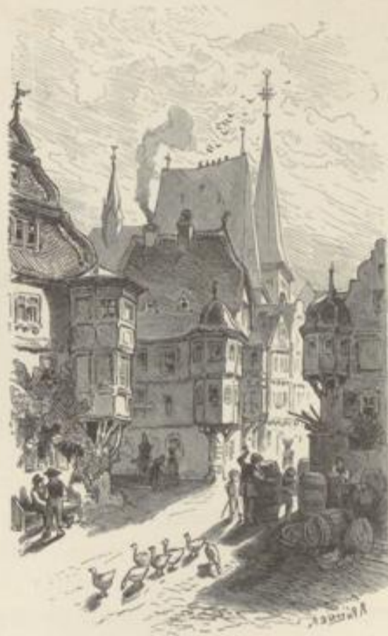
Strasse in Manzingen.

In Oberstein gipfelt sich die Romantik des Nahethals. Endloses wäre noch zu erzählen über alle die Burgen, in welchen die Wild- und Raugrafen, die Schmidtburg, Kirburg, Dhann und die später daraus hervorgegangenen Grumbach, Neufirburg, Salm und Salm-Salm hausten. Immer aufwärts führt die Bahn uns jetzt von Oberstein nach Neunkirchen, von welchem aus der Blick das ganze Saarbrücker Kohlenbecken beherrscht, in diesem den Exerzierplatz Saarbrückens hoch über der Stadt, auf welche am 27. Juli die ersten französischen Granaten fielen, als Frossard uns dahinauf seine ersten eisernen Grüße sandte; ferner die denkwürdigen Spicherer Höhen, welche so todesmuthig die Unjren am 6. August erklommen, und auf deren steilem Abhang heute die Denkmäler für die Helden sich bis auf die Forbacher Chaussee und das Ehrental hinabstrecken; endlich die Stelle, an welcher Napoleon III. selbst am 2. August bei dem Ueberfall Saarbrückens das Kommando führte, an seiner Seite der kugelnammelnde Sohn, dem ein launiger norddeutscher Patriot hier den „Lulu-Stein“ errichtete.