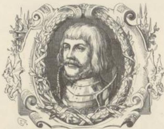
Heinrich von Sully.

Wir ziehen inzwischen nach der Ruine des Schlosses Bodelheim, von dem wenig mehr übrig geblieben und an das die Geschichte wohl mit Unrecht ihrer Brutalität hinterlassen, die ewig von ihnen reden. Die Trümmer des Schlosses umgibt das Dorf Schloß-Bodelheim. In Abtei und Burg Sponheim lebte einst der Abt und Historiker Johann von Tritenheim, J. Tritheimius; das Benediktiner-Kloster entstand, von Eberhard von Sponheim errichtet, um 1100 und enthielt eine berühmte Bibliothek. Sehr zerfallen, ward die Kirche in romanischem Stil wieder restaurirt und in geschmackloester Weise innen decorirt. Dicht dabei liegt die Ruine des Sponheim'schen Schlosses, dem auch die Franzosen den Rest gegeben. — Von Sobernheim ist die schöne alte Kirche erwähnenswerth; ganz in seiner Nähe schlängelt sich die kleine Glan in die