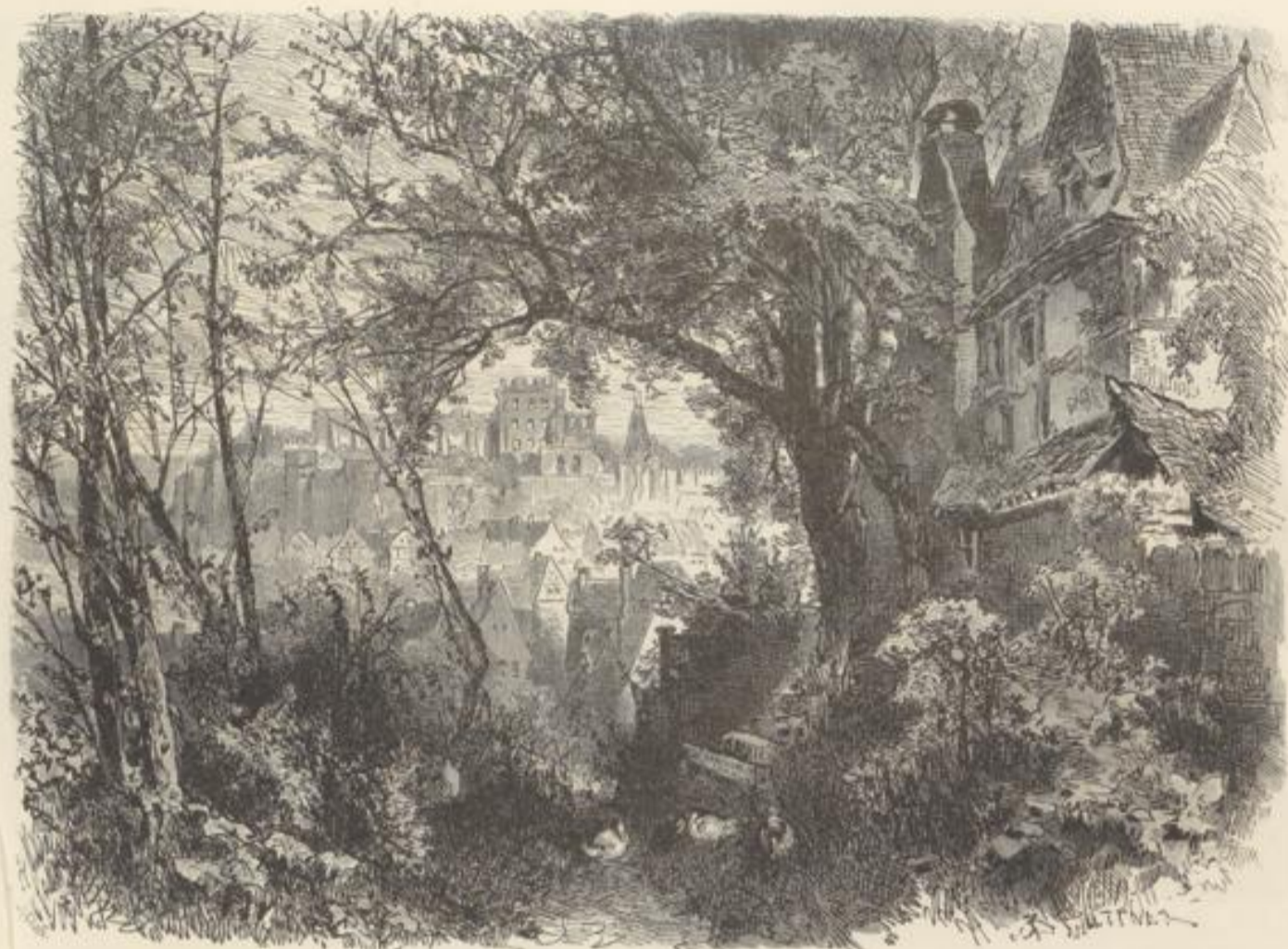
Blick auf Schloß Dhaun.

Basrelief im ehemaligen Rittersaal knüpft sich an eine Sage, nach welcher ein Affe einst ein Kind aus dem Schloß geraubt, das man im Walde wieder fand, wie der Affe es pflegte und ihm eben einen Apfel reichte. „Dem Affen setzten sie in Stein ein Mal, das heut noch währt,“ singt Simrod.