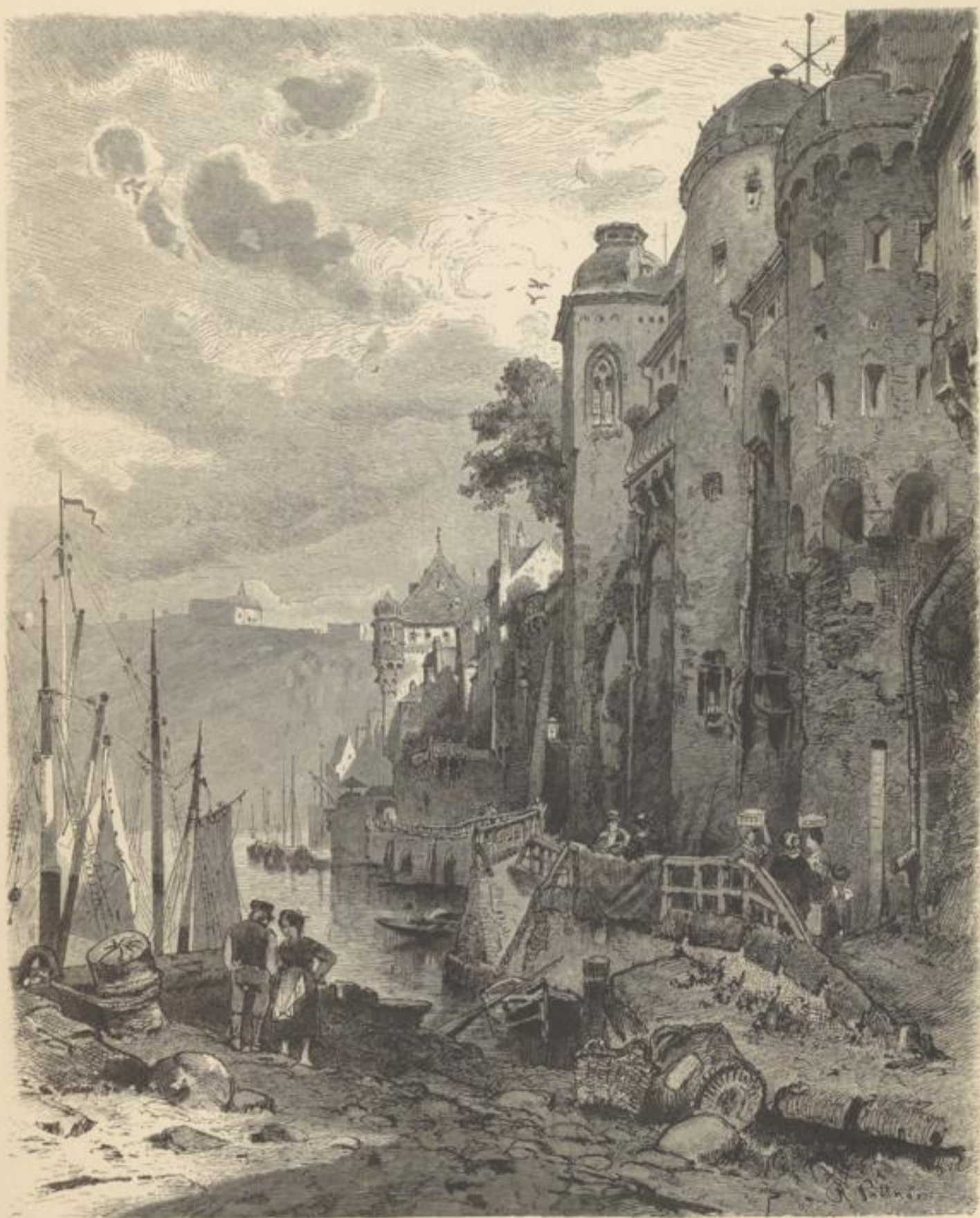
Am Moselufer in Koblenz. Von H. Pittner.