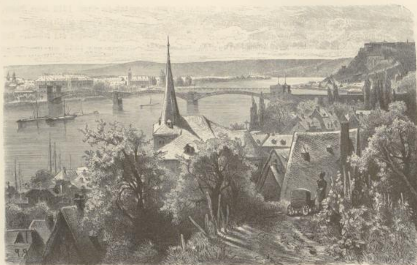
Koblenz von Weffershof aus.