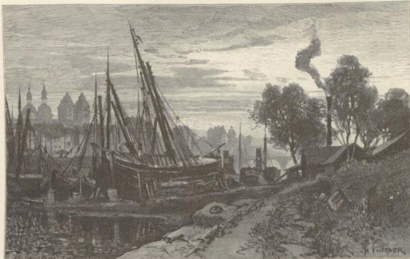
Moselufer bei Koblenz.

Die französischen Revolutionstruppen rächten sich für die von hier aus damals betriebene Conspiration der Emigranten mit den deutschen Fürsten, als sie 1794 die Stadt nahmen, durch eine Brandschatzung von 4 Millionen Francs. Im Jahr 1798 ward Koblenz zur Hauptstadt des Rhein- und Mosel-Departements gemacht; als die Franzosen jedoch anno 1814 hinausgejagt wurden, kam die Stadt (1815) in Preußens Besitz, das im darauffolgenden Jahre an's Werk ging, aus der Stadt eine der stärksten und jetzt mit ihren riesigen Außenwerken uneinnehmbaren Festungen zu machen, und zu mächtigem Erblühen des Ortes beizutragen. Koblenz, Sitz der höchsten Civil- und Militär-Behörden der Rheinprovinz, mit einer Besatzung von 6000 Mann, ist seit Jahren die Lieblings-Residenz der Königin Augusta von Preußen.