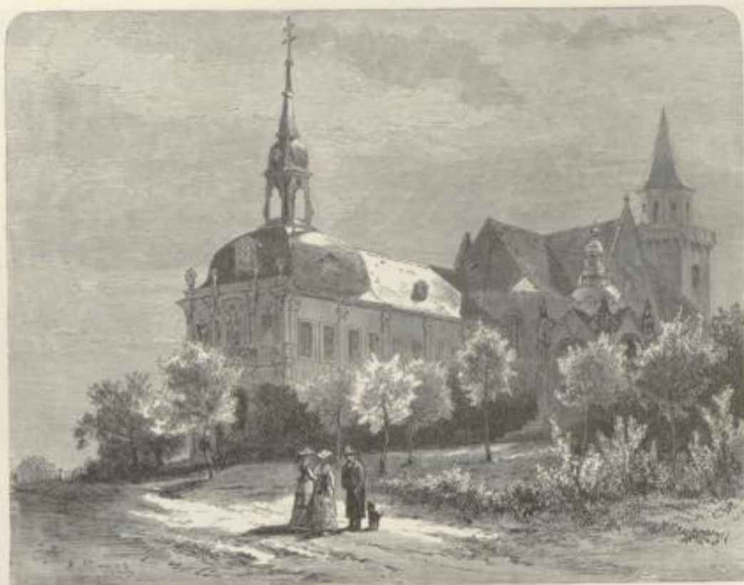
Gonn. Kirche auf dem Kreuzberg.

Lord*. Der Rhein ist so schön und die Hôtels sind so theuer geworden, daß ihre Preise selbst ihm imponiren würden, aber den „Lord“ bringt Keiner uns wieder! — Es lebt sich so schön in Bonn, der heiteren Mufenstadt, in der trotz all' der Summe von Gelehrsamkeit, die da beisammen ist, das wirkliche Studiren mit jedem Jahre wohl schwieriger werden mag, je mehr die modernen Phäaken des Spazier- und Müßiggangs die alte ehrwürdige Bonna mit ihren Willen umzingeln. Wir aber, lieber Leser, müssen weiter! Den Eindrücken hingegeben, welche das Wunderthal des Rheins auf uns gemacht, sitzen wir wieder unter dem Zeltdach des Dampfers. Glatt und ruhig ziehen an uns zu beiden Seiten die Ufer vorüber; kein Fernrohr des Nachbarn stört uns; keiner der Passagiere springt vor uns auf, um uns neugierig mit seiner Breiteite die Aussicht zu sperren. Der Sonnenschein liegt träge auf dem Strom und den üppigen Tristen und immer weiter zurück tritt vor uns das sogenannte Vorgebirge.