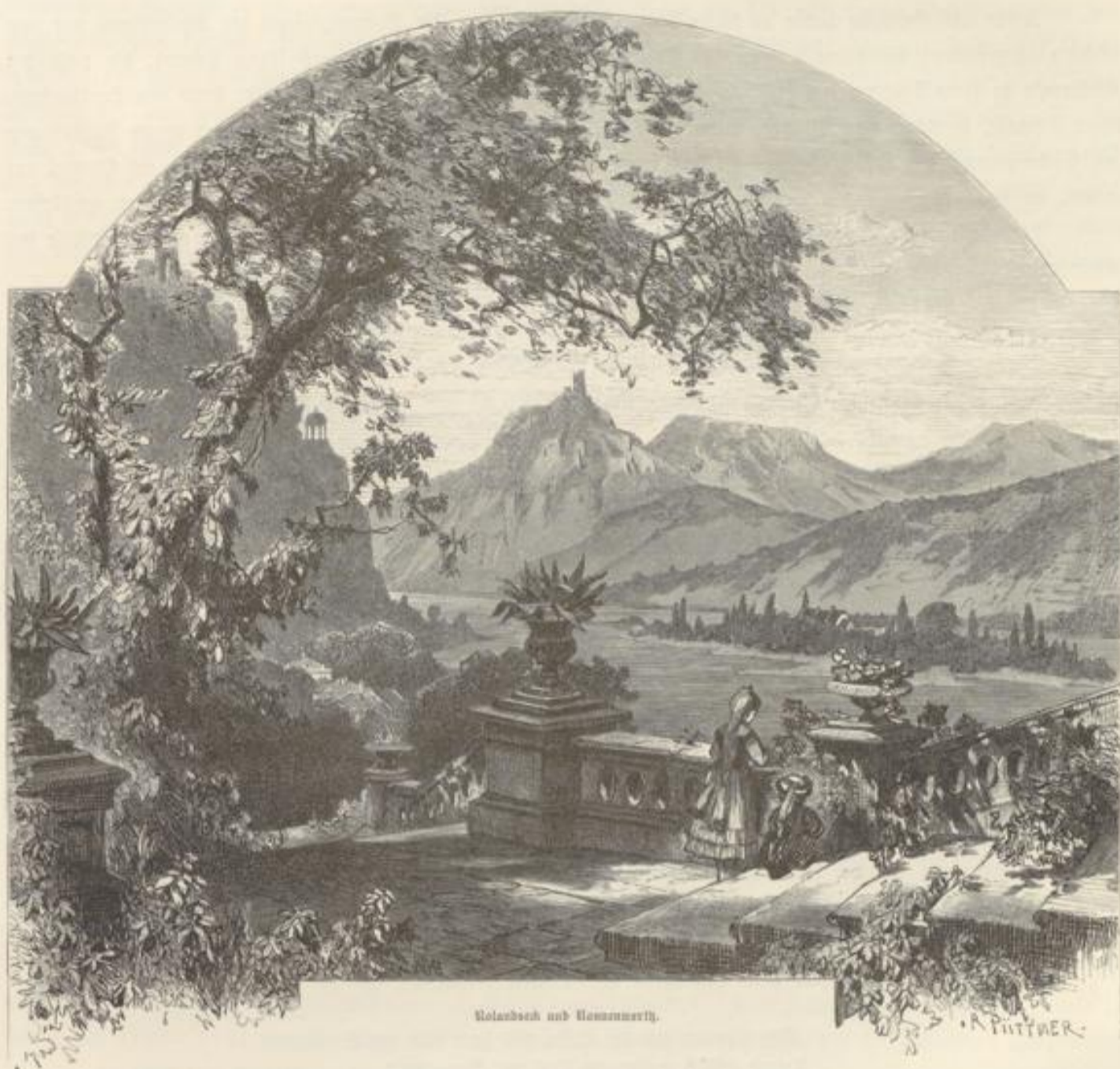
Rolandsch und Nonnenwerth.

über den Weg gestreut! — Und auch der Strom selbst scheint Aehnliches zu empfinden! Das große Himmelsgedicht, bald Idyll, bald Epos, geht hier zu Ende. In echt dramatischer Weise sagt der große Dichter noch einmal seine ganze Schöpfungsgabe zusammen, um uns mit dem Herrlichsten zu überraschen. Kaum bleibt uns die Muße für einen Blick nach links auf die kleinen Punkte Schloß Marienfels, auf Herresberg, nach rechts auf Anfel mit seinen Basaltbrüchen, und Rheinbreitbach landeinwärts, denn vor uns erhebt sich Rolandsch, ihm gegenüber der Drachensfels, umgeben von seinen steinernen Brüdern, und zwischen beiden tief unten, lauschig und traulich, umarmt vom silbernen Strom, die Insel Nonnenwerth!