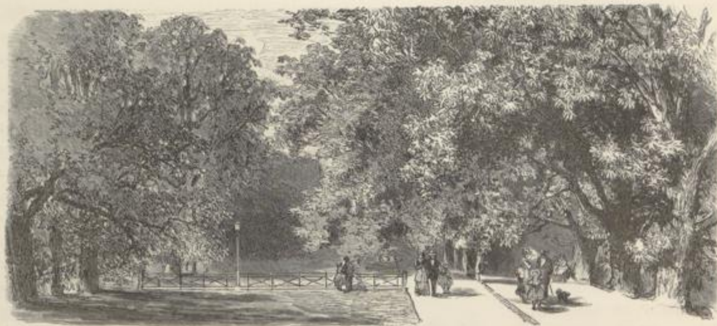
Bonn. Allee nach Poppelsdorf.

bekannte Allee nach dem Poppelsdorfer Schloß, ehemals Clemensruhe geheißten. Es ist dasselbe, von welchem schon die Rede gewesen; Joseph Clemens legte den Grundstein 1715 und Clemens August vollendete es im Jahre 1746. Friedrich Wilhelm III. überwies das Schloß der Universität für ihre naturhistorischen Sammlungen; der reiche botanische Garten hier ward erst 1820 angelegt. Noch neueren Datums ist die 1847 eröffnete landwirthschaftliche Akademie gegenüber.