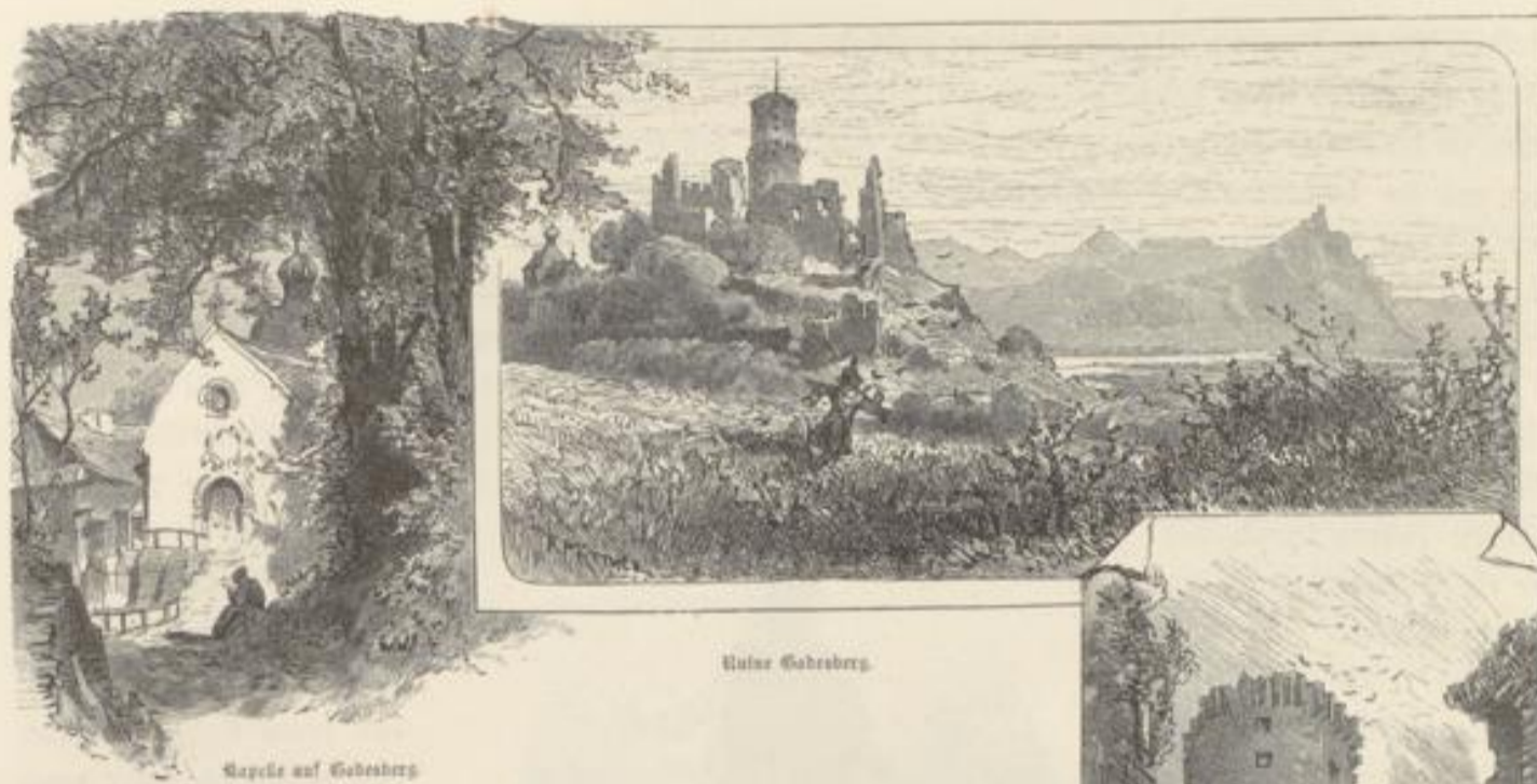
Kapelle auf Godesberg