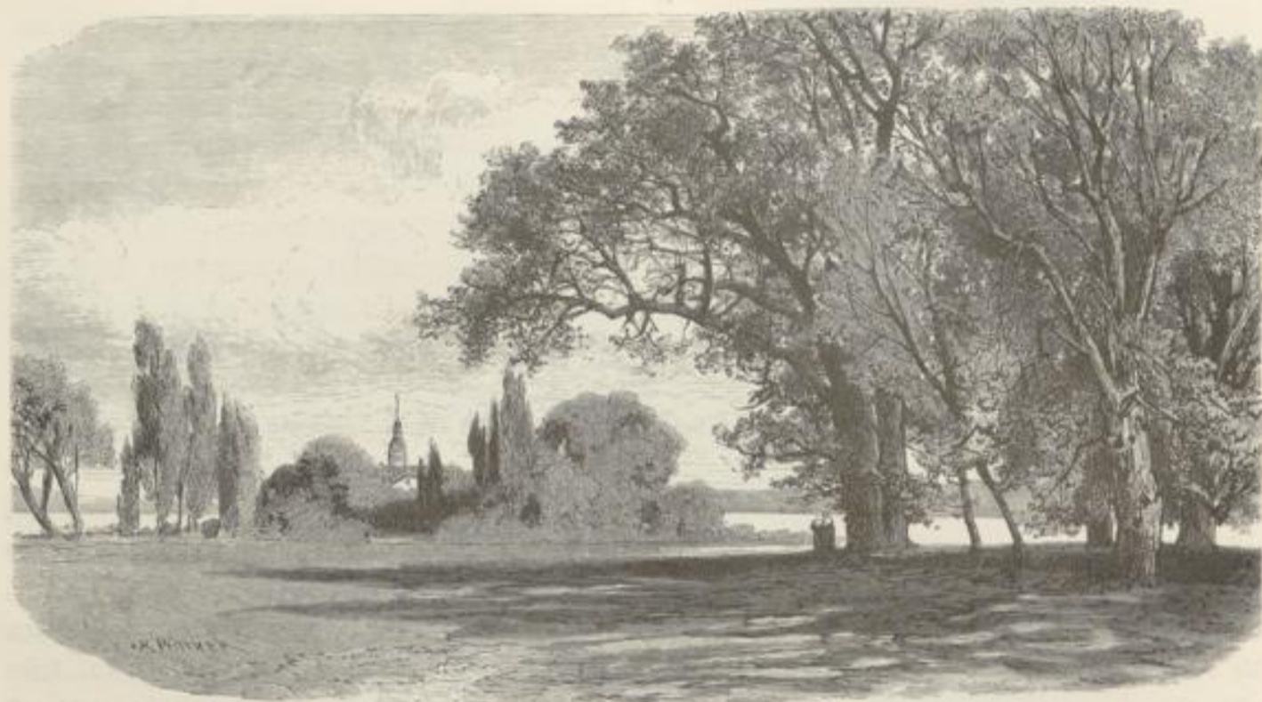
Blick auf Bonnenerth.