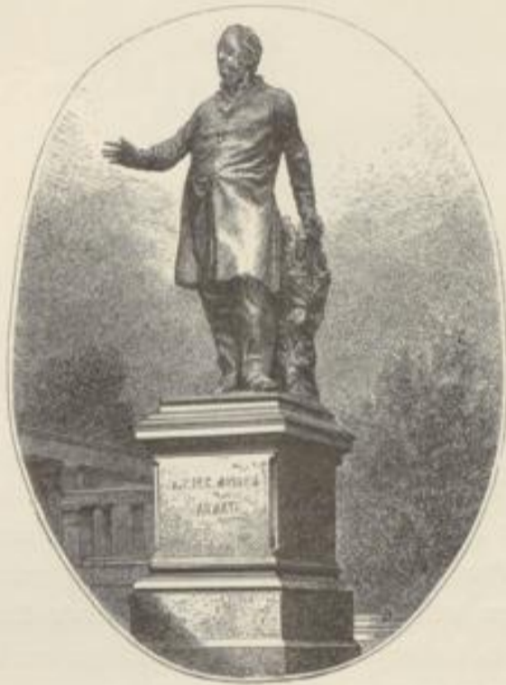
Gen. Arndt's Denkmal.

Die säugende Mutter nicht nur der wissenschaftlichen deutschen Jugend, sondern auch der Stadt selbst ist die Universität in dem ehemaligen kurfürstlichen Schloß, von so bedeutendem Umfang, daß das Gebäude fast die Südseite des Ortes einnimmt. Ihre Geschichte kennen wir bereits in großen Zügen. Von der Universität führt uns die