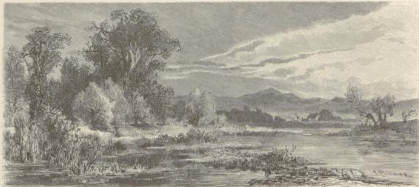
An der Sieg.

Acht doch bange werden mochte, that Abbitte, schenkte dem Bischof Siegburg als Sühnopfer und ging in's Kloster, erschien aber sehr bald wieder, sammelte ein neues Heer und überfiel abermals das Erzstift. Kaum aber stand er den Mannen des Erzbischofs bei Rochem an der Mosel gegenüber, als er mit seiner Gattin, die das ebenfalls abgelegte Kloster-gebäude nicht brechen wollte, in Janf gerieth, diese erschlug und dann mit lautem Gelächter zu seinen Kriegsleuten hinaus lief, um ihnen von seiner That zu erzählen. Sein Heer gerieth darob in Unordnung und Auflösung. Heinrich ward ergriffen und wiederum in's Kloster gesperrt, wo er unter strenger Ueberwachung sein düsteres Leben beschloß.