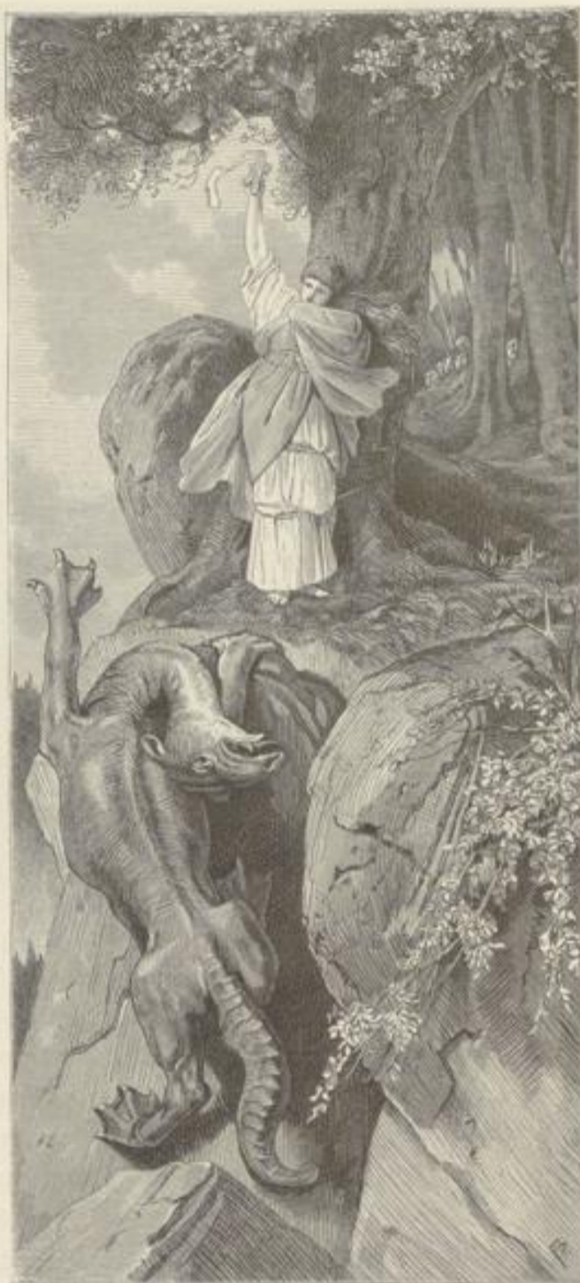
Sage vom Drachstein.

Nach einer anderen Sage speiste das Heidenvölk im Gebirge auf den Rath seiner Priester den Drachen mit den Leibern seiner Gefangenen, und um ihn guter Laune zu erhalten, mußte man stets für Opfer sorgen. So schleppte man denn von einem Kriegszuge unter anderen Gefangenen auch eine wunderbar schöne christliche Jungfrau mit heim, in die sich die beiden Söhne des Häuptlings verliebten. Um den Bruderkampf zu vermeiden, beschloßen die Priester, auch das Mädchen dem Drachen zu opfern. Heimlich ward die Aermste in dunkler Nacht an den Platz geschleppt, wo der Lindwurm seine Opfer zu suchen gewohnt, und dort an einen Baumstamm gefesselt. Am Morgen kam der Molch, sein Frühstück zu suchen. Schon berührte die Jungfrau sein heißer, versengender Athem, da erhob sie die zum Himmel gefalteten Hände, dem Ungeheuer das Kreuz entgegenstreckend, das man ihr zum letzten Gange gelassen. Und das Ungethüm, das Kreuzifix erblickend, that ein furchtbares Geheul, das den hinter dem Felsen versteckten Pentern das Mark in den Gliedern erschütterte. Sich hoch aufbäumend überschlug es sich, stürzte jählings hinab von Fels zu Fels und versank zerhmettert unten in den Fluthen des Rheins. — Die Wunderthätigkeit des Kreuzes belehrte natürlich das rohe Heidenvölk, das sich anbetend vor der Jungfrau