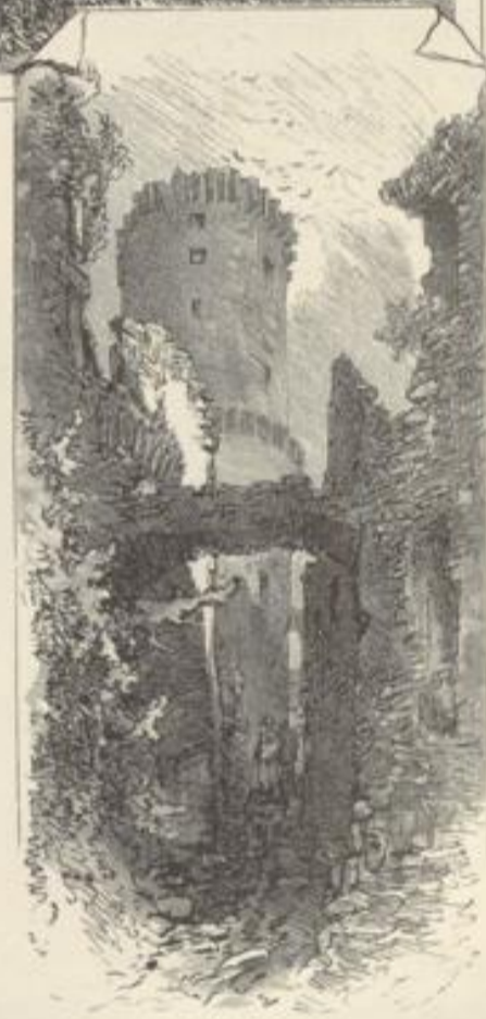
Eingang zur Ruine Godesberg

Die Ufer hier umher haben nicht mehr den Ehrgeiz, mit den Bunden wetteifern zu wollen, die jetzt hinter dem Ausgangsthor des Rhein-Paradieses verschlossen liegen; mit ruhigerem Auge überschaut der Reisende den weiten Plan, durch welchen selbst der Strom sich nur müde dahin zu wälzen scheint. Landeinwärts macht sich noch bemerkbar die Ruine der Burg Godesberg, über Künigsdorf auf den Rhein hinabsehend, ein überaus malerisches altes Gemäuer, das Erzbischof Dietrich I. im Jahre 1210 von dem Gelde, das er einem gefangenen Juden als Lösegeld erpreßte, erbauen ließ. Saat und Ernte sind der einzige Wechsel, der uns auf beiden Ufern des Rheins noch umgibt, und die Stromgegend selbst schickt sich an, in den Charakter der niederländischen Ebene überzugehen, bis uns zwischen Hügeln und lieblichem Grün die Thürme des Münsters von Bonn entgegen schauen.