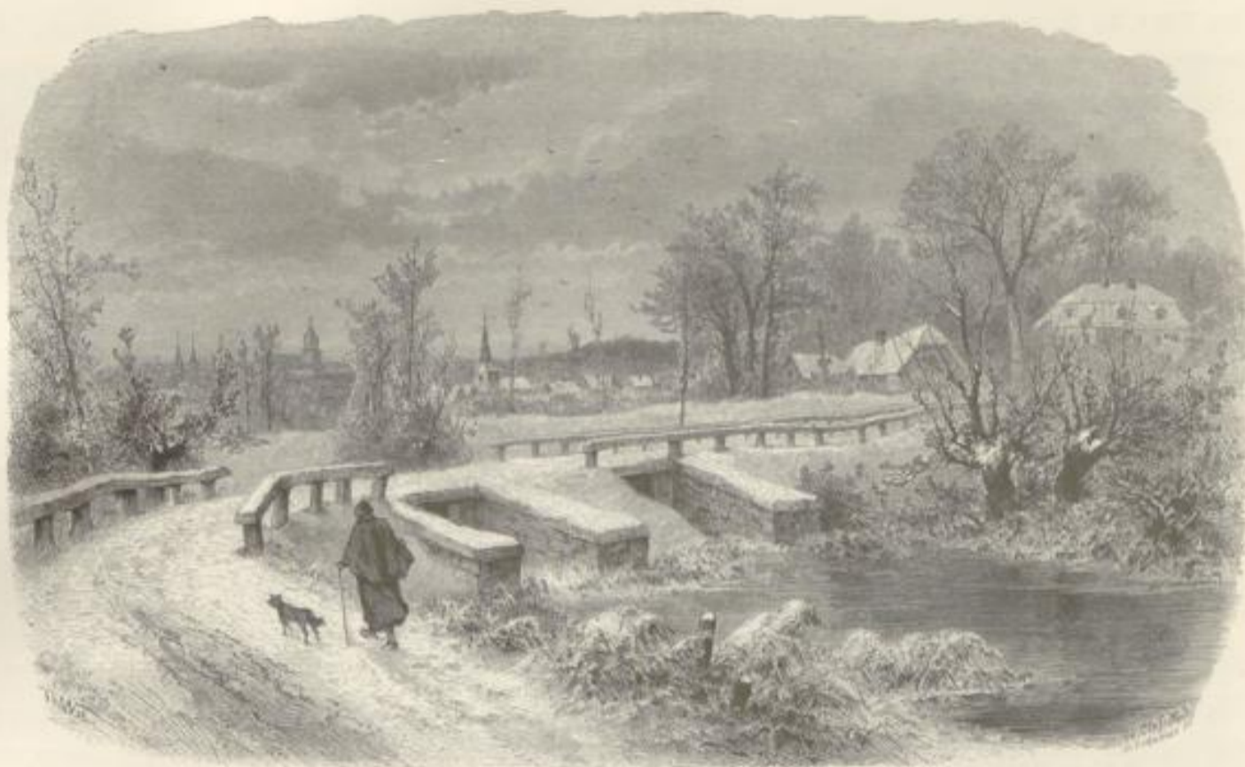
Der alte Rhein bei Gless.

sowie über uns am rechten Ufer die Wälle der starken Festung mit einer am Rande der Bastion stehenden Schildwache, die auf Kameraden hinabschaut, welche flatternde Bäsche an Seile befestigen, Bilder aus dem Soldatenleben im Frieden. —