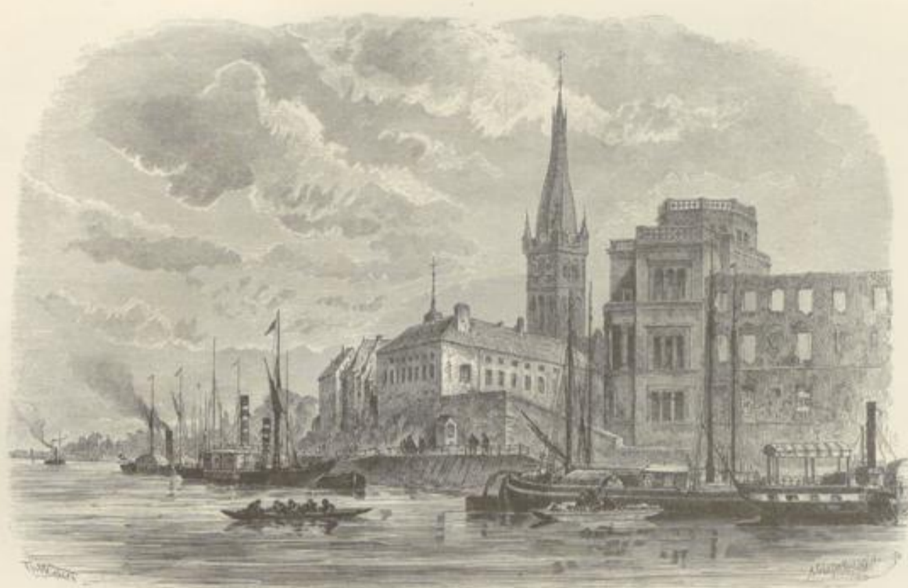
Düsseldorf von der Rheinfelie.

glücklicherweise die einst berühmte Gallerie älterer Meister mit immer noch bedeutenden Kunstschätzen verschont wurde. Wenn wir von hier, dem am Ufer des Rheins niedrig gelegenen und ältern Quartiere Düsseldorfs, eine der bevölkertsten und durch Geschäftsbetrieb aller Art lebhaften Straßen, zum Beispiel die Ritterstraße, aufwärts steigen, so gelangen wir an freundliche Parkanlagen, die den wenig benützten Hafen am nördlichen Ende der Stadt umschließen und uns von der Höhe eines Belvedere einen hübschen Blick gewähren auf das neue Düsseldorf mit seinen breiten Straßen und Alleen, seinen Gärten und Parkanlagen, seinen stattlichen, häufig palastähnlichen Gebäuden, wie es die ältere dunkle RheinStadt in einem weiten grünen Kranze umfaßt. Die alte Stadt ist eine der wenigen unter den heute bedeutenden Städten des Niederrheins, die keine Vergangenheit aufzuweisen vermögen. Erst im vierzehnten und fünfzehnten Jahrhundert schwang es sich zu einer kleinen Stadt empor und wurde einigermaßen bedeutend, als die Herzoge von Berg zu Anfange des sechzehnten Jahrhunderts und später die Fürsten aus dem pfälzischen Hause hier ihre Residenz verlegten, wobei es zu gleicher Zeit für die Stadt von Wichtigkeit war, daß sie für einen großen Theil der sich rasch bevölkernden, industriereichen Wuppergegend den Rheinhafen bildete, ja für das ganze Lippe- und Ruhrgebiet mit Wesel, Ruhrort und Duisburg.