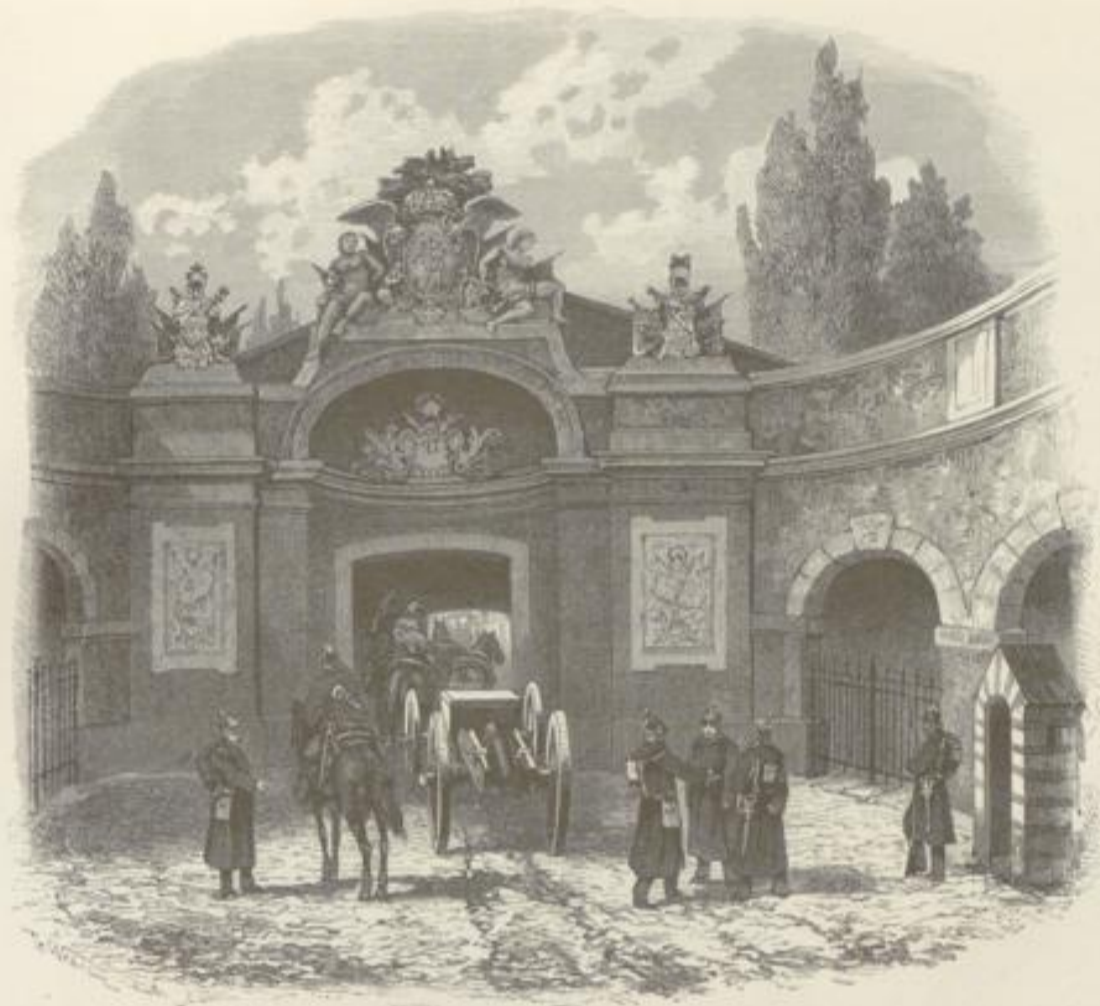
Berliner Thor in Wehl.

und endlich der bedeutendste dieser Flüsse, die Ruhr, dessen Mündung wir nach kurzer Fahrt erreichen und damit eines der interessantesten, malerischsten, gewerbfleißigsten Gebiete des Niederrheins, mit einem Boden, ebenso reich an Kohlen wie an Erz, an großen historischen Erinnerungen und an reichen und bedeutenden Städten, wie Arnberg, Altena, Herlohn, Hagen, die sich wie kostbare Perlen an den Faden des Flusses reihen.