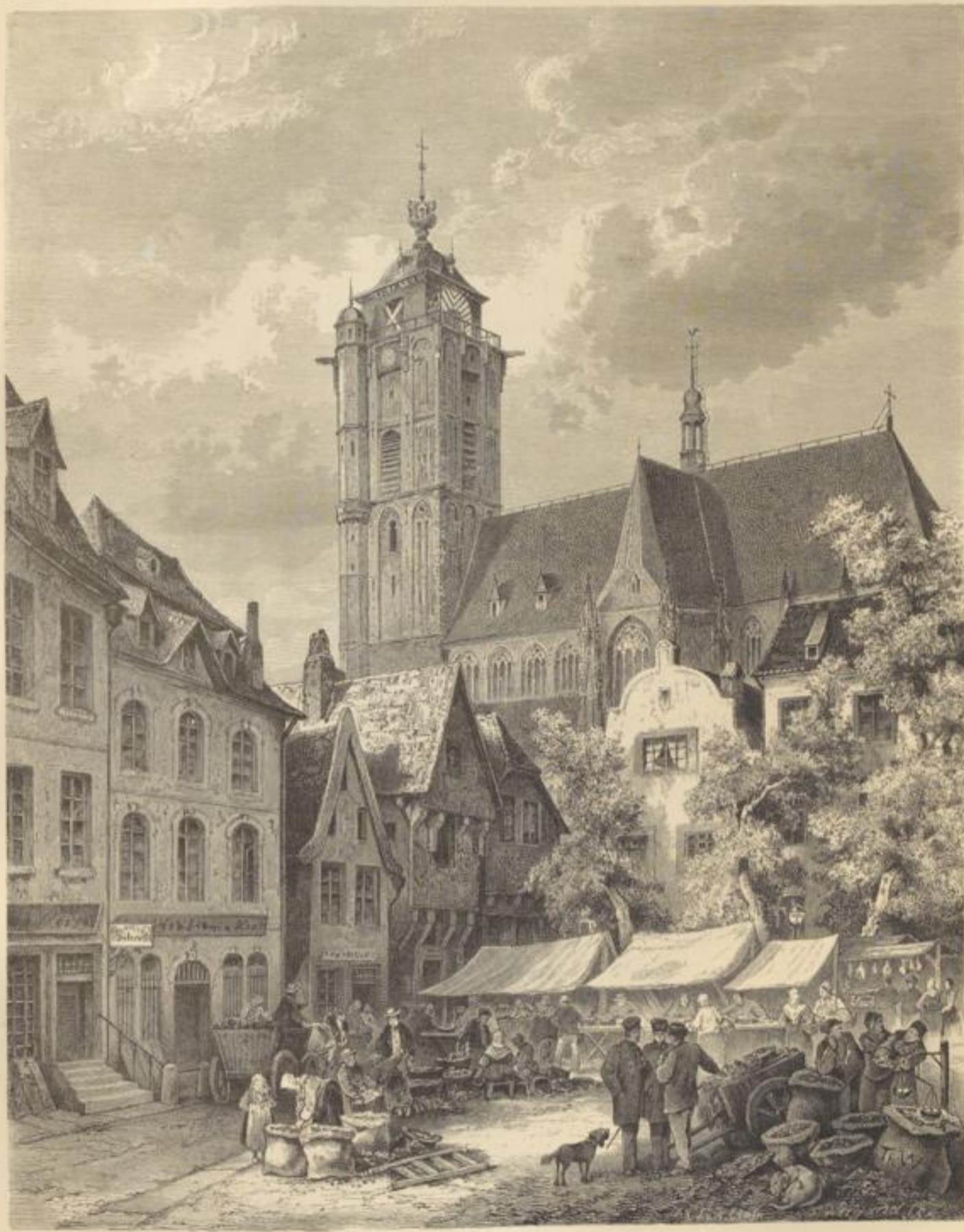
Markt in Daisburg. Von Ch. Weber.