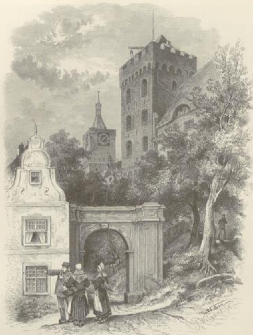
Lein. Schloßthor mit Schwanenthurm.

Docks, Hafen- und Kanalbauten, dabei Schiffswerften, das Ufer mit Fahrzeugen aller Art bedeckt, ein wahrer Mastenwald. — Duisburg erscheint uns daneben in vornehmer Zurückgezogenheit, dabei aber nicht allein vom Ruhm vergangener Tage zehrend, sondern auch heute noch in seinen Fabriken, Eisenwerken und Schiffswerften, letztere am Rhein-Ruhr-Kanal gelegen, bedeutend; die Kirche von St. Salvator ist eine der schönsten gothischen des fünfzehnten Jahrhunderts und wenn wir ihre kühn aufstrebenden hochgewölbten Hallen für einen Augenblick besuchen, so geschieht das nur, um als gewissenhafte Reiseführer am Grabe des großen Geographen Gerhard Mercator für etwaige kleine Schnitzereien, die auch dem Besten passieren können, Vergebung zu erhalten.