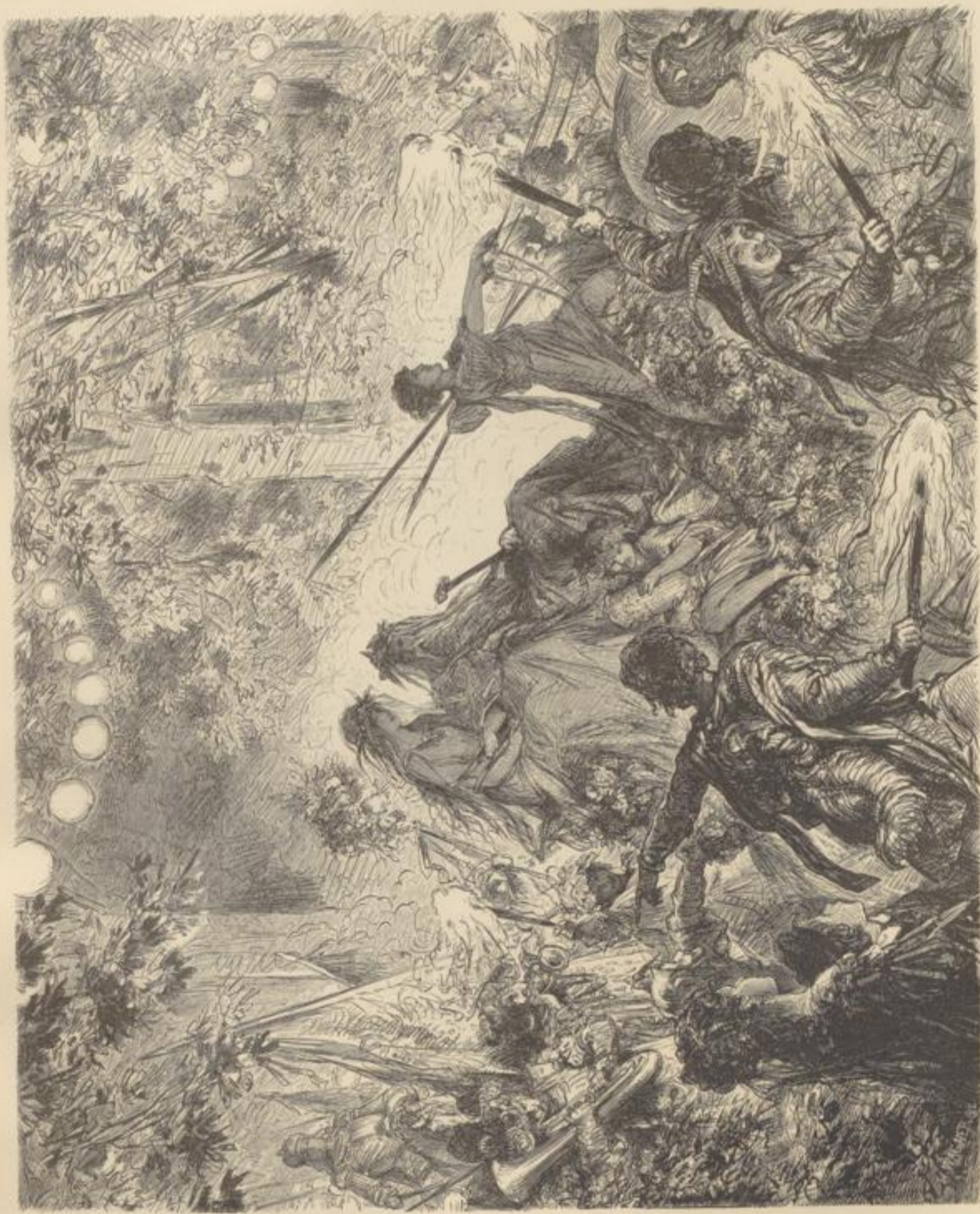
Gartenfest der Düsseldorfser Kämpfer. Von W. Simmler.