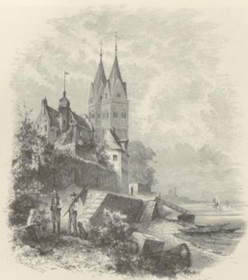
Stiftskirche in Kaiserwerth.

zur malerischen Wupper- und Ruhrgegend ansteigend, uns zu einem kleinen Ausflug nach Elberfeld und Barmen veranlassen, welche beiden Städte sich mehrere Stunden lang ununterbrochen längs dem Flusse an der Abdachung des Gebirges hinziehen. Angefüllt mit Geld und Frömmigkeit verdanken sie ihren raschen, erst von der zweiten Hälfte des vorigen Jahrhunderts datirenden Aufschwung hauptsächlich ihrer bedeutenden industriellen Thätigkeit und sind mit ihren Sammt- und Seide-, Garn-, Band-, Seifen- und chemischen Fabriken mit unter die gewerbreichsten Städte des Niederrheins zu zählen. — Was den kleinen Fluß, die Wupper, anbelangt, so ist dieses in seiner Jugend so lustig und schnell strömende Bergwasser hier ein bedauernswürdiger Geselle geworden, der, gezwungen, die Abflüsse aus den Blau-, Schwarz- und Rothfärbereien in sich aufzunehmen, die Farben wie ein Chamäleon wechselt, dabei häufig bemerkbar ausdünstend, und später bei Rheindorf, nicht weit von Benrath, in den Rhein schleicht.