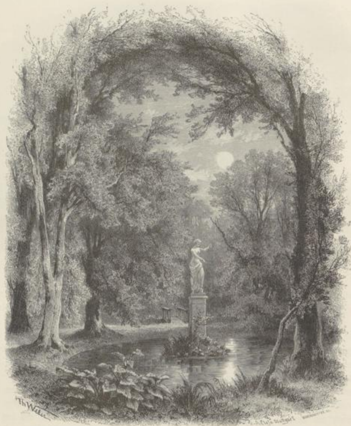
Düsseldorf. Alter Jacobi'scher Garten.

der rauschenden Düffel vorbei, folgen wir einer geraden, mit vierfachen Reihen prächtiger Bäume besetzten Allee, um uns jenem malerisch schönen und poetisch stillen Garten zuzuwenden, der mit seinen hundertjährigen Baumriesen, seinem glücklicherweise noch gänzlich unverehrten schattenreichen Parke an jene Blüthezeit deutscher Literatur erinnert, an jene Zeit gemüthlichen Zusammenlebens geistverwandter Zeitgenossen, an jene Tage, die der Altmeister Goethe hier bei Jacobi, dem wahren Gründer dieser Anlagen, verbrachte. — Ehe die neue Stadt ihre Straßenfüßler bis hier heraus erstreckte, noch zu Anfang der fünfziger Jahre, war der Jacobi'sche Garten bei Pempelfort ein fast ebenso einsam entlegener Grund, als damals, wo Goethe, welcher im Jahr 1792 nach der Campagne in Frankreich hier war, von ihm erzählte, er habe mit Jacobi von Pempelfort aus eine Fahrt nach dem nicht fernem Düsseldorf gemacht.