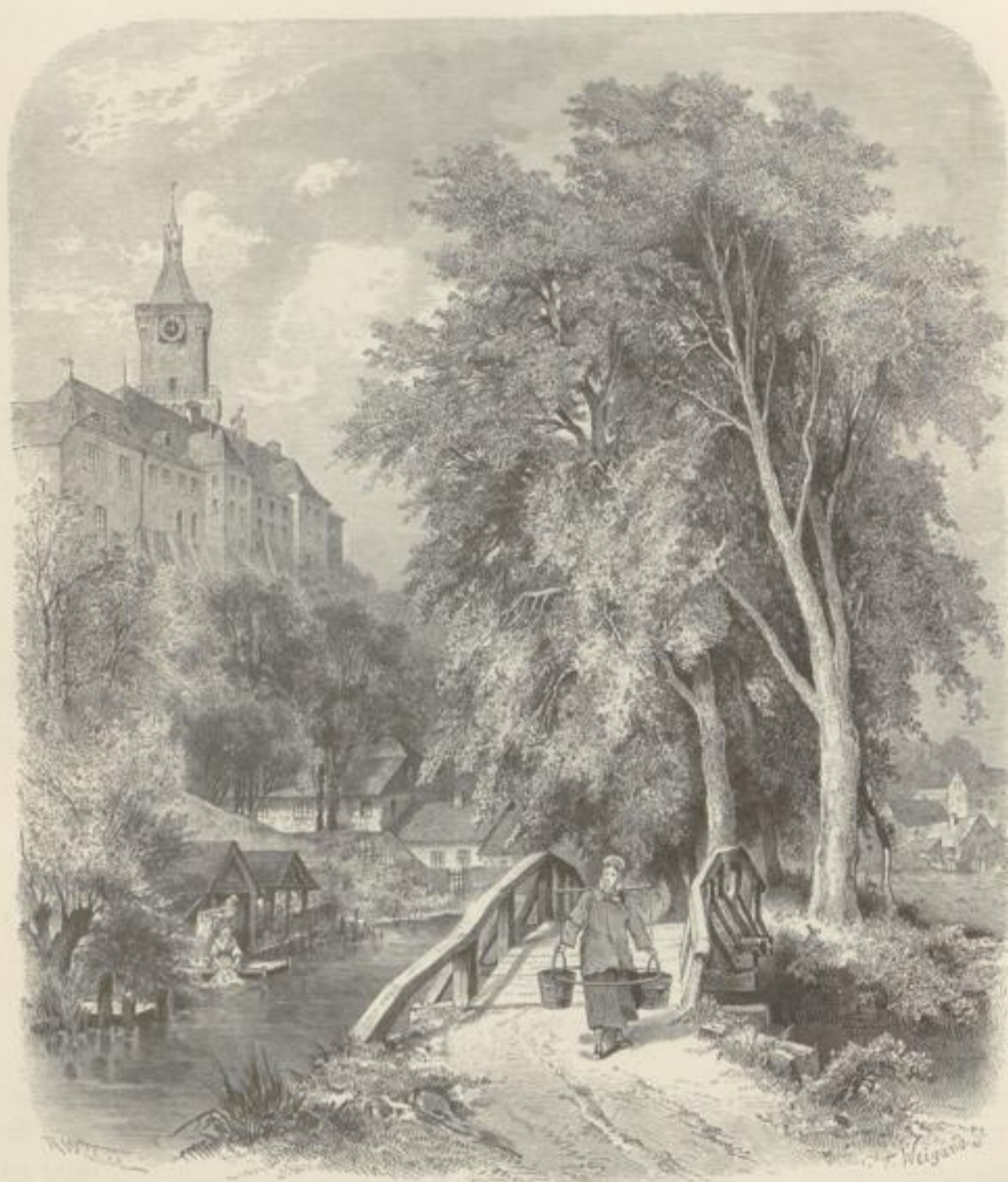
Schloß in Elsen.

riesiges Hermannsbild, die Eichengipfel überragend, hinausschaut weit über die deutschen Lande, nicht drohend gegen die Nachbarn, sondern ihnen ein gewaltiges Schwert zeigend, von kräftigem Arm geschwungen, stets bereit, auf Eindringlinge niederzuschmettern. — Ueberhaupt ist hier das gewaltige Erzbild des herustischen Fürsten als Erinnerungszeichen an zahllose Kämpfe, Schlachten und Verwüstungen vortrefflich an seinem Plage, denn im ganzen großen Deutschland hat wohl kein Fluß so zahlreiche und verschiedene Kriegerhaaren an seinen Ufern aufwärts ziehen sehen. — Heute ist an der Lippemündung schon seit lange und hoffentlich für immer der kriegerische Lärm verhallt, flache Boote gleiten den Fluß hinab, an seinen Ufern braußt die Lokomotive und vom Berdeck unseres Dampfers, der bei der Schiffbrücke anlegt, sehen wir drüben die Bädericher Insel mit den Mauern des Forts Blücher, den Bräulentopf von Wefel,