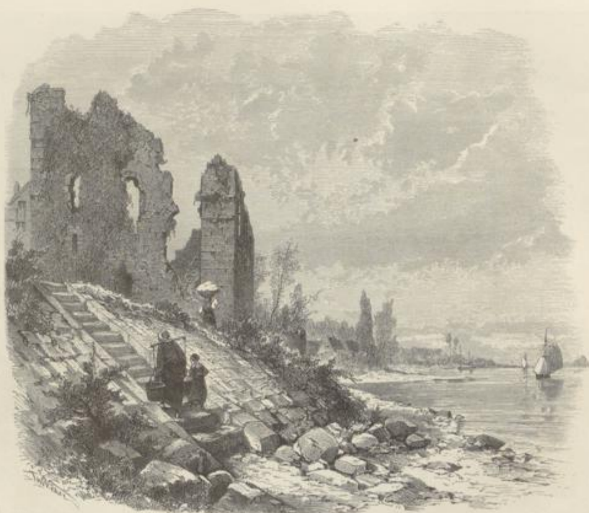
Kulne der Pfalz Kalferswerth.

eine glückliche Wiederherstellung des Alten mit angenehmen und reizenden Zuthaten, bequemen Sitzgelegenheiten überall, Regelpfand und Schaukel, versteckten Ruheplätzen, mit anmuthigen Statuen, die aus dem tiefen Grün hervorleuchten, oder wie die wunderbare Venus von Milo hier auf unserer Zeichnung im Mondenlichte fast belebt erscheinen. Das hübsch gelegene Manfarden-Bohnhäus, noch aus jener berühmten Jacobi'schen Zeit, wurde gleichfalls erhalten, ein weiteres stattliches Gebäude aufgeführt und die frühere Orangerie zu einem der angenehmsten Gesellschaftssäle umgewandelt, die man sich nur denken kann. So recht vom heiteren gemüthlichen Künstlergeist durchweht umfassen uns diese Räume mit ihrer dunklen Holzvertäferung, den herrlichen Gobelins, allerdings nur auf grobe Leinwand gemalt, den antiken Kronleuchtern auf's Traulichste; wir erfahren bald, daß die bauchigen Krüge und Gläser nicht nur zum Ansehen auf ihren Gestellen stehen, und wenn wir das Glück haben, einer jener theatralischen Vorstellungen, der Auf-führung lebender Bilder, oder eines jener vortreflich arrangirten Märchen beizuwohnen, so dürfen wir uns einen hochgenüßreichen Abend versprechen.