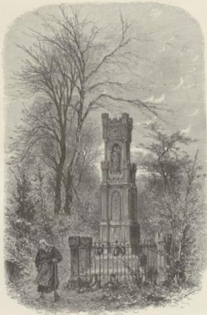
Alter Gottesacker in Grefeld. Denkmal für die Gefallenen von 1813 und 1814.

anderen noch malerische Spuren am Oberthor in den Ruinen des Drusus-thurmes erhalten haben. Die im Mittelalter so bedeutende Stadt, schon früher zum Hansabunde gehörend, mit einem weiten Stadt- und Handelsgebiete, zeigt in ihrer heutigen äußeren Erscheinung noch etwas von jener mächtigen Vergangenheit in der bemerkenswerthen Silhouette, besonders ihren Thürmen und ihren Kirchen, die unsere Blicke vom Fenster des Eisenbahncoupés auf sich ziehen. Vor Allem ragt über der Häusermasse St. Quirinus mit seinem hohen Thurme empor, neben ihm die prächtige Kirche, theils im romanischen, theils im gothischen Styl, eine breitschiffige