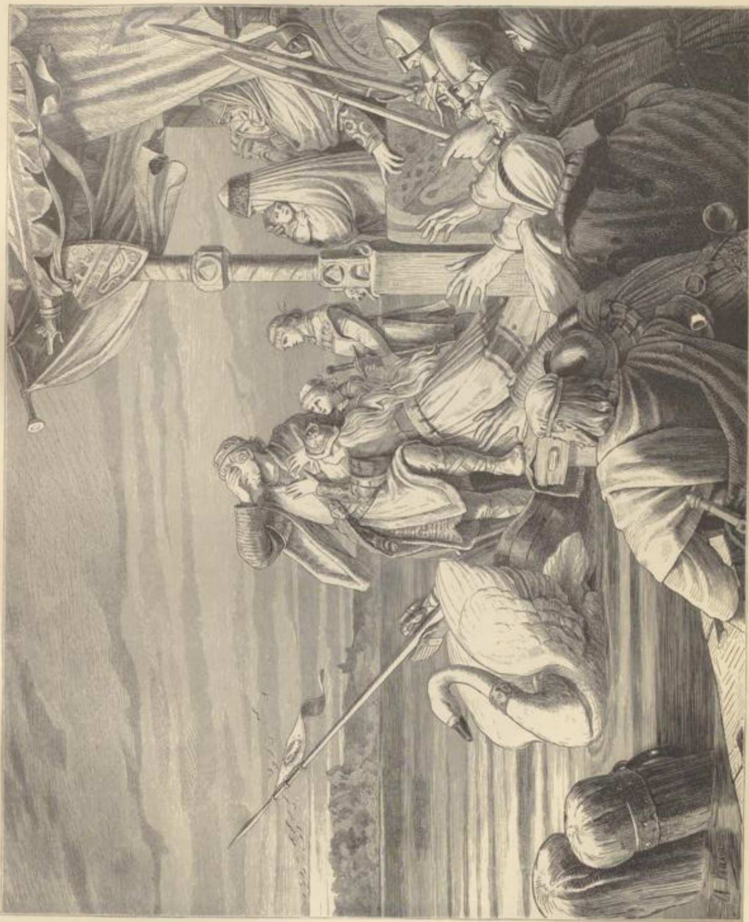
Kohengrin's Abschied. Von A. Baur.