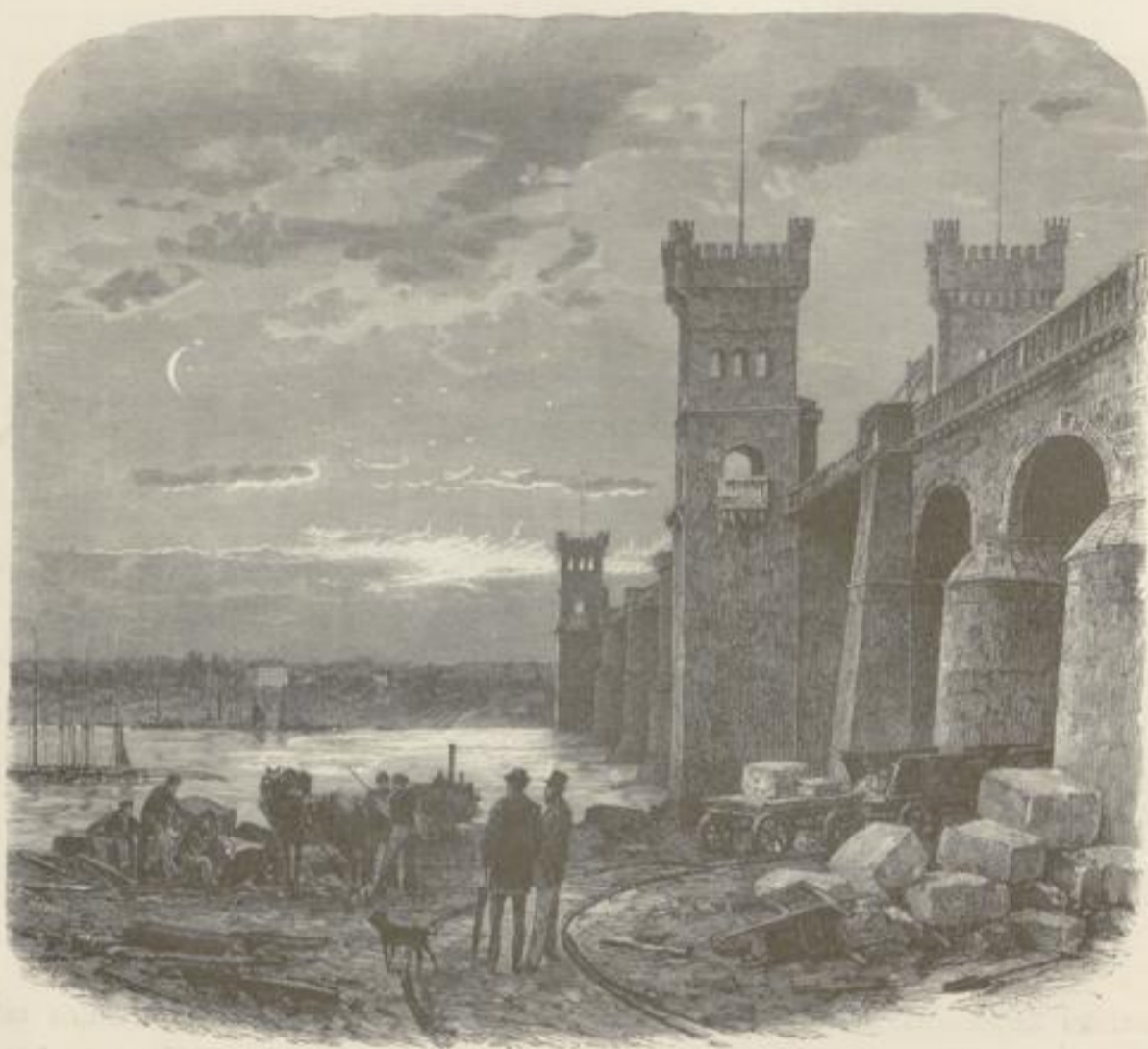
Kaiserbrücke bei Hochfeld.

entführt wurde, und der junge Prinz, der sich von seiner Mutter nicht trennen wollte, einen vergeblichen Fluchtversuch machte, indem er in den Rhein sprang. Wie bei so manchen Rheinstädten, gab auch hier eine Insel im Flusse Veranlassung zur ersten Ansiedlung. Es war um's Jahr 710, als der heilige Suidert hier zuerst das Evangelium verkündete und ein Kloster erbaute, worauf auch der alte Name Insula Sancti Suiderti hindeutet; heute noch werden die Gebeine des Heiligen in einem kostbaren silbernen Reliquienschrein in der alten Stiftskirche gezeigt, welche im zwölften Jahrhundert in romanischem Style erbaut, das alte Kaiserswerth überragt.