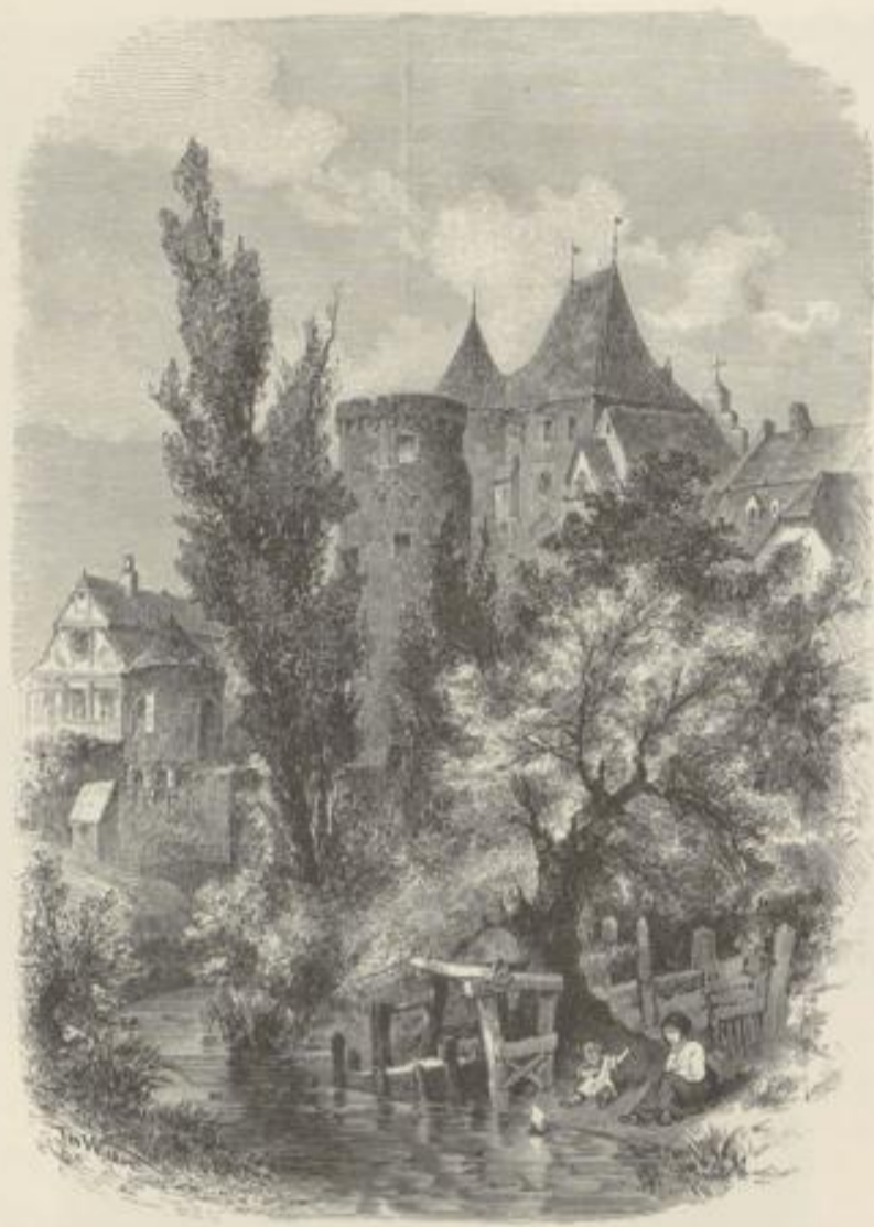
Konig. Oberthur mit Druschthorn.