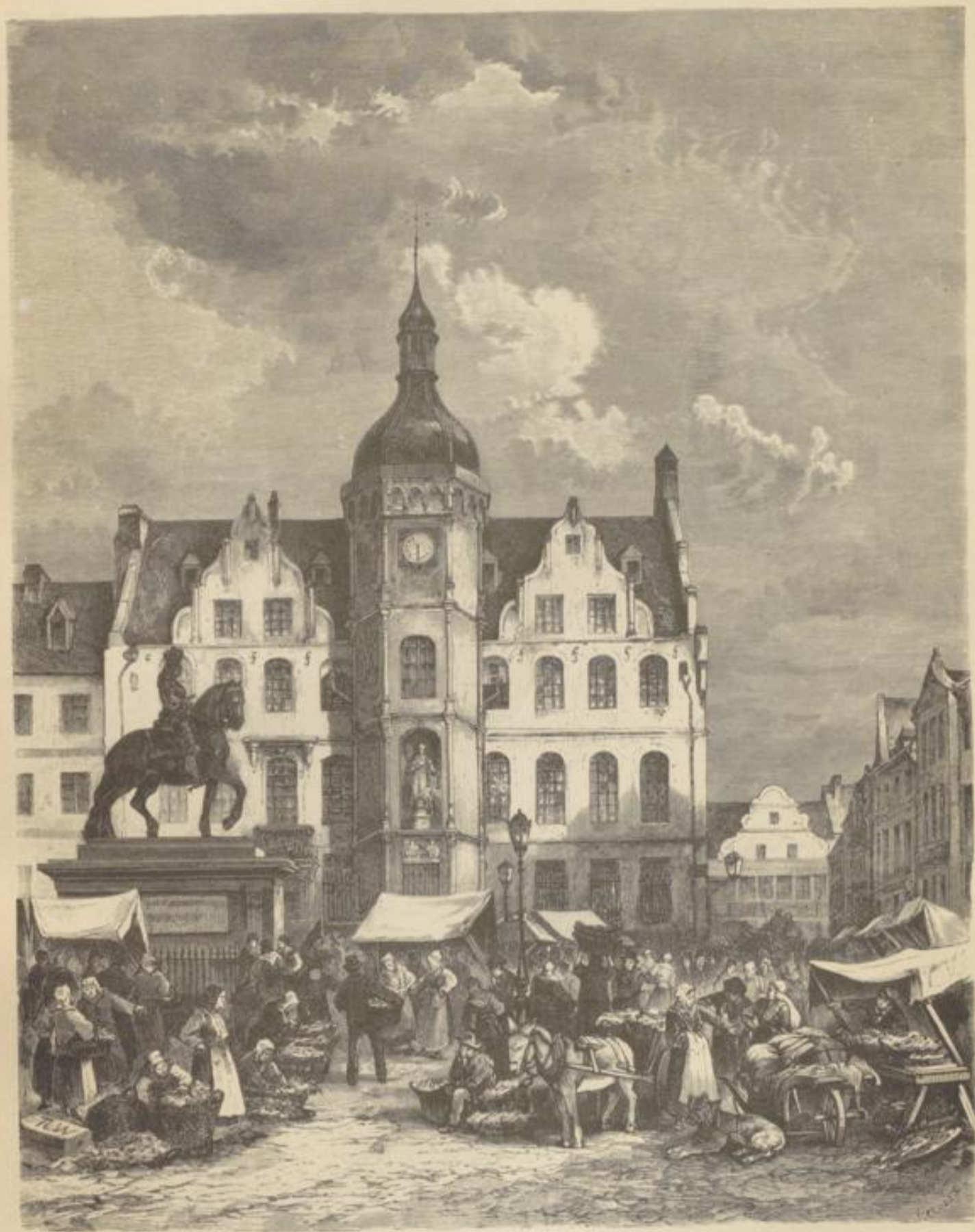
Marktplatz in Düsseldorf. Von Ch. Weber.