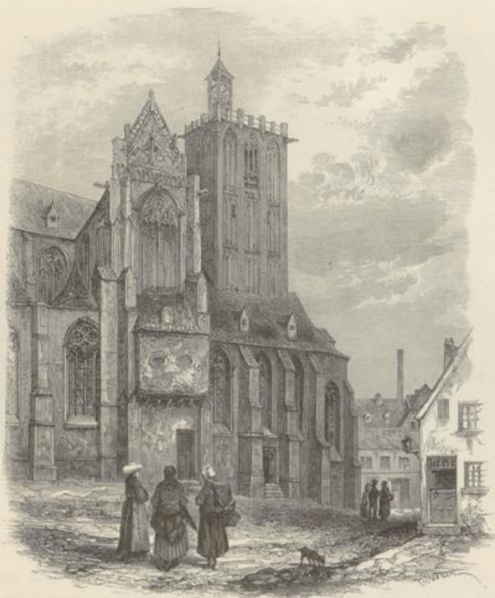
Willibrord's Kirche zu Wesel.

Punkt, vielleicht der Platz, wo Dispargum oder Duispargum, das vielgeachtete Schloß des fränkischen Heerführers und Königes Clodio, eines Vorläufers Chlodwigs, gestanden und von wo die ersten Kriegszüge gegen Gallien ausgingen. Jedenfalls war hier längere Zeit eine Residenz fränkischer Fürsten, die von Karl dem Großen bei seinen Zügen gegen die Sachsen zur Deckung des Rheins befestigt wurde, wo mehrere deutsche Kaiser Reichstage und Concilien hielten und der freien Reichsstadt Privilegien aller Art verliehen; auch lag Duisburg damals dicht am Ufer des Stromes und war deshalb auch schon als RheinStadt von großer Bedeutung, denn, wie die Chronisten erzählen, bedeckten seine Schiffe den ganzen Rhein von Straßburg bis Holland.