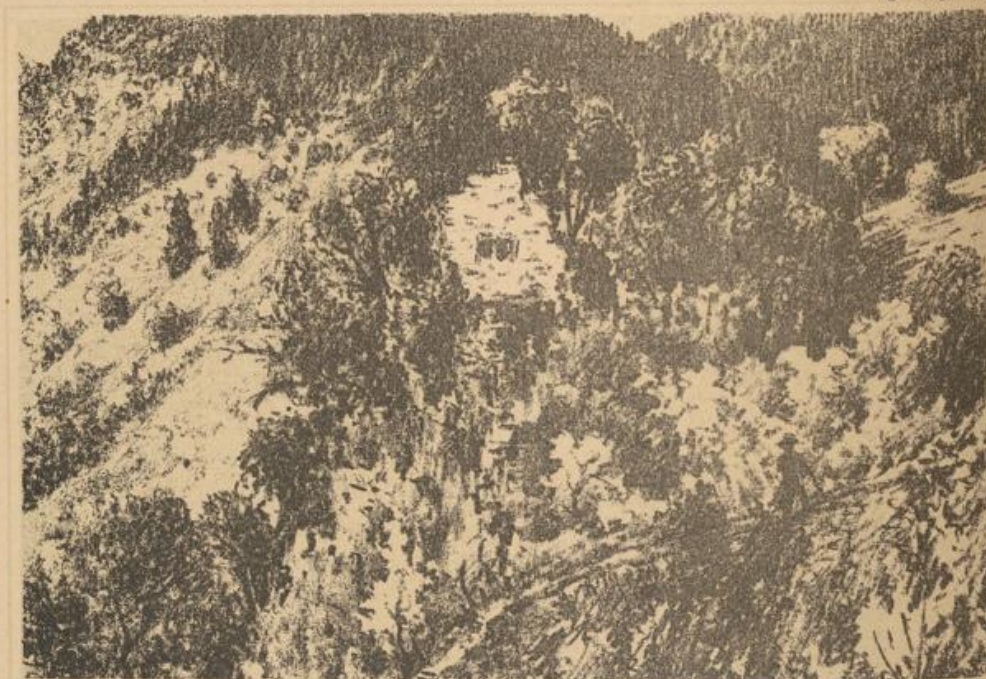
Burgruine Wallenstein in Oberwolfach (im Schapbacher Tal).