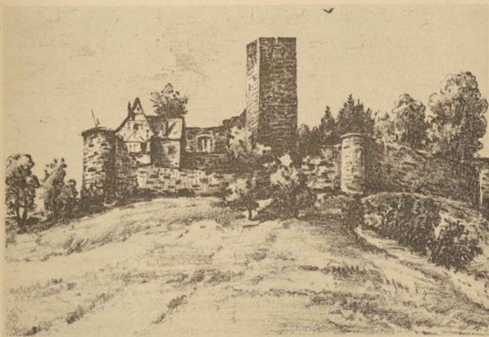
Schloßruine Ravensburg um 1900, von Nordosten.