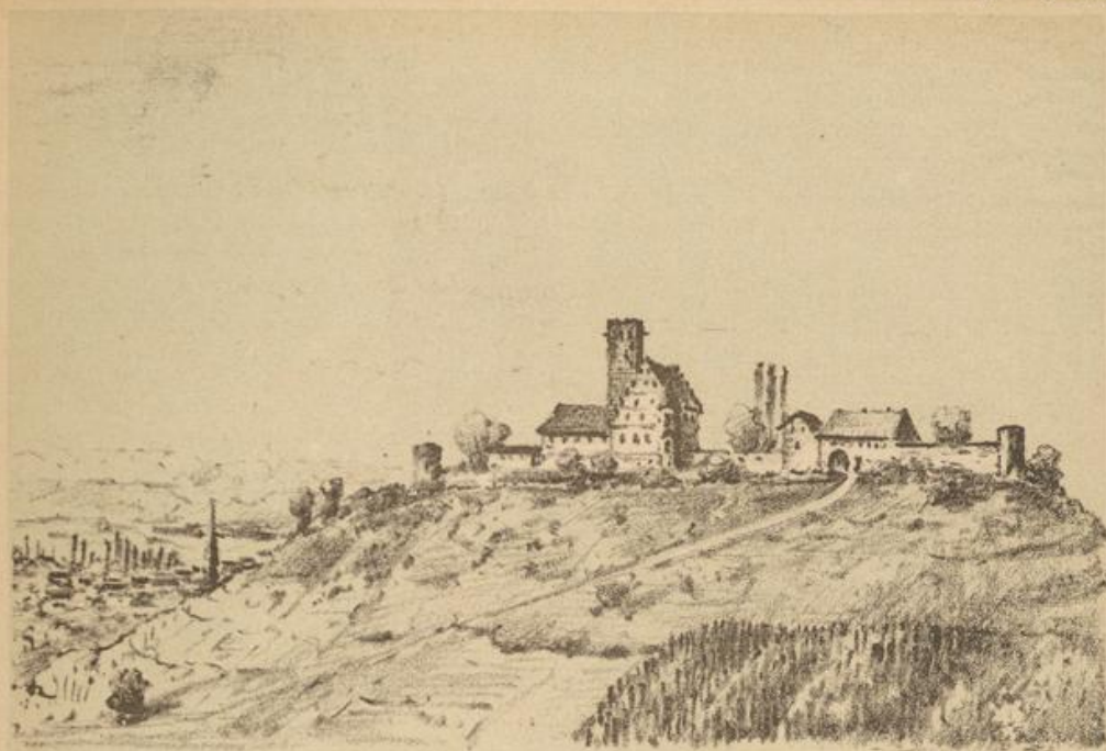
Die Ravensburg um 1840, vor Abbruch der Hauptwohngebäude.