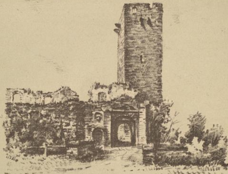
Eingang in die Ravensburg.