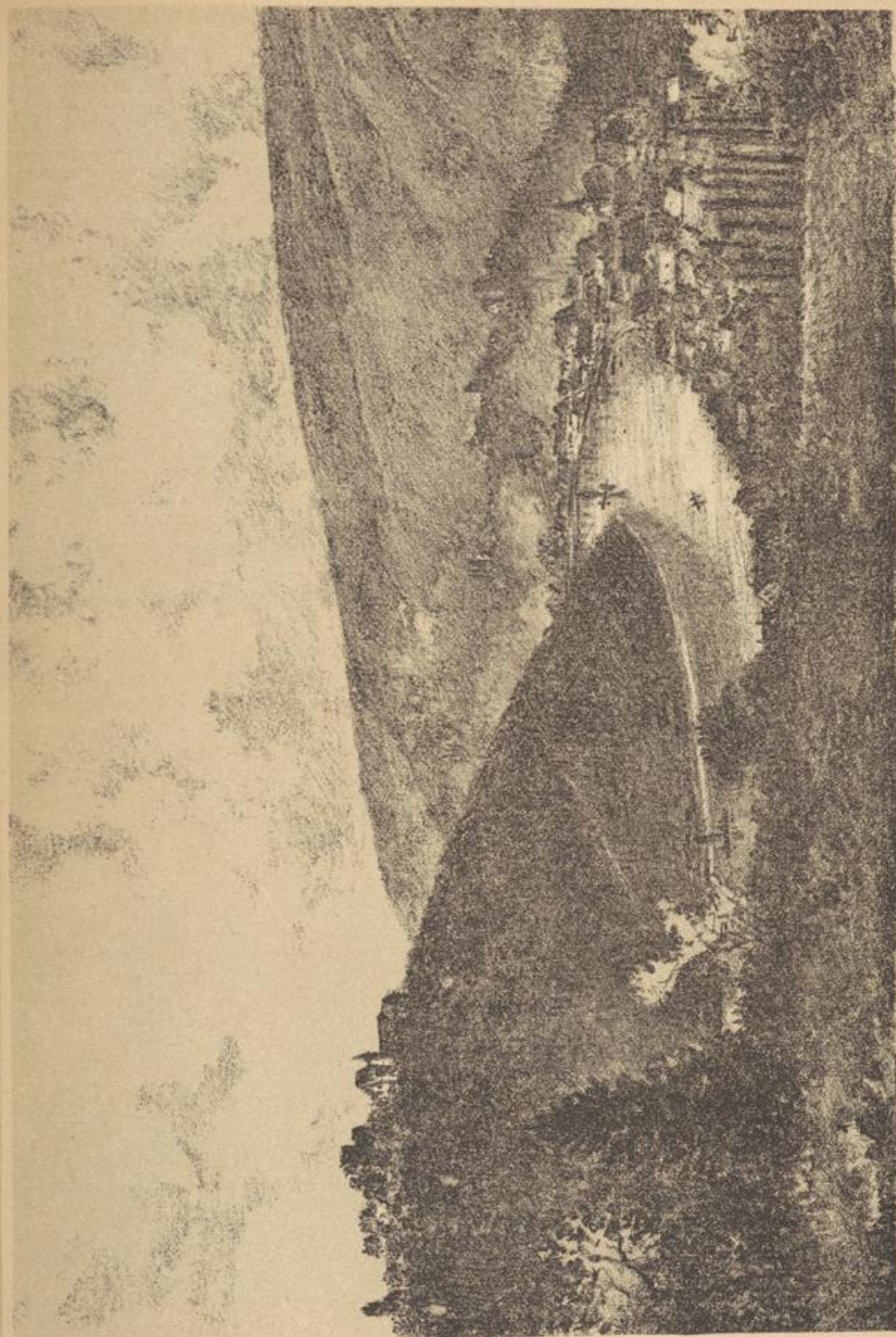
Dilsberg (oben) mit den vier Neckarsteinacher Schöffern (unten).