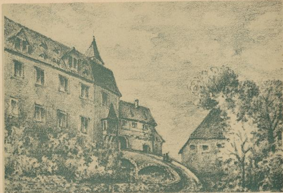
Schloß Dilsberg als Staatsgefängnis.