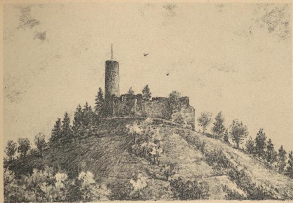
Burgruine Windeck bei Weinheim an der Bergstraße.