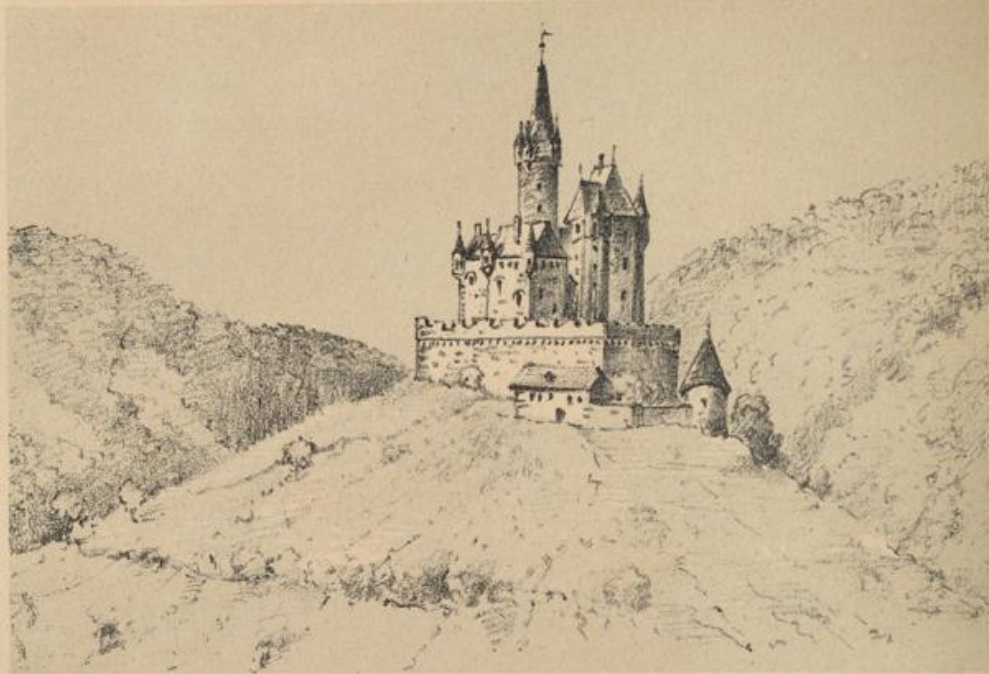
Burg Windeck um 1640.