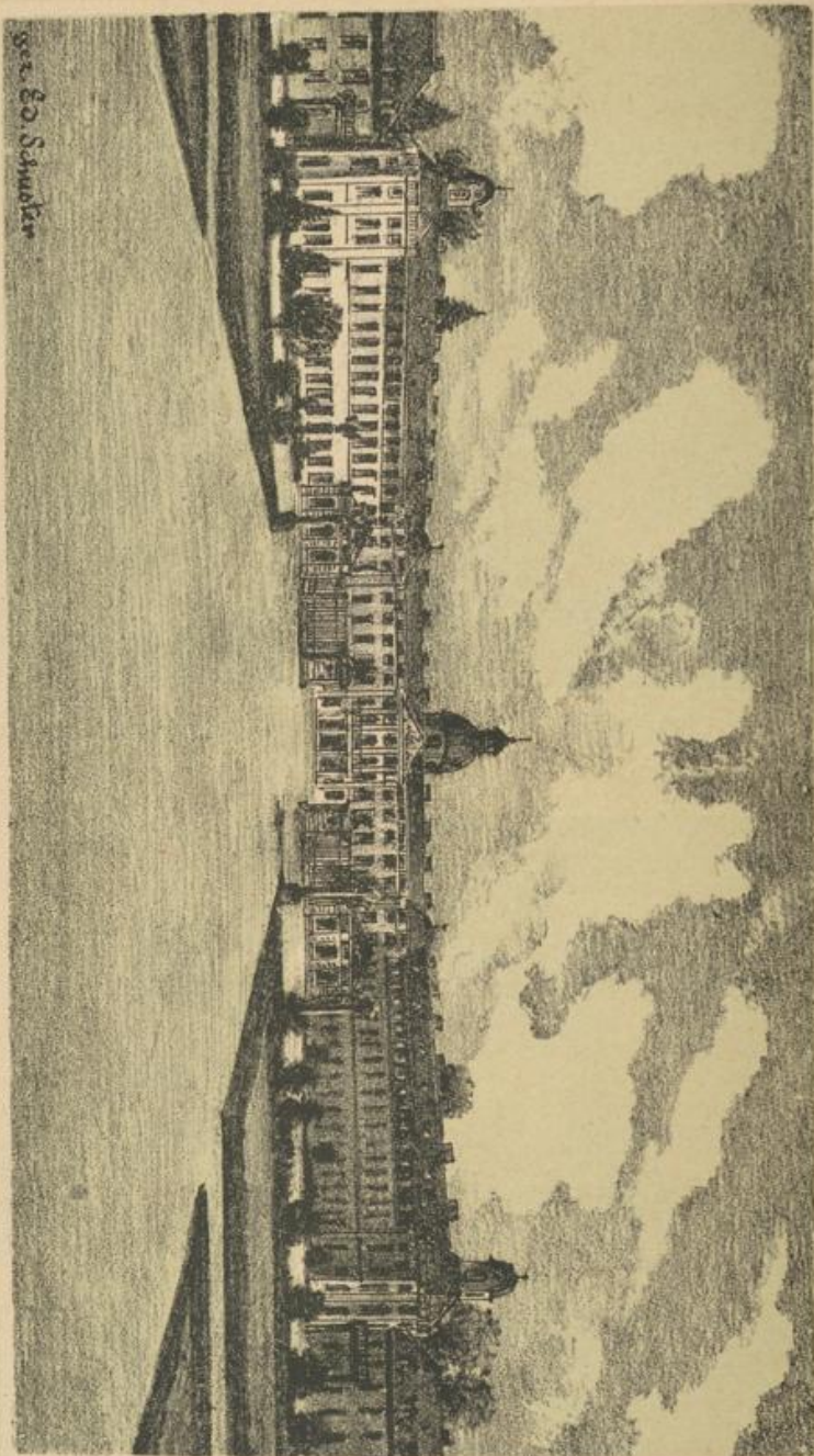
Das Großherzogliche Residenzschloß in Karlsruhe.