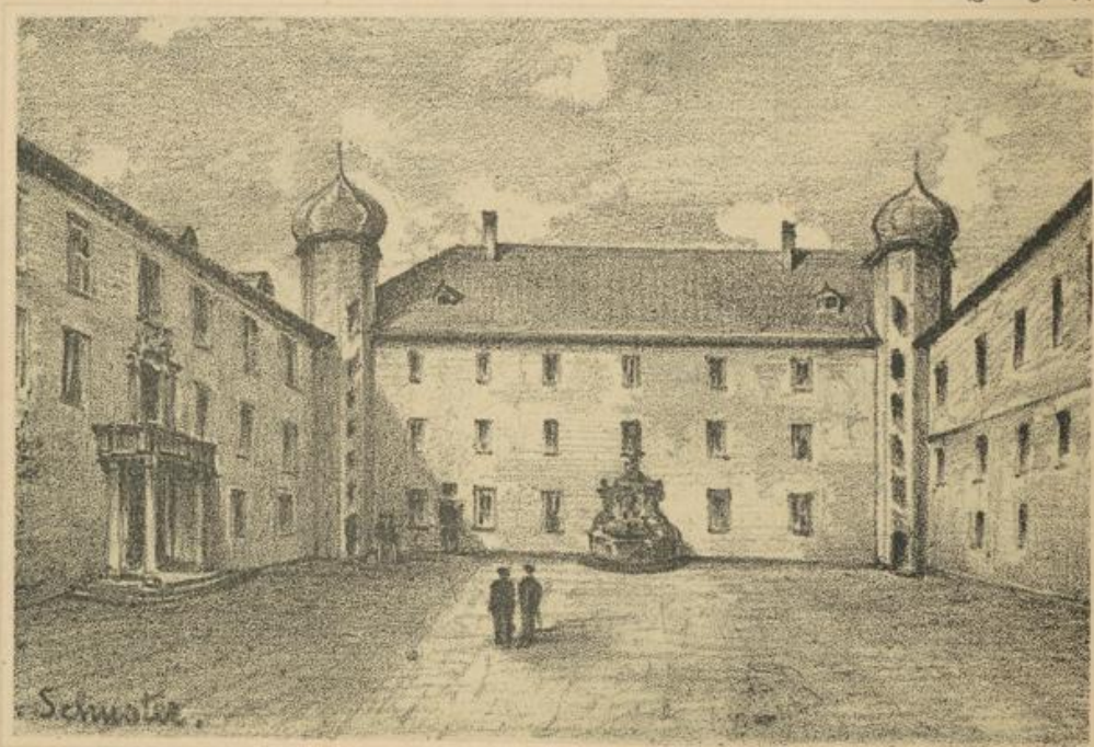
Hof des Schloßes in Ettlingen.