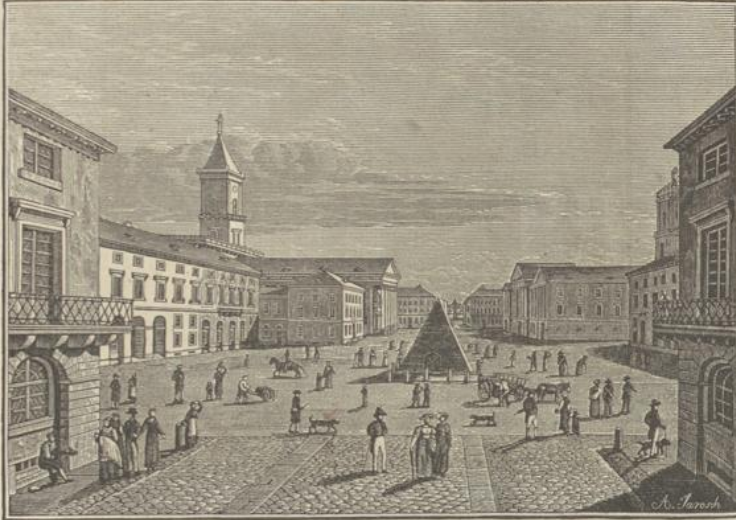
MARKTPLATZ IN KARLSRUHE.

schloß, Markgraf Karl Wilhelm legte aber in Fächerform 1715 eine Stadt an, wovon der mittlere Schloßthurm den Mittelpunkt bildet, und von ihm aus laufen wie Strahlen die Straßen, und im nahen Hardwald die Alleen; um das Schloß zieht sich in einem großen Bogen der Zirkel, und neun Querstraßen ziehen aus diesem in die Hauptstraße. Der Flächeninhalt der Stadt mit seinen Gärten ist \frac{1}{4} □ Meile. Sie hat sechs Thore, und zwar: das Ruppurrer-, Ettfinger-, Karls-, Mühlburger-, Ludwigs- und Durlacher-Thor. An öffentlichen Plätzen sind merkwürdig: der Schloßplatz; der Marktplatz, mit einer steinernen Pyramide, unter welcher die Ueberreste des Er-