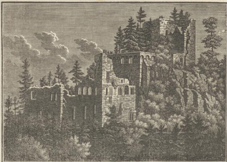
ALTES SCHLOSS BADEN.

Merkwürdigkeiten der Stadt sind: die Pfarrkirche mit den Begräbnisplätzen und Monumenten der Markgrafen von Baden; das neue Schloß mit den Souterrains oder unterirdischen Gewölben; die Antiquitätenhalle, wo mehrere römische Denkmäler aufgestellt sind; die Trinkhalle mit den Reservoirs zur Abkühlung des heißen Wassers; das Dampfbad; das Promenade- oder Konversationshaus, ein Lustort für die Kurgäste, mit prachtvollen Sälen; in seiner Nähe herrliche Promenaden. Ueberhaupt umgeben treffliche Spaziergänge die Stadt. Man besucht die Ruinen der alten großen Burg, ehemals genannt Hohenbaden; die Ebersteinburg; das Jagd-