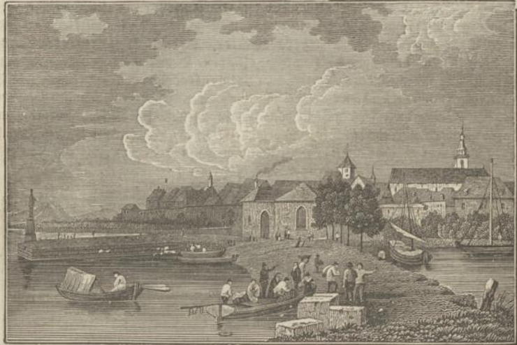
DER HAFEN VON RADOLFZELL.

Langhaus noch von Radolf herrührt; der schadhafte Thurm stammt vom Jahr 1436, in welchem Jahr ihn Friedrich von Wartenberg, Abt in Reichenau, erbaute; das neue,