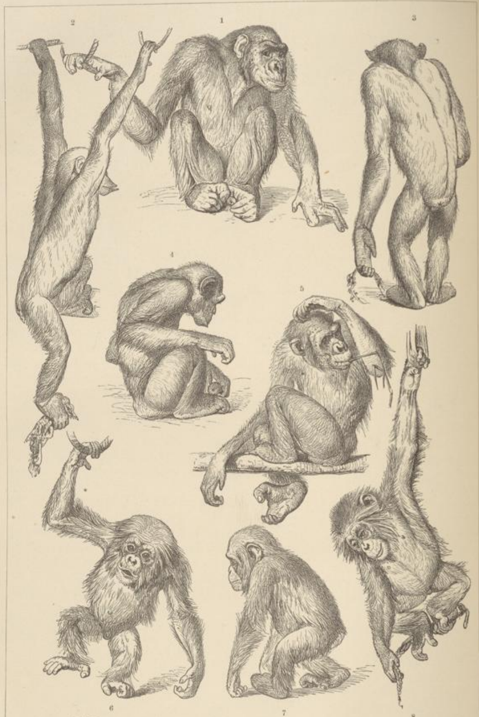
Stellungen verschiedener Menschenaffen. (Erstes Blatt.) 1-5 Orango, 6-8 Schimpanse.