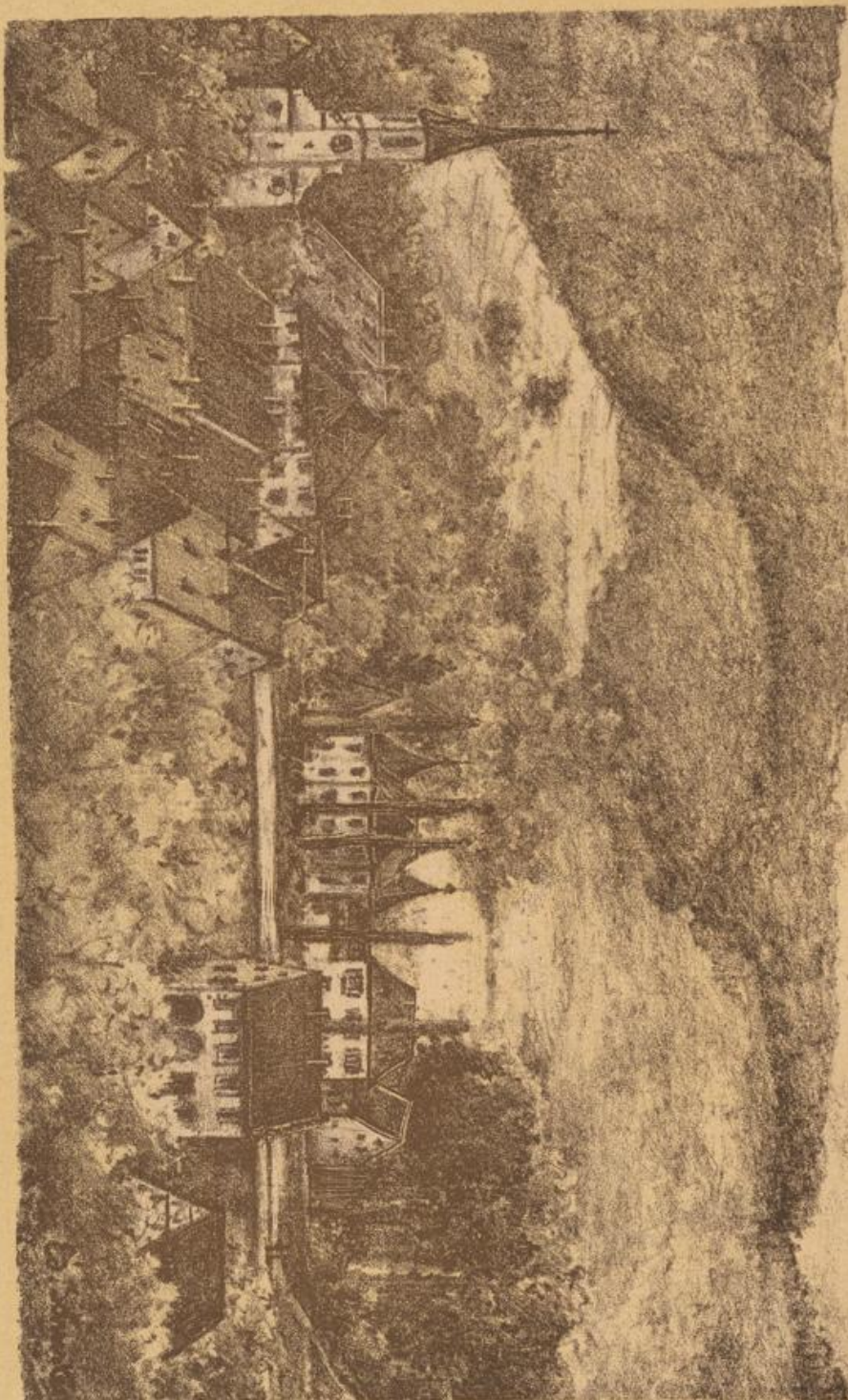
Geinbach mit dem alten und neuen Schloß. (Das alte Schloß im Vordergrund.)