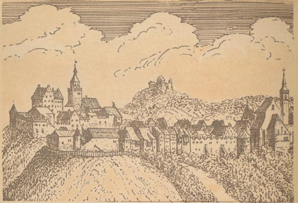
Engen um 1640 (nach Merian).