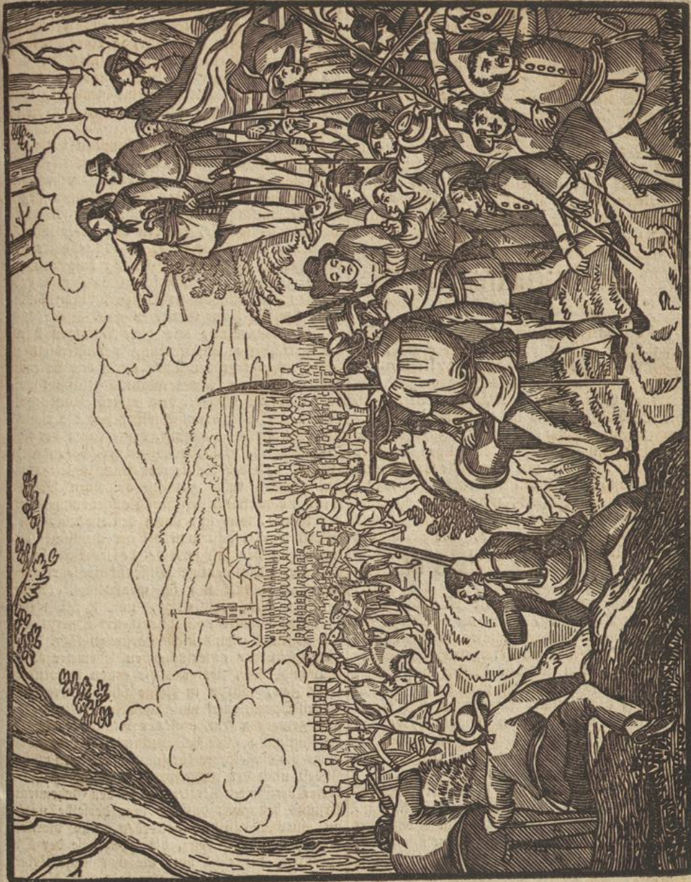
Tod des Generals Friedrich Saladin v. Gagern.