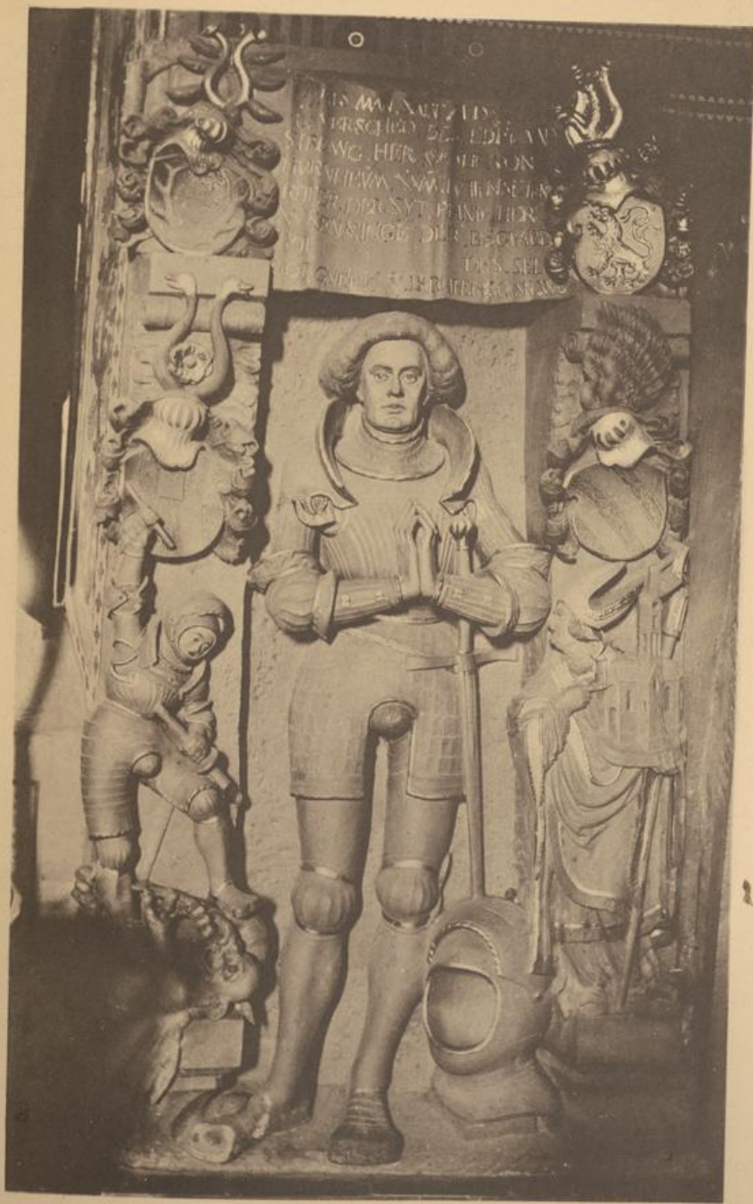
Kenzingen. Pfarrkirche. Stein-Epitaph des Wolf von Hürnheim.